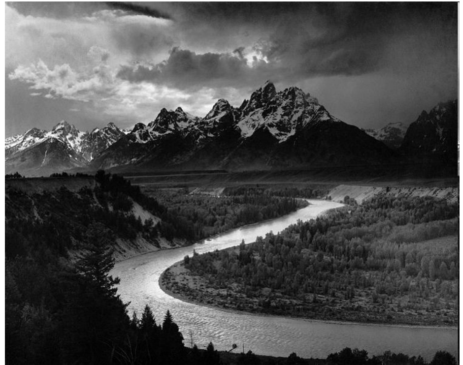
Фотография Энсела Адамса Хребет «Большой Титон» и река Снейк

Форма бытия искусства - художественное произведение, имеющее видовую и жанровую определенность и осуществляющееся в качестве материального предмета знака, который передает людям определенную художественную концепцию, обладающую эстетической ценностью