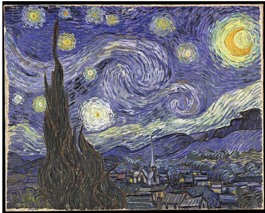
Винсент Ван Гог Звёздная ночь, 1889 г.

Жизнь людей отражается в искусстве во всем многообразии в форме художественных образов , которые, будучи результатом вымысла, тем не менее являются отражением действительности и всегда несут на себе отпечаток реально существующих предметов, событий и явлений