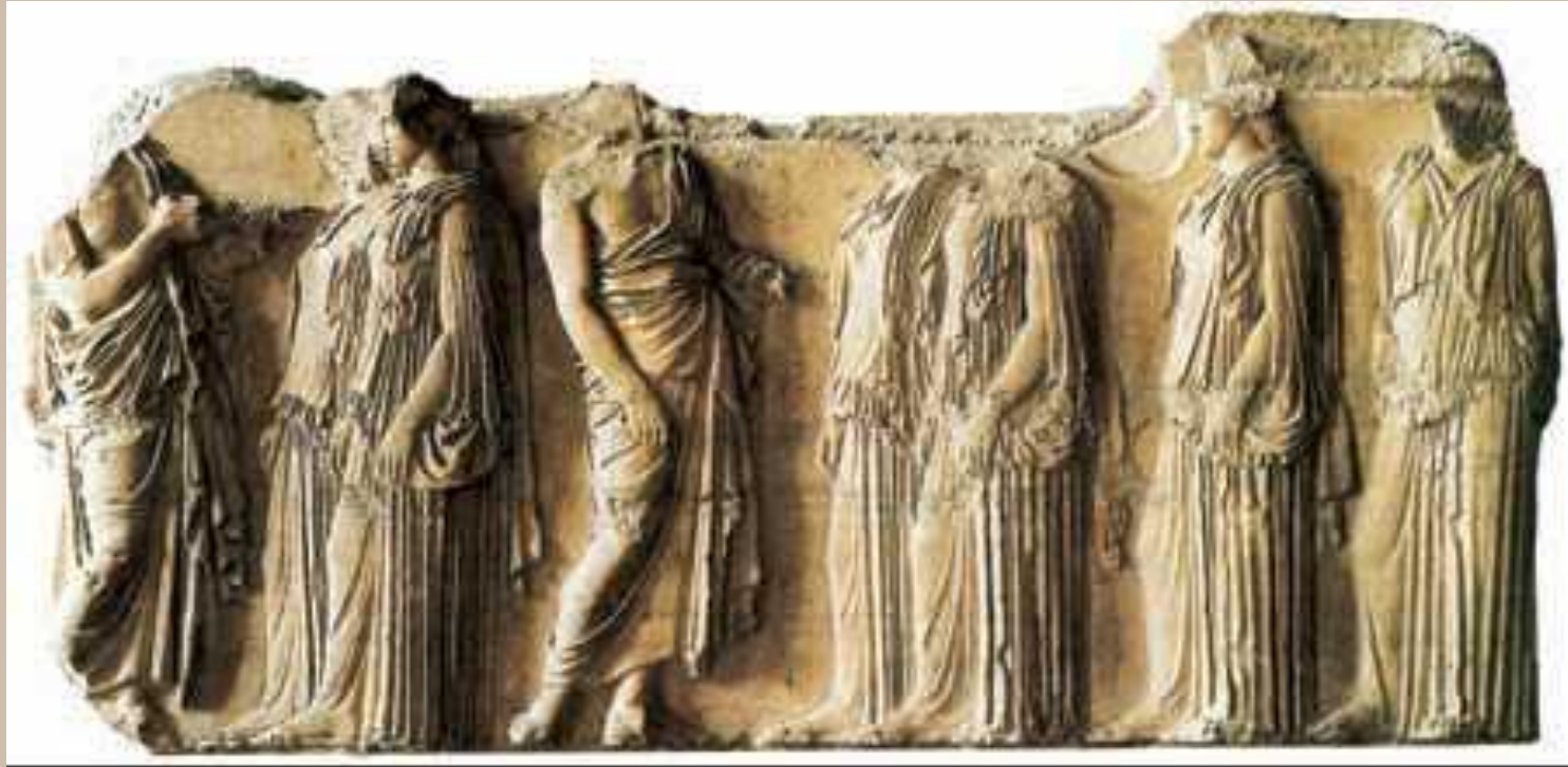
Фидий и помощники. «Панафинейское шествие». Рельеф фриза Парфенона. Мрамор. 438—32 гг. до н. э. Британский музей. Лондон. Фрагмент