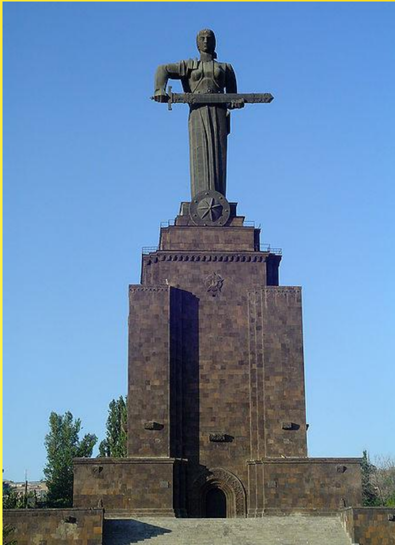
Мать - Армения

Мать-Армения — монумент в Ереване в честь победы Советского Союза в Великой Отечественной войне в Ереване. Высота 54 метра, выполнен из бронзы и гранита. Монумент, созданный скульптором Ара Арутюняном и архитектором Рафаелом Исраеляном, представляет собой образ матери, вкладывающей меч в ножны.