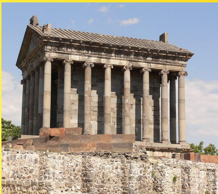
Храм бога Солнца в Гарни

Архитектура Армении имеет давние традиции. Крепость Гарни начали строить еще во II веке до нашей эры и продолжали застраивать в течение античной эпохи и в средние века. Главное место там занимал храм бога Солнца Митры (I век н.э.). Непрístupная цитадель защищала своих жителей от иноземных нашествий 1000 лет.