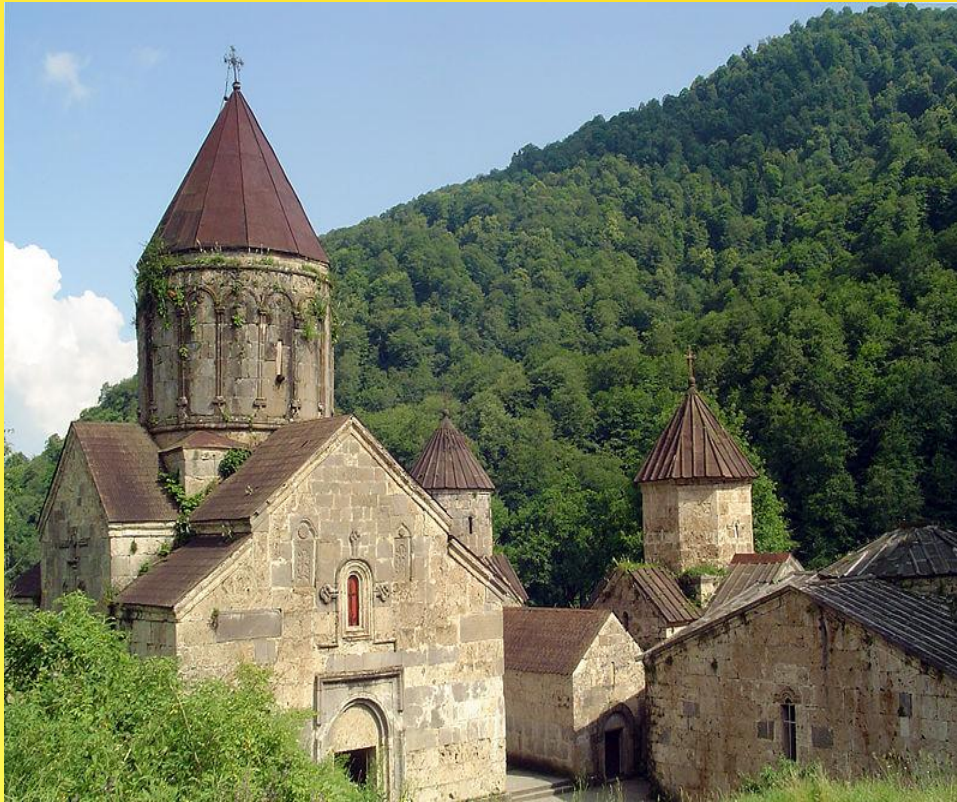
Церковь Святой Богородицы в Агарцине

Для средневековой храмовой архитектуры Армении характерны крестово-купольные здания с пышным декоративным оформлением фасадов. Монастырь Агарцин был построен в X—XIII веках. Его крупнейший храм - церковь Святой Богородицы (1287). На территории монастыря также находятся храм Святого Григория, храм Святого Степаноса и трапезная.