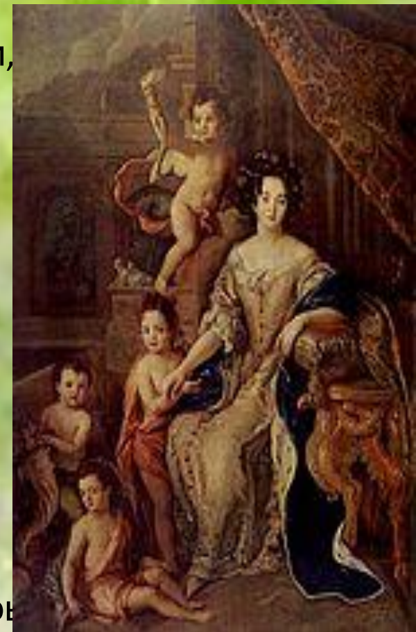
Мадам де Монтеспан , женщина эпохи барокко

дикости, вульгарности и сумасбродства. Для филозофа