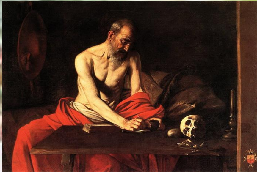
Караваджо. Святой Иероним

Стиль барокко в живописи характеризуется динамизмом композиций, «плоскостью» и пышностью форм, аристократичностью и незаурядностью сюжетов. Самые характерные черты барокко — броская цветистость и динамичность; яркий пример — творчество Рубенса и Караваджо .