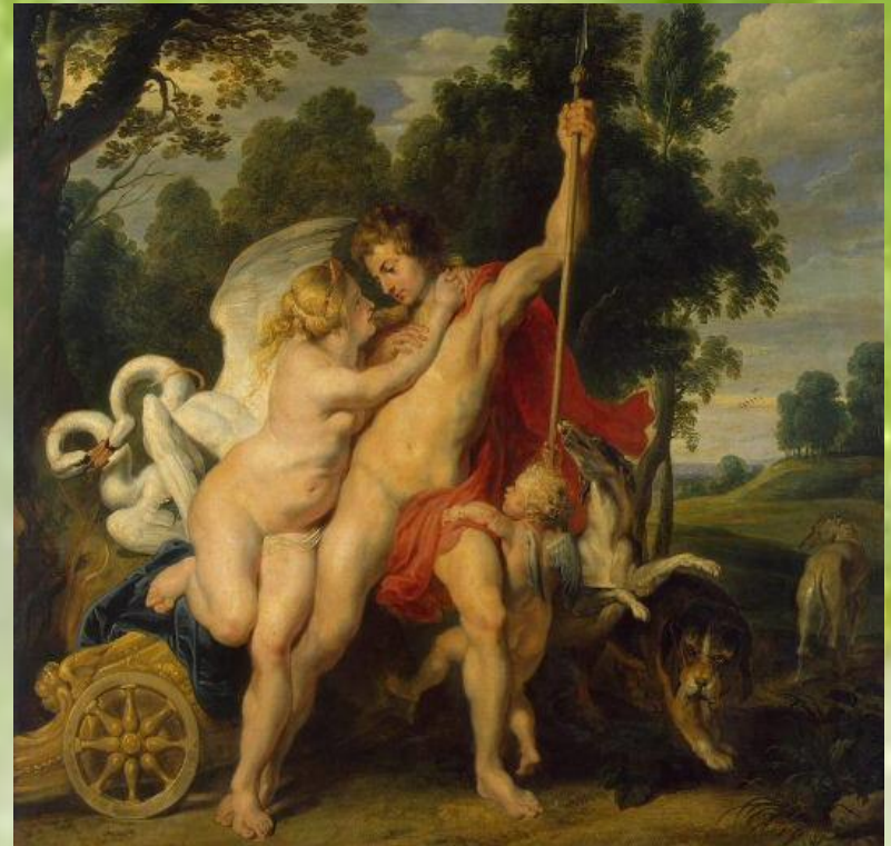
Рубенс. Венера и Адонис.