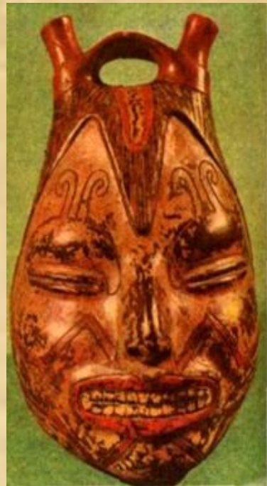
Сосуд. Керамика. Культура инков.