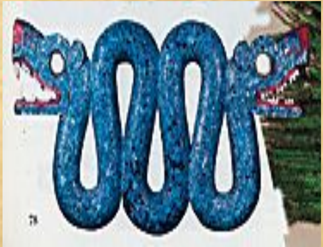
Двуглавая ацтекская змея, выложенная мозаикой из бирюзы.