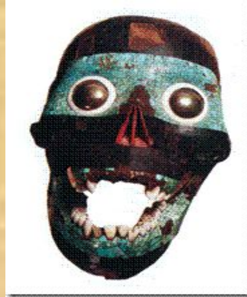
Человеческий череп, покрытый мозаикой из бирюзы и обсидиана