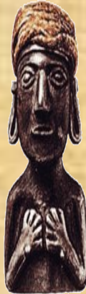
Верховный правитель Инка.