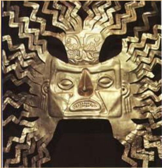
Золотая маска периода культуры инков.