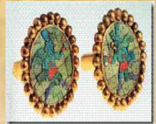
Серьги. Доколумбова эпоха