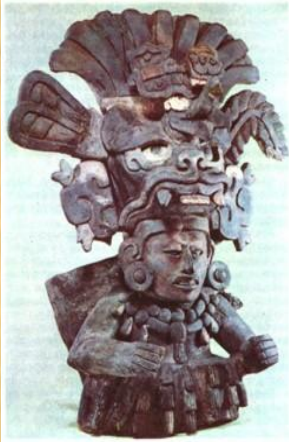
Ритуальная урна (деталь).