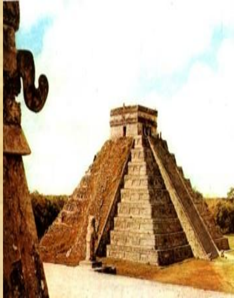
Храм Кастильо. XI — 1-я половина XII в. Чичен-Ица (Мексика). Культура майя.