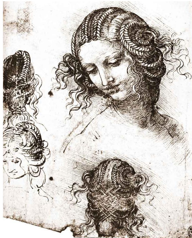
"Леда и лебедь". Фрагмент.

Леда – жена царя Спарты Тиндарея, упоминается в «Илиаде» и «Одиссее».