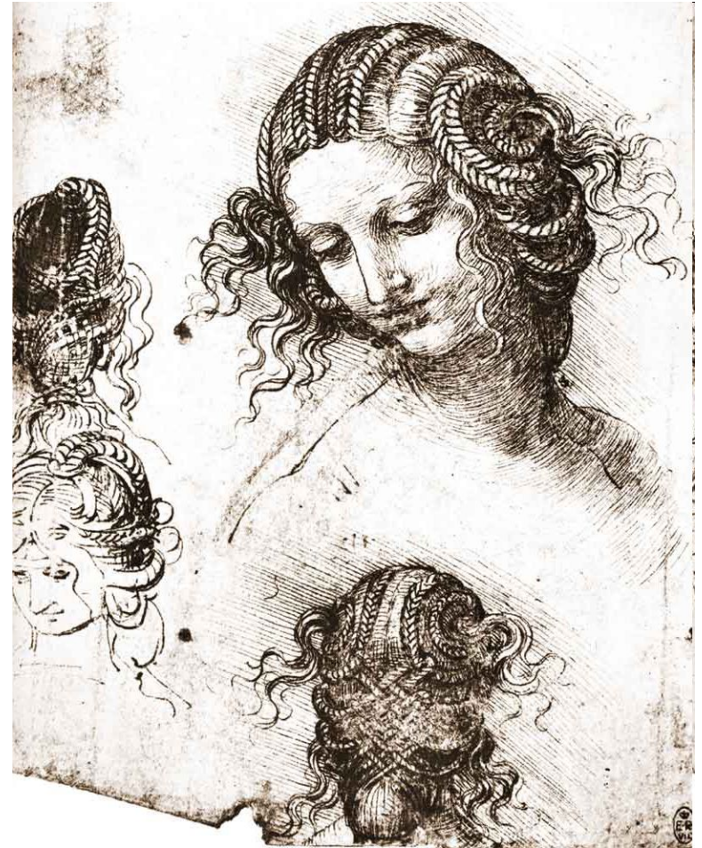
"Леда и лебедь". Фрагмент.

Леда – жена царя Спарты Тиндарея, упоминается в «Илиаде» и «Одиссее».