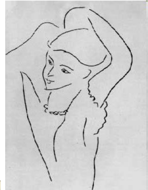
А. Матисс. Одевающаяся женщина. Ок. 1940. Б., тушь, перо. ГМИИ