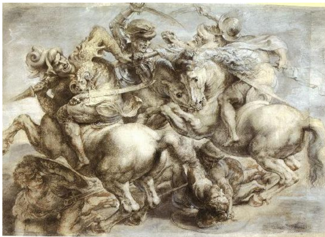
Рисунок Леонардо Рисунок Леонардо