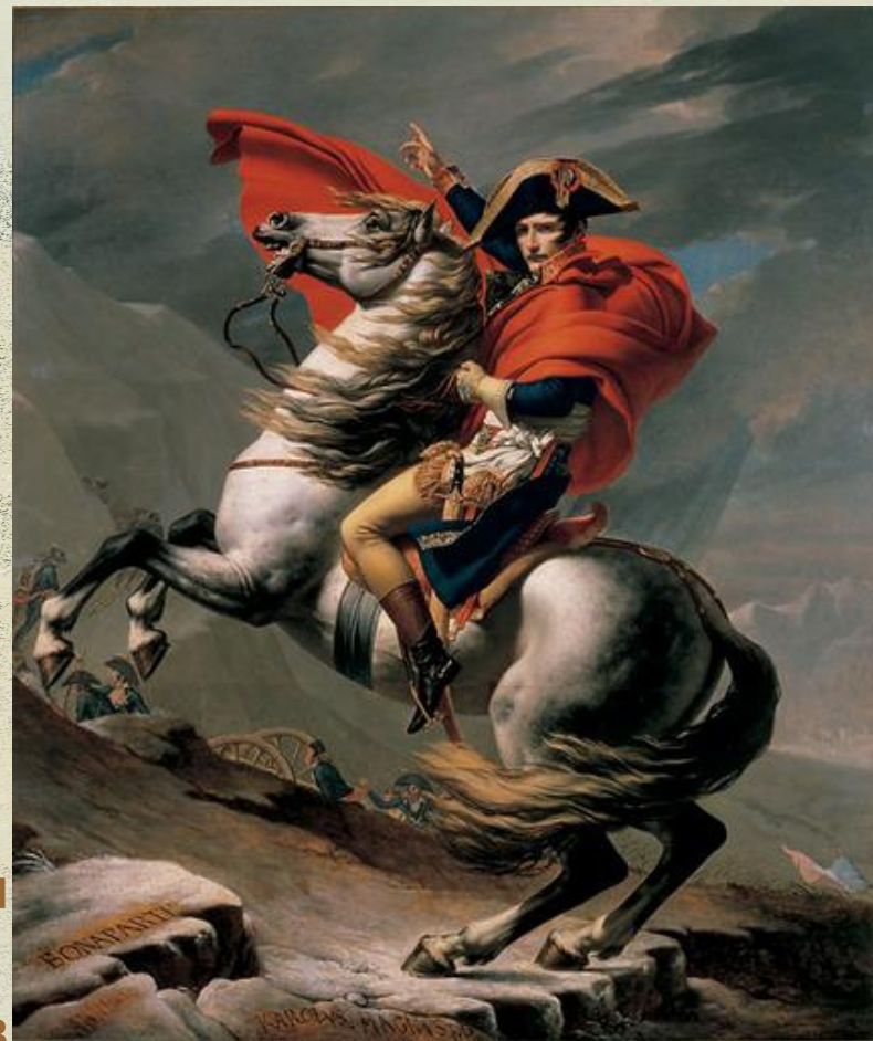
Луи Дэвид Наполеон верхом в C-Bernard Pass

По указу Наполеона I, который хотел обессмертить славу своей армии, построены Триумфальные ворота в Париже. На стенах арки выгравированы имена генералов, сражавшихся вместе с императором.