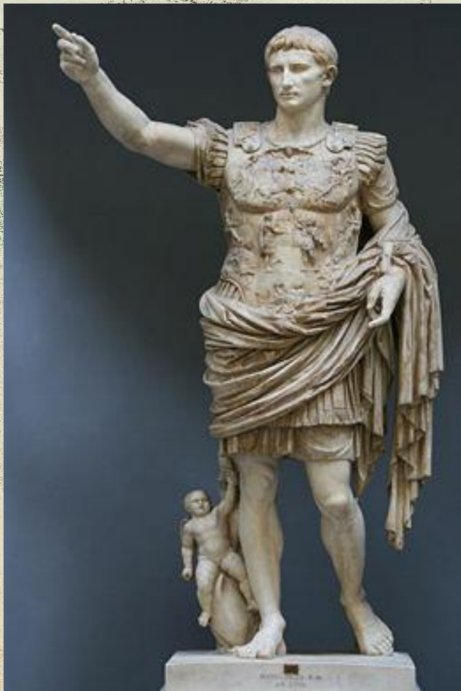
Август из Прима Порто. Римская статуя