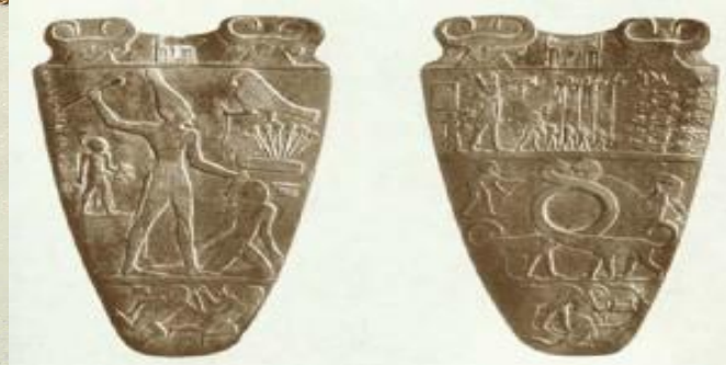
Палетка Нармера. Древний Египет

Искусство, как проявление свободных, творческих сил человека, полет его фантазии и духа часто использовалось для укрепления власти. Скульпторы, художники, музыканты в разные времена создавали идеализированные величественные образы правителей-вождей.