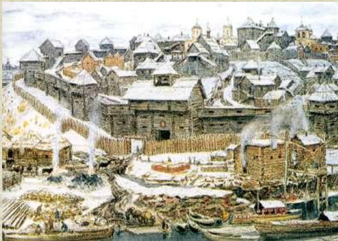
Московский Кремль при Иване Калите Акварель А.М. Васнецов

Московский Кремль: символ Москвы и России. Это бывшая резиденция Русских царей и патриархов. Кремль содержит уникальную коллекцию исторических архитектурных и культурных предметов.