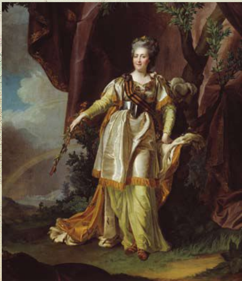
Д. Левицкий. Екатерина II

Двор московских царей становится местом проживания многих культурно образованных православных людей. В их числе архитекторы и строители, иконописцы и музыканты.