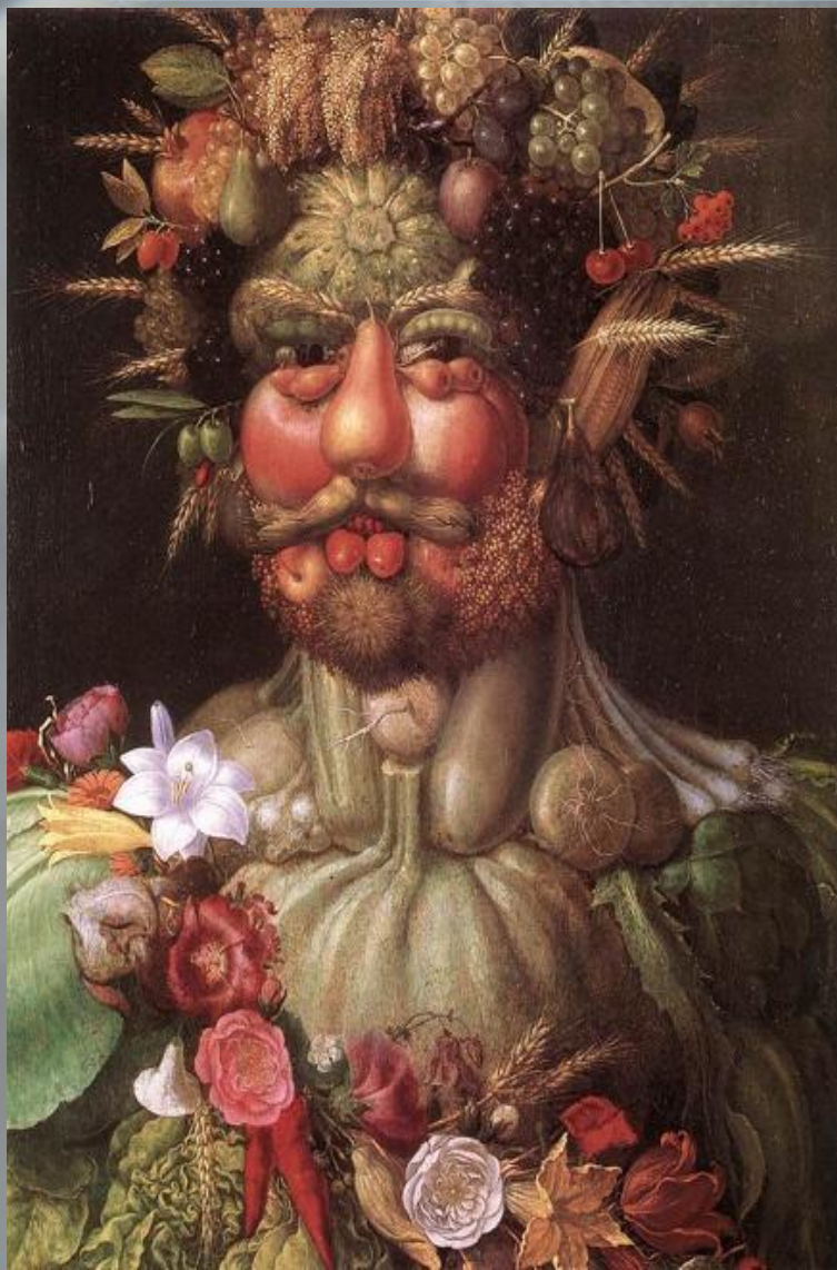
Портрет Рудольфа II.

Учение о живом космосе Арчимбольдо воплотил в знаменитом портрете Рудольфа II в виде Вертумна — этрусского божества садов и обработки земли. Именно в нем, как ни странно, художник обнаружил удивительное сходство с королем. Какое изобилие плодов и цветов! Настоящий праздник урожая! Тяжелый массивный подбородок короля зарос кустистой бородой в виде колючек. Одутловатые круглые щеки напоминают наливные красные яблоки и персики. Черные круглые блестящие глаза изображают вишня и ежевика. Выпуклый лоб напоминает тыкву, оттопыренные уши — початки кукурузы, стручки гороха примостились над губами, а каштан — на подбородке. Совершенно изумительно выглядит прическа в виде переплетенных кистей винограда, гранатов и колосков пшеницы.