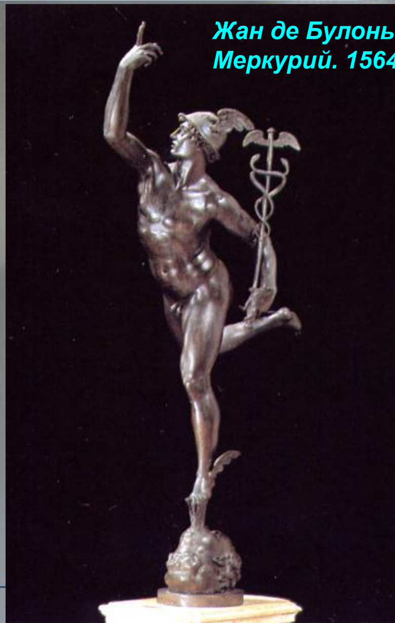
Жан де Булонь. Меркурий. 1564 г.

В 1564 г. Жан де Булонь создал изящную фигуру парящего в воздухе Меркурия . Преодолевая тяжесть материала, скульптору действительно удалось создать впечатление легко взмывающей вверх фигуры божественного посланника, едва касающегося земли, а точнее, воздушной струи, выдуваемой маской южного ветра. Фигуре Меркурия художник придал предельную утонченность и одухотворенность.