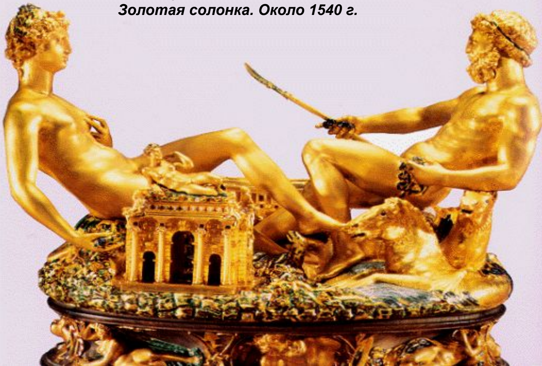
Бенvenuto Челлини. Золотая солонка. Около 1540 г.