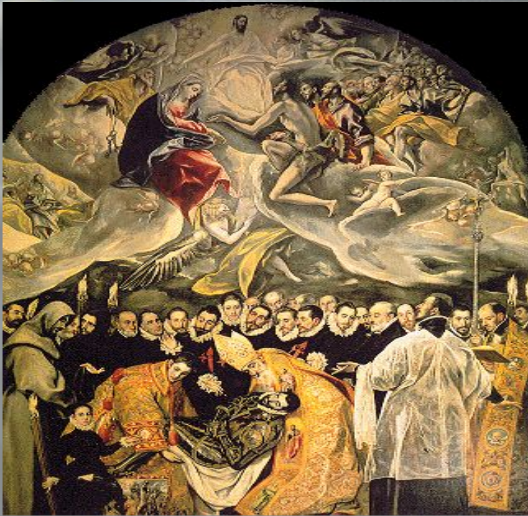
Эль Греко. Погребение графа Оргаса. 1586 г. Церковь Сан-Томе, Толедо

Картина четко делится на две композиционные части: верхнюю (небесную), передающую стремительность движения, и нижнюю (земную), исполненную торжественного покоя. В небесных сферах наше внимание привлекают причудливые формы облаков, вихревое кругообразное движение небесной тверди с целым сонмом ангелов, праведников и святых. В разверзшихся небесах, в потоках мерцающего света мы видим Христа, Деву Марию и Иоанна Крестителя: они пропускают на небеса душу умершего графа.