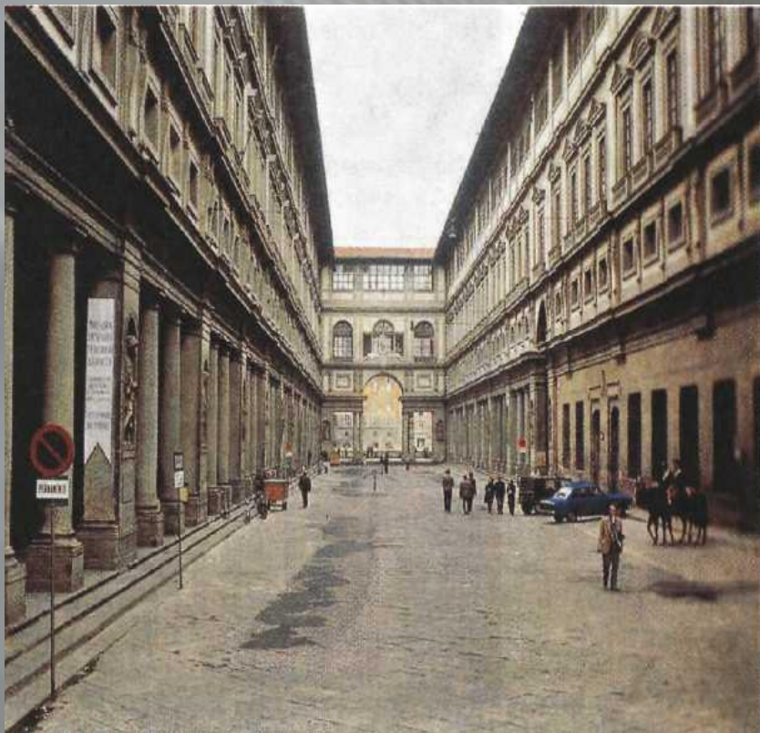
Джорджо Вазари. Уффици. 1560 г. Флоренция

Формирование маньеризма в архитектуре связано с творчеством флорентийских мастеров во главе с Джорджо Вазари . Во Флоренции он построил здание административных учреждений — Уффици , в котором сейчас находится всемирно известная картинная галерея. Два корпуса здания, обрамляющие улицу, создают своеобразный тоннель, оформленный трехпролетной аркой в сторону реки Арно. И хотя Вазари не суждено было завершить задуманный проект, ему все же удалось сказать свое слово в архитектуре маньеризма.