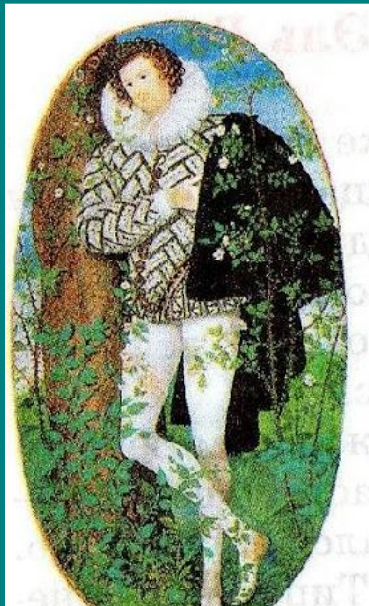
ПОРТРЕТ ЮНОШИ СРЕДИ РОЗОВЫХ КУСТОВ