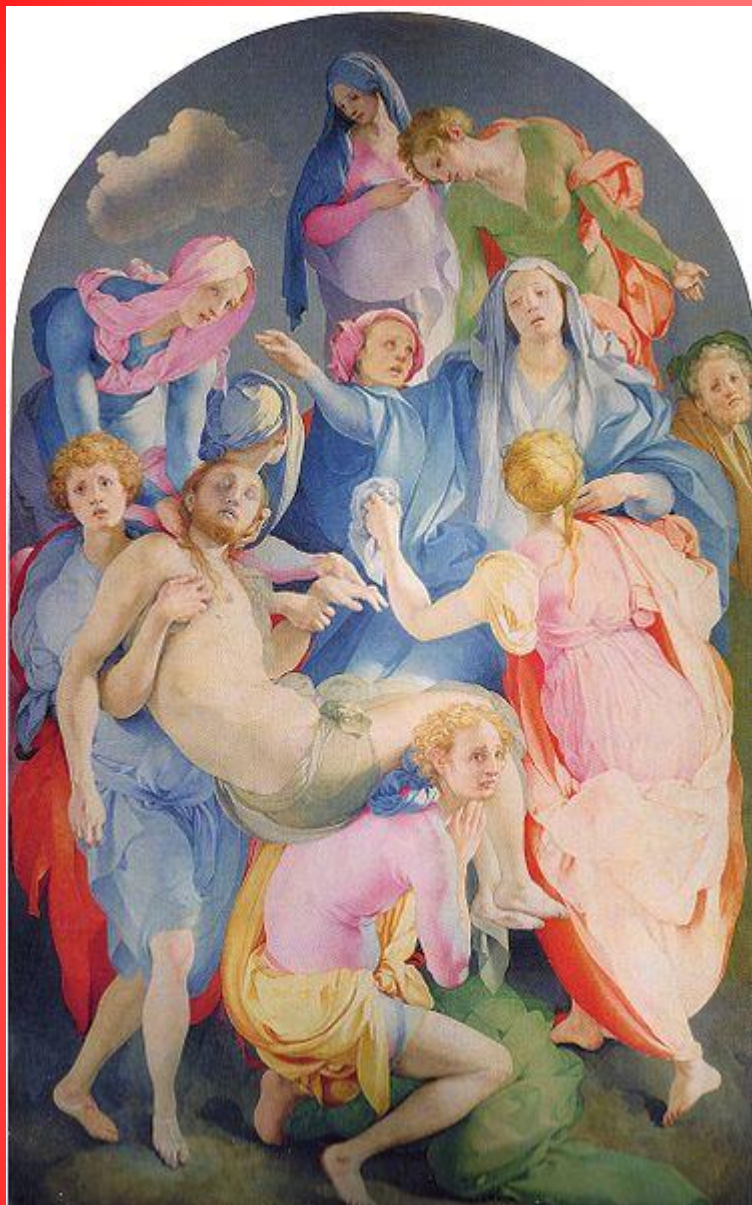
Якопо Понтормо. Снятие с креста.