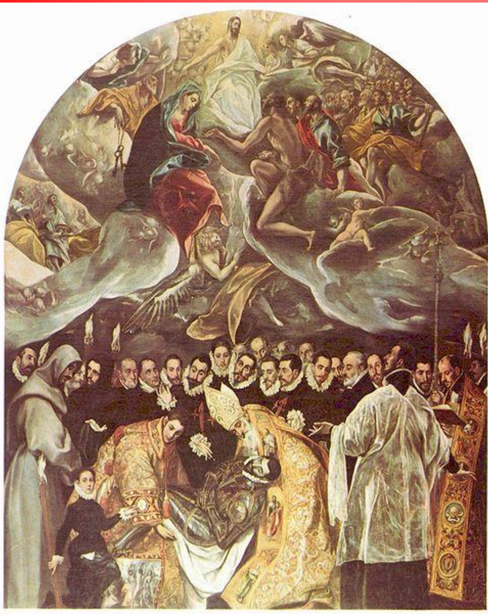
Эль Греко Погребение графа Органасо