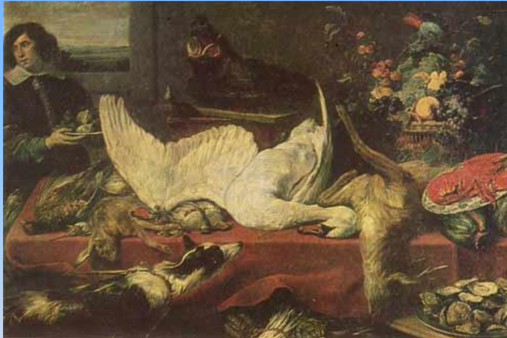
Франс Снейдерс. (1579-1657) Фламандская школа. Натюрморт с лебедем. Холст, масло. Около 1615-1620. Государственный музей изобразительных искусств имени А. С Пушкина.

Снейдерс с любовью и мастерством передает цвет, форму, фактуру предметов, объединяя их в роскошные, декоративно-целостные циклы картин, ранее украшавшие дворцы европейской знати. Он охотно вводит фигуры и полуфигуры людей, животных, иногда помещает небольшие жанровые сценки, например, собаку, бросающуюся на кошку; обезьяну, крадущую фрукты, беседующих лавочницу и покупательницу. Эти сцены имели скрытый аллегорический смысл, хорошо понятный современникам, чаще всего указывали на людские пороки. Обычно в натюрмортах Снейдерса человеческие фигуры теряются среди изобилия земных даров. Его произведения близки к бытовому жанру, но часто сюжетное начало играет в них второстепенную роль. Цель художника создать красочное пиршество из плодов родной земли.