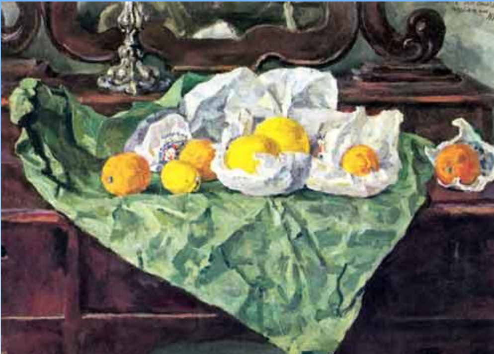
П. П. Кончаловский (1876-1956) Натюрморт. Апельсины и мятая бумага. Холст, масло. 1946. Государственная Третьяковская галерея

Социальные тенденции нашли отражение в экспрессивных, скупых по подбору предметов произведениях мексиканцев Д. Риверы, Д. Сикейроса, итальянца Гуттузо. Весьма своеобразны натюрморты представителей поп-арта - одного из направлений в европейском и американском искусстве, провозгласивших после засилья абстракционизма (возвращение к реальности). Работы поп-артистов воспроизводят предметы домашнего обихода, упаковку товаров, детали машин и рассчитаны на многообразные ассоциации у зрителей, иногда с нотами иронии и неприятия лозунгов "потребления ради потребления".