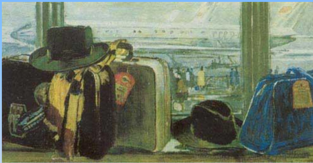
Ю. Пименов Дальняя дорога. Масло. 1959.

На начало 20 века приходится и расцвет русского натюрморта. К. Коровин и мастера объединения (Бубновый валет) создают мажорные, сочные по цвету произведения, воспевающие полную красоту бытия. Поэтичные работы исполняют И. Грабарь, художники (Мира искусства), тонкие декоративные мастера (Голубой розы)