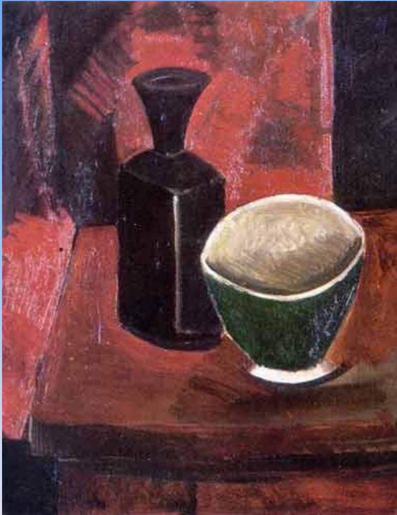
Пабло Пикассо. 1881-1973 Зеленая миска и черная бутылка Холст, масло. Государственный Эрмитаж.

Интерес к натюрморту значительно усиливается во второй половине прошлого века. Импрессионисты во Франции ставят акцент на живописном восприятии мира вещей, решают проблемы световых и цветовых отношений, нередко трактуют натюрморт как своеобразное декоративное панно. Постимпрессионисты разрабатывают сложные проблемы композиционного и цветового решения картины, выявляют материальную вещественность мира.