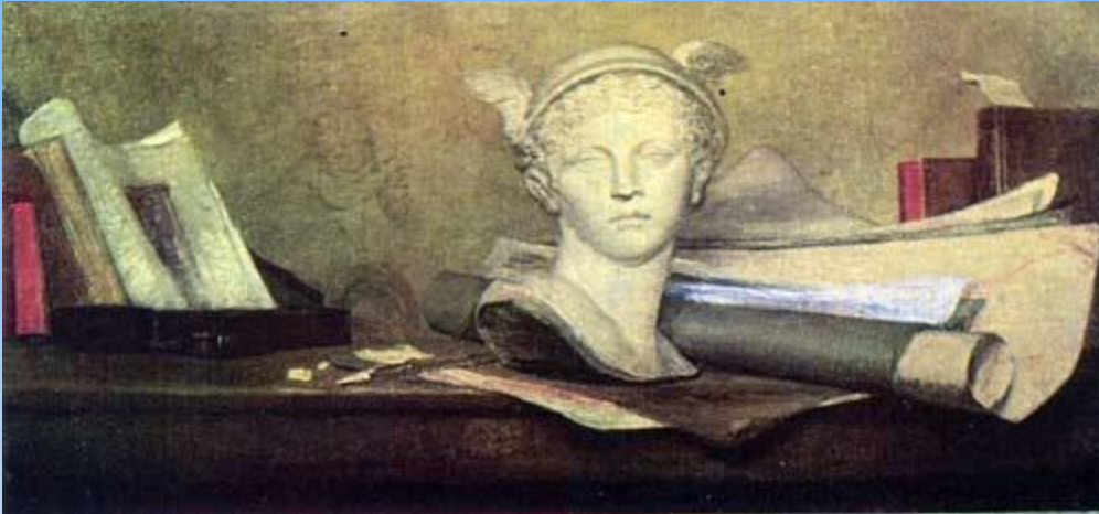
Жан Батист Симеон Шарден (1699-1779). Французская школа Натюрморт (Атрибуты искусств). Холст, масло.

Художественная доктрина классицизма отнесла натюрморт к числу “низменных жанров, однако именно в 18 веке появляются великолепные полотна Ж. Б. Шардена, оживляющего мир “мертвой природы”. С развитием академической системы образования возникает учебный, или постановочный, натюрморт, ставший одним из обязательных элементов обучения.