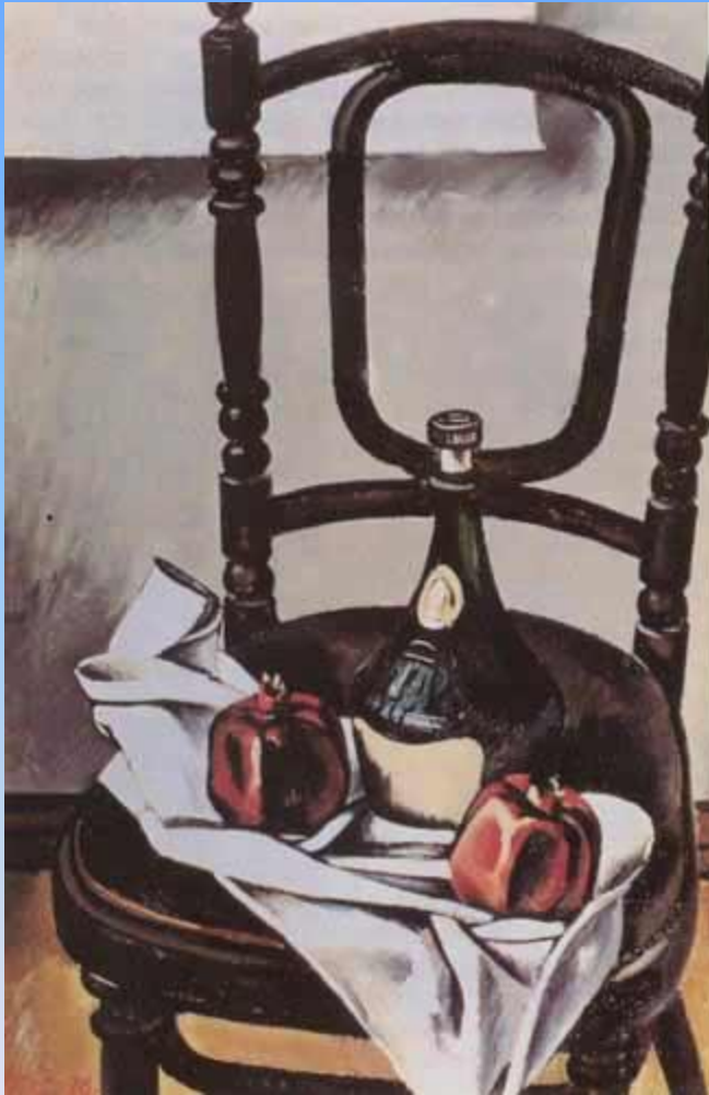
Т. Салахов Натюрморт с венским стулом. Масло. 1976.

Своеобразные по манере, отражающие существенные особенности современной эпохи натюрморты были созданы и 40-50 годах П.Кузнецовым, Ю Пименовым. В 60-80-х годах тяготение к повышенной предметности изображения, стремление к эстетизации окружающего человека мира вещей обусловили интерес к натюрморту многих советских художников (В. Стожаров, А.Никич, Т. Нариманбеков).