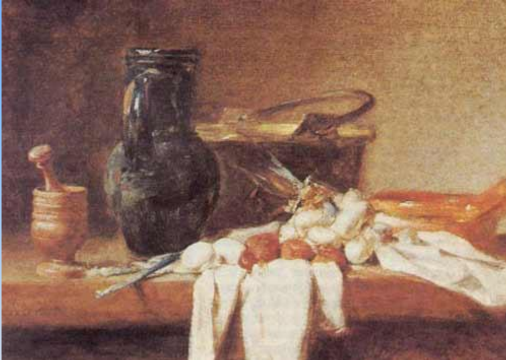
Жан Батист Симеон Шарден (1699-1779). Французская школа Натюрморт с кувшином и медным котелком. Масло. 1728-1732. Лугано, собрание Тиссен-Борнемиса.

Наиболее распространенной разновидностью натюрморта является изображение предметов домашнего обихода. Этот тип натюрморта тесно связан с развитием бытового жанра, интерьера, пейзажа и ярко расцвел в западноевропейском искусстве XVII века. Каждая национальная художественная школа по-своему, самобытно решила эту проблему.