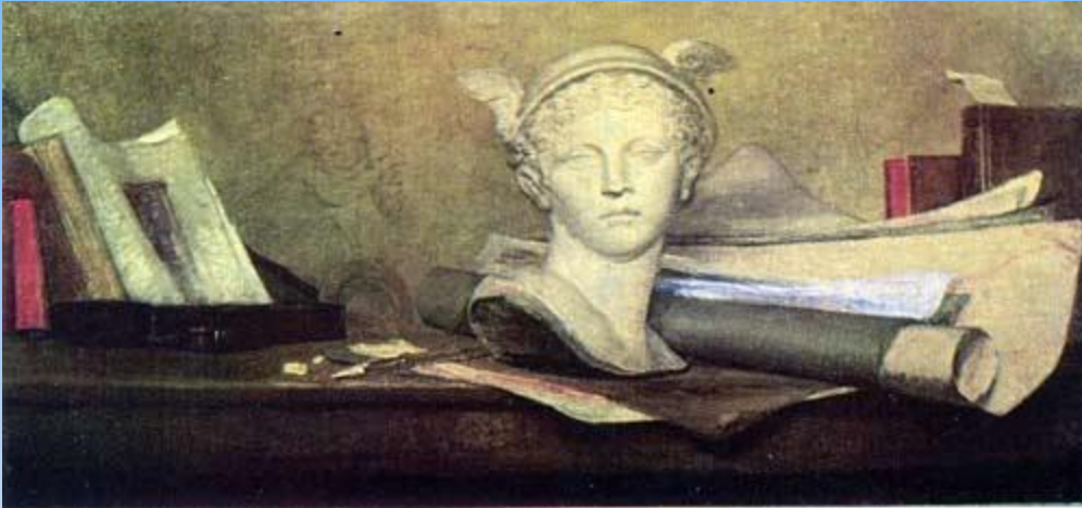
Жан Батист Симеон Шарден (1699-1779). Французская школа Натюрморт (Атрибуты искусств). Холст, масло.

Художественная доктрина классицизма отнесла натюрморт к числу “низменных жанров, однако именно в 18 веке появляются великолепные полотна Ж. Б. Шардена, оживляющего мир “мертвой природы”. С развитием академической системы образования возникает учебный, или постановочный, натюрморт, ставший одним из обязательных элементов обучения.