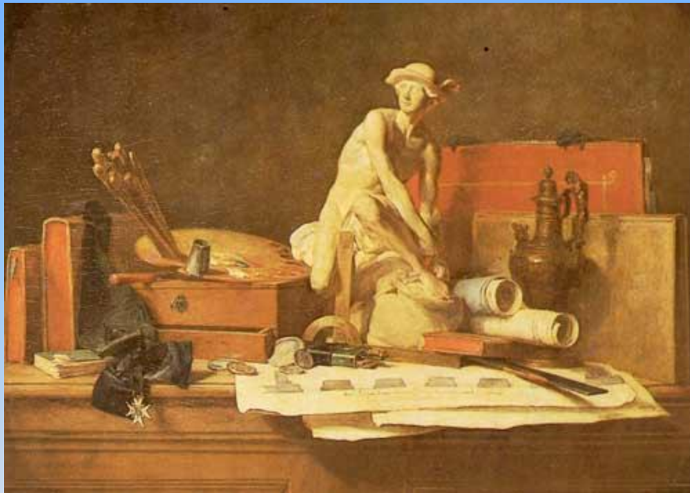
Жан Батист Симеон Шарден (1699-1779). Французская школа Натюрморт с атрибутами искусств. Холст, масло. 1766. Государственный Эрмитаж.

В знаменитой “Естественной истории” древнеримский ученый, писатель и государственный деятель Плиний Старший рассказывает о споре между греческими живописцами Зевксисом и Паррасием: Зевксис столь правдоподобно написал виноградные гроздья, что голодные птицы слетались их клевать. Паррасий же настолько совершенно изобразил занавес в своей мастерской, что сам Зевксис принял его за настоящий. После этого Зевксис признал себя побежденным, так как ему удалось обмануть лишь птиц, в то время как Паррасий ввел в заблуждение его самого – прославленного мастера, виртуозно владеющего приемами светотеневой моделировки.