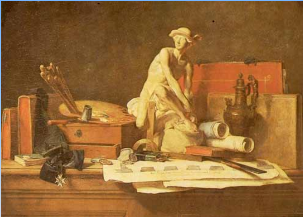
Жан Батист Симеон Шарден (1699-1779). Французская школа Натюрморт с атрибутами искусств. Холст, масло. 1766. Государственный Эрмитаж.

В знаменитой “Естественной истории” древнеримский ученый, писатель и государственный деятель Плиний Старший рассказывает о споре между греческими живописцами Зевксисом и Паррасием: Зевксис столь правдоподобно написал виноградные гроздья, что голодные птицы слетались их клевать. Паррасий же настолько совершенно изобразил занавес в своей мастерской, что сам Зевксис принял его за настоящий. После этого Зевксис признал себя побежденным, так как ему удалось обмануть лишь птиц, в то время как Паррасий ввел в заблуждение его самого – прославленного мастера, виртуозно владеющего приемами светотеневой моделировки.