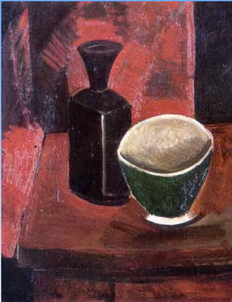
Пабло Пикассо. 1881-1973 Зеленая миска и черная бутылка Холст, масло. Государственный Эрмитаж.

Интерес к натюрморту значительно усиливается во второй половине прошлого века. Импрессионисты во Франции ставят акцент на живописном восприятии мира вещей, решают проблемы световых отношений, нередко трактуют натюрморт как своеобразное декоративное панно. Постимпрессионисты разрабатывают сложные проблемы композиционного и цветового решения картины, выявляют материальную вещественность мира.