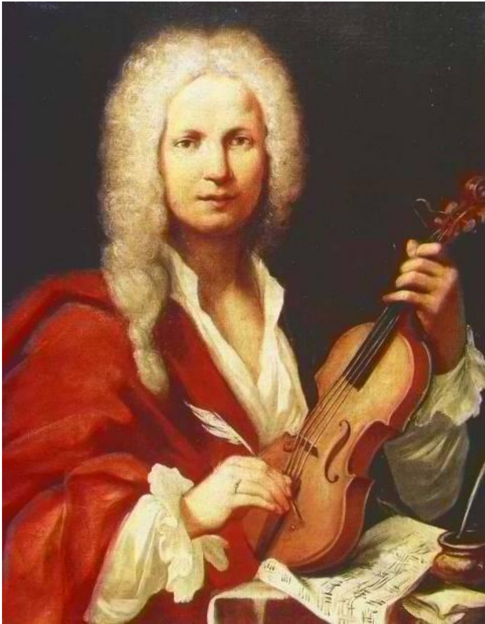
Ф. Морелон дё ля Кавэ «Антонио Вивальди»