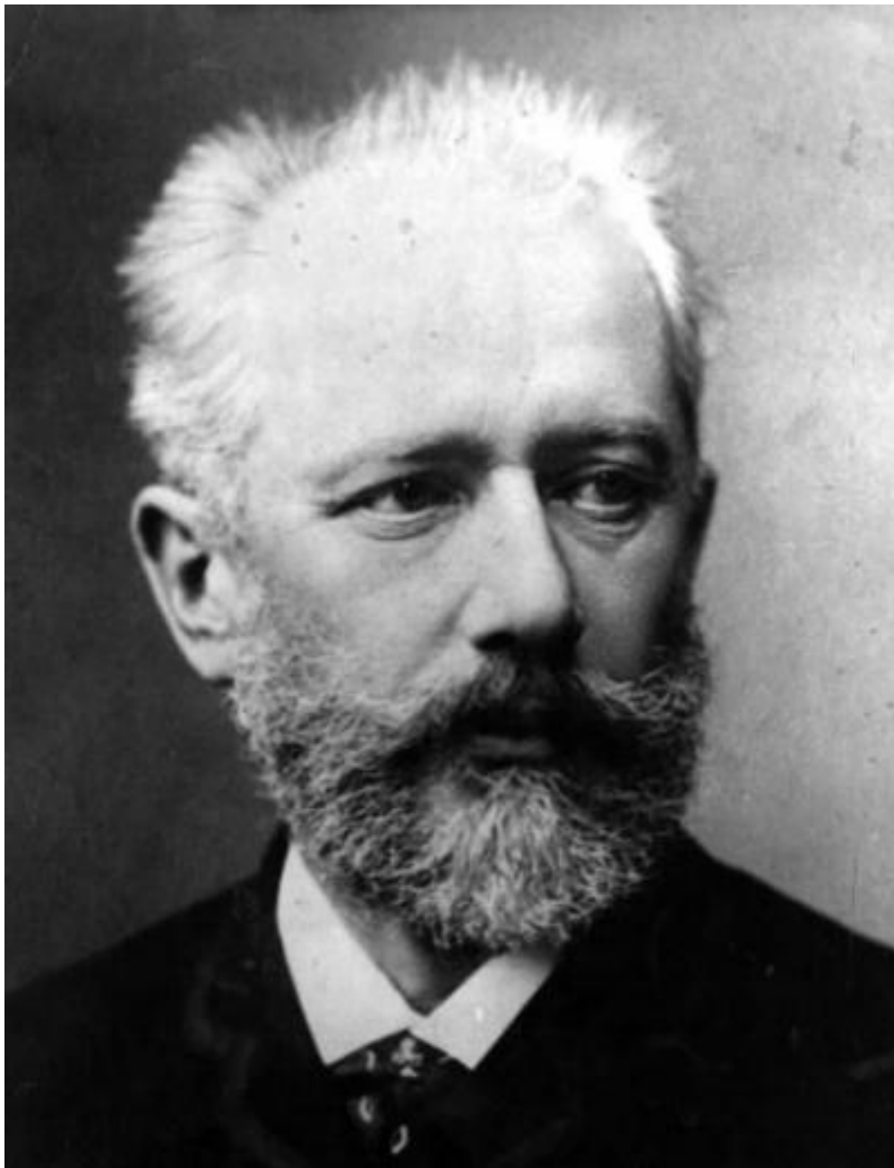
Кузнецов Николай – «Портрет композитора Петра Ильича Чайковского»