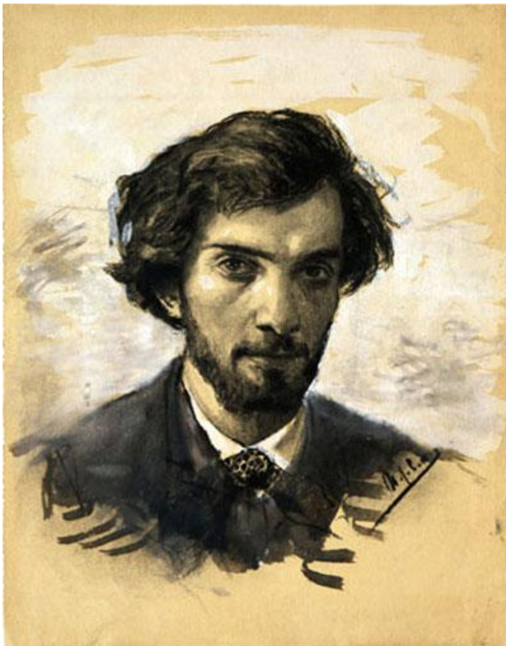
«Автопортрет» – Исаак Левитан