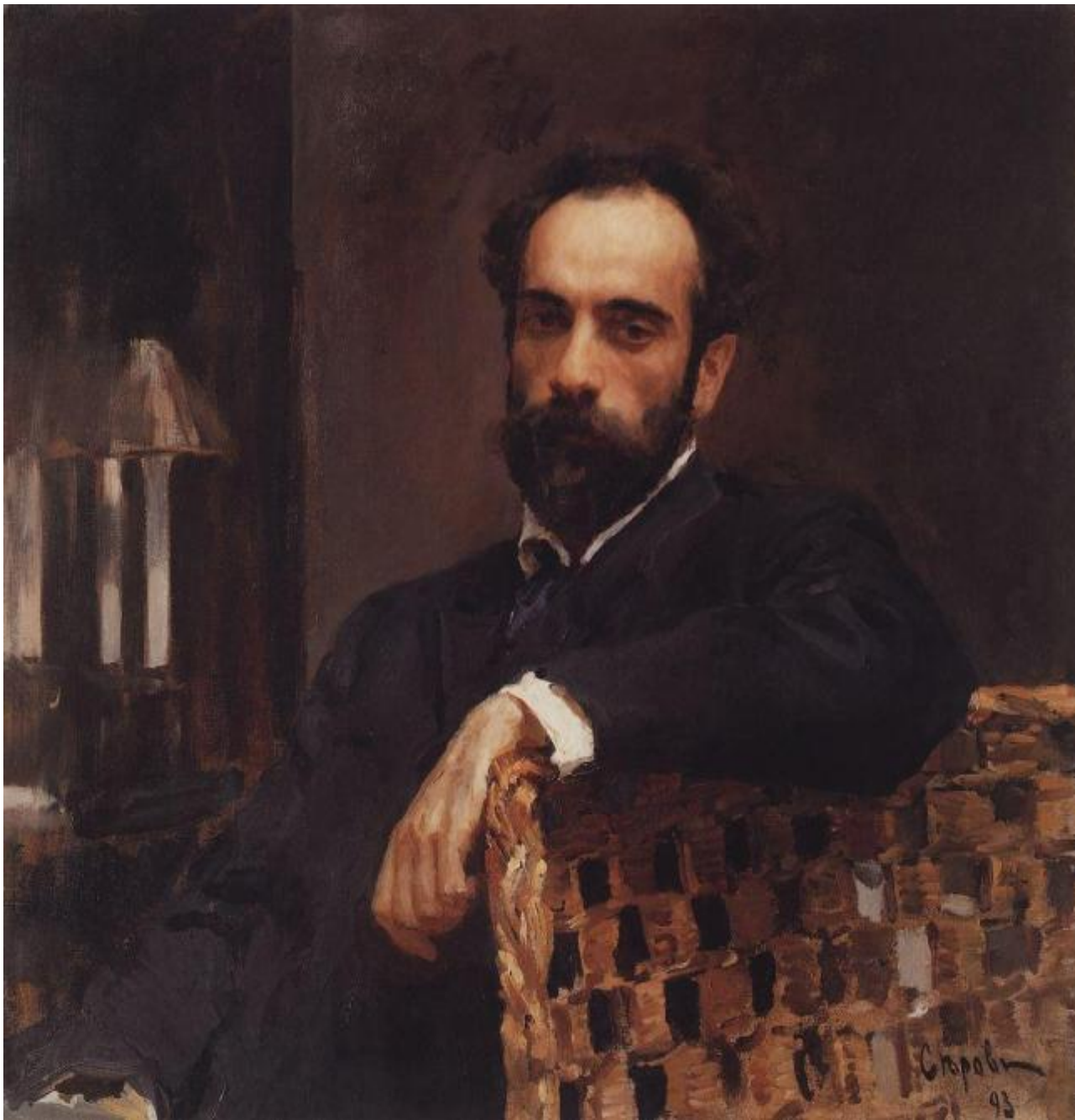
В.Серов «Портрет И. Левитана»