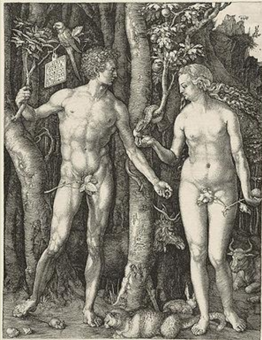
гравюра на меди