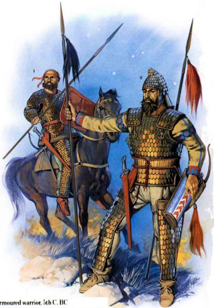
1: Armoured warrior, 5th C. BC