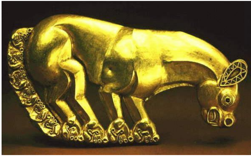
Нащитная бляха в виде пантеры (VII в. до н.э.)

Золото, инкрустация. Длина 32,6 см. Келермесский курган I.