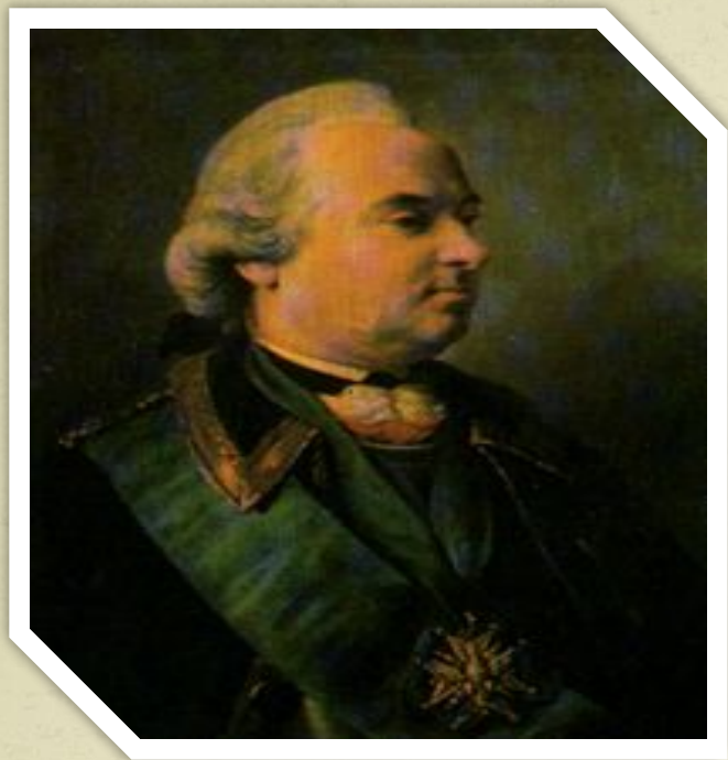
Картина Ф. Рокотова