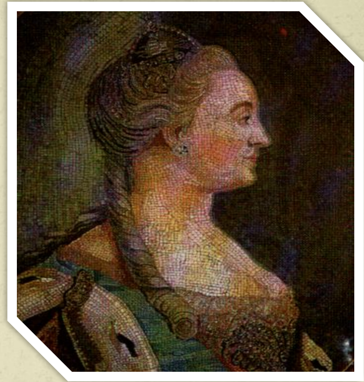
Мозаика мастерской М.В. Ломоносова