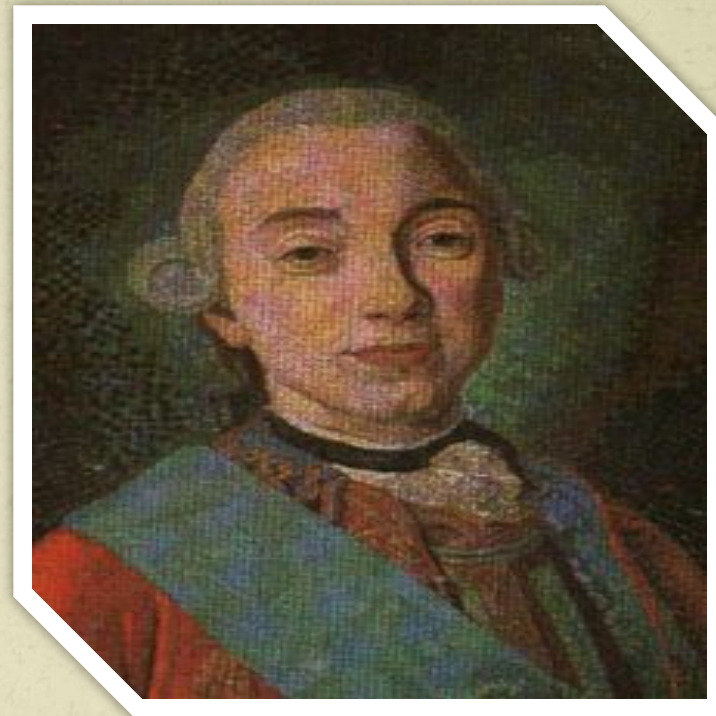
Мозаика мастерской М.В. Ломоносова