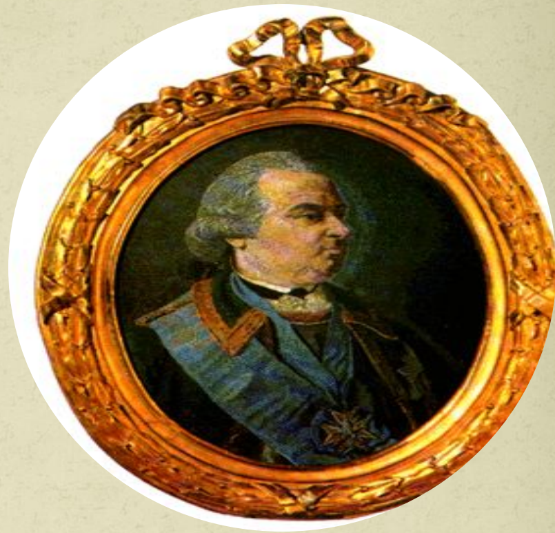
Мозаика мастерской М.В. Ломоносова