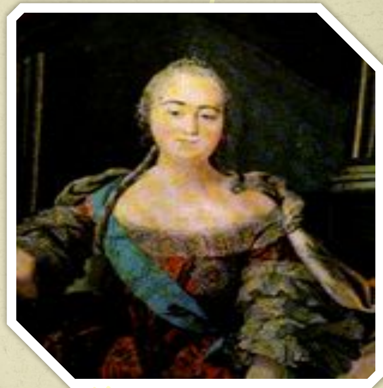
Мозаика мастерской М.В. Ломоносова