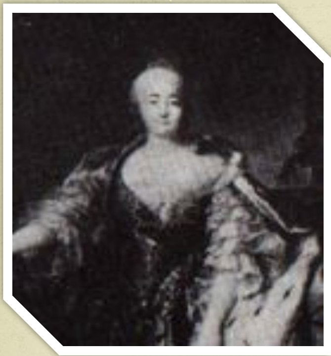
Картина Л. Токке