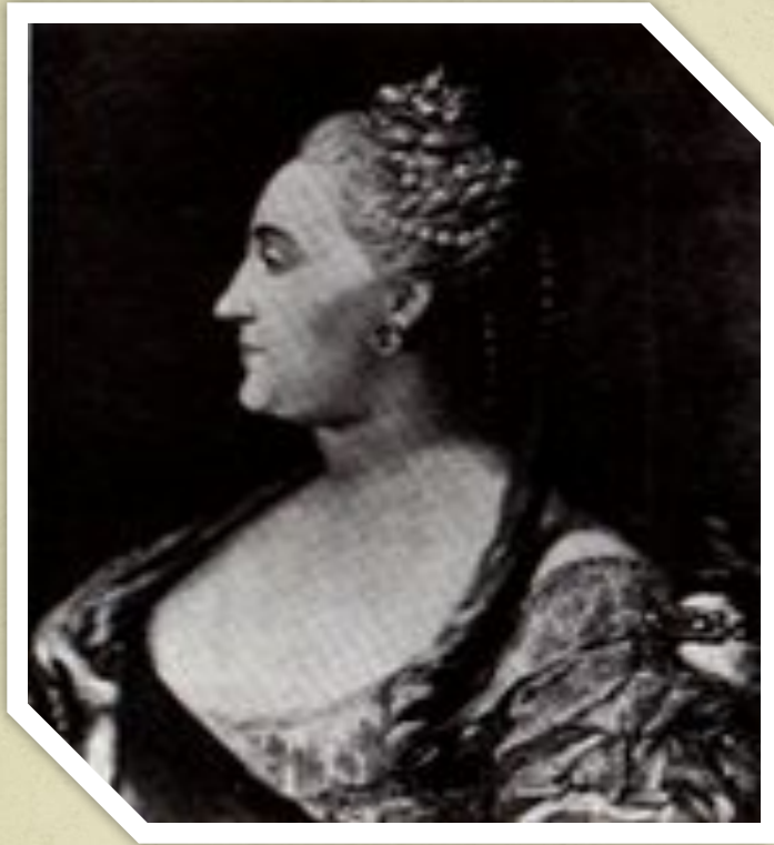
Картина Ф. Рокотова