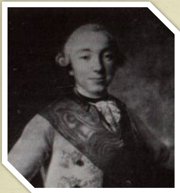
Картина Ф. Рокотова