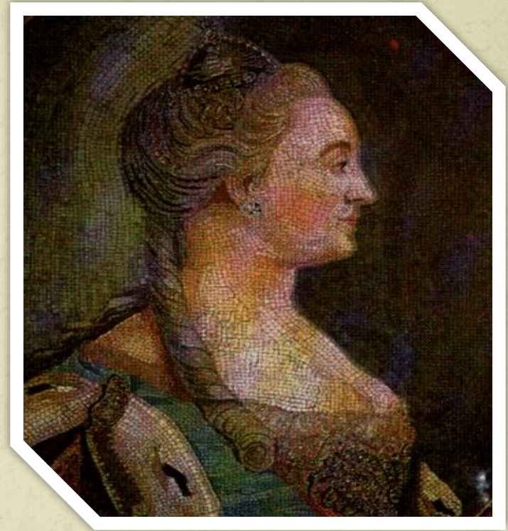
Мозаика мастерской М.В. Ломоносова