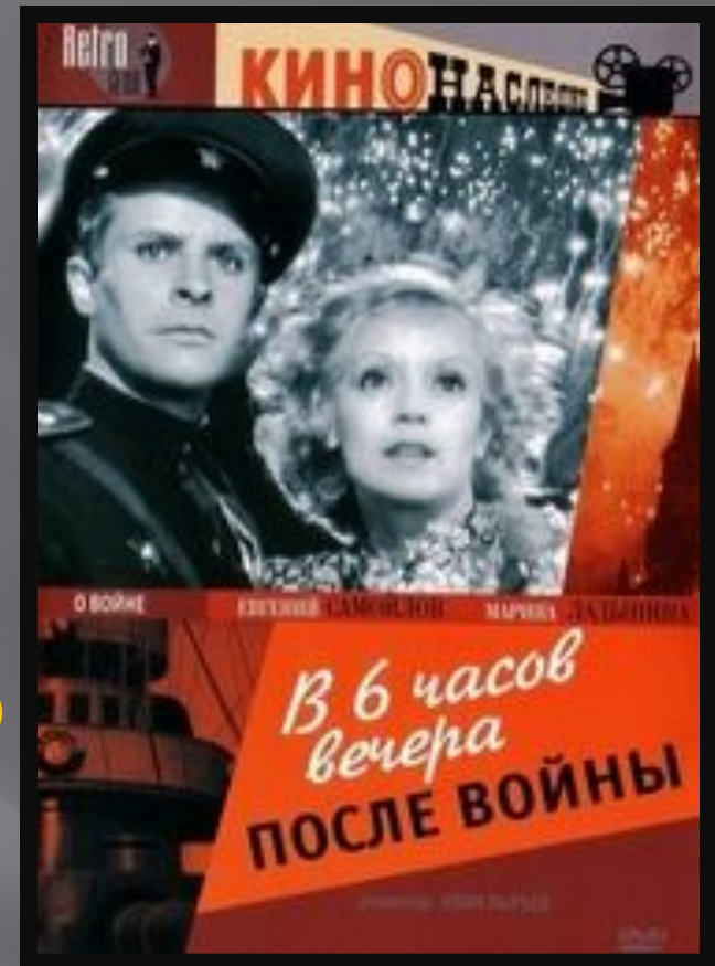
«В шесть часов вечера после войны» И. Пырьев