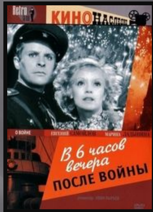
«В шесть часов вечера после войны» И. Пырьев