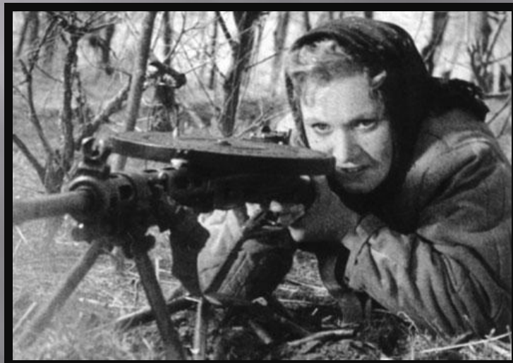
Она защищает Родину (1943) Ф. Эрмлер