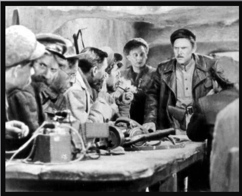
«Секретарь райкома», И. Пырьев(1942)