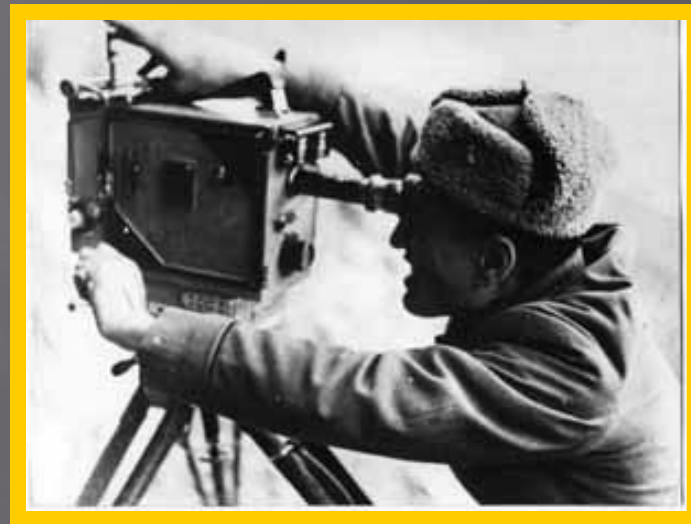
У камеры легендарный фронтовой кинооператор Малик Каюмов

Всего за четыре года войны кинохроника выпустила 400 «Союзкиножурнала», 65 номеров журнала «Новости дня», 24 «фронтовых киновыпуска», 67 тематических короткометражных фильмов и 34 полнометражных документальных кинокартины. Общий метраж негативов военных съемок составил 3,5 миллиона метров.