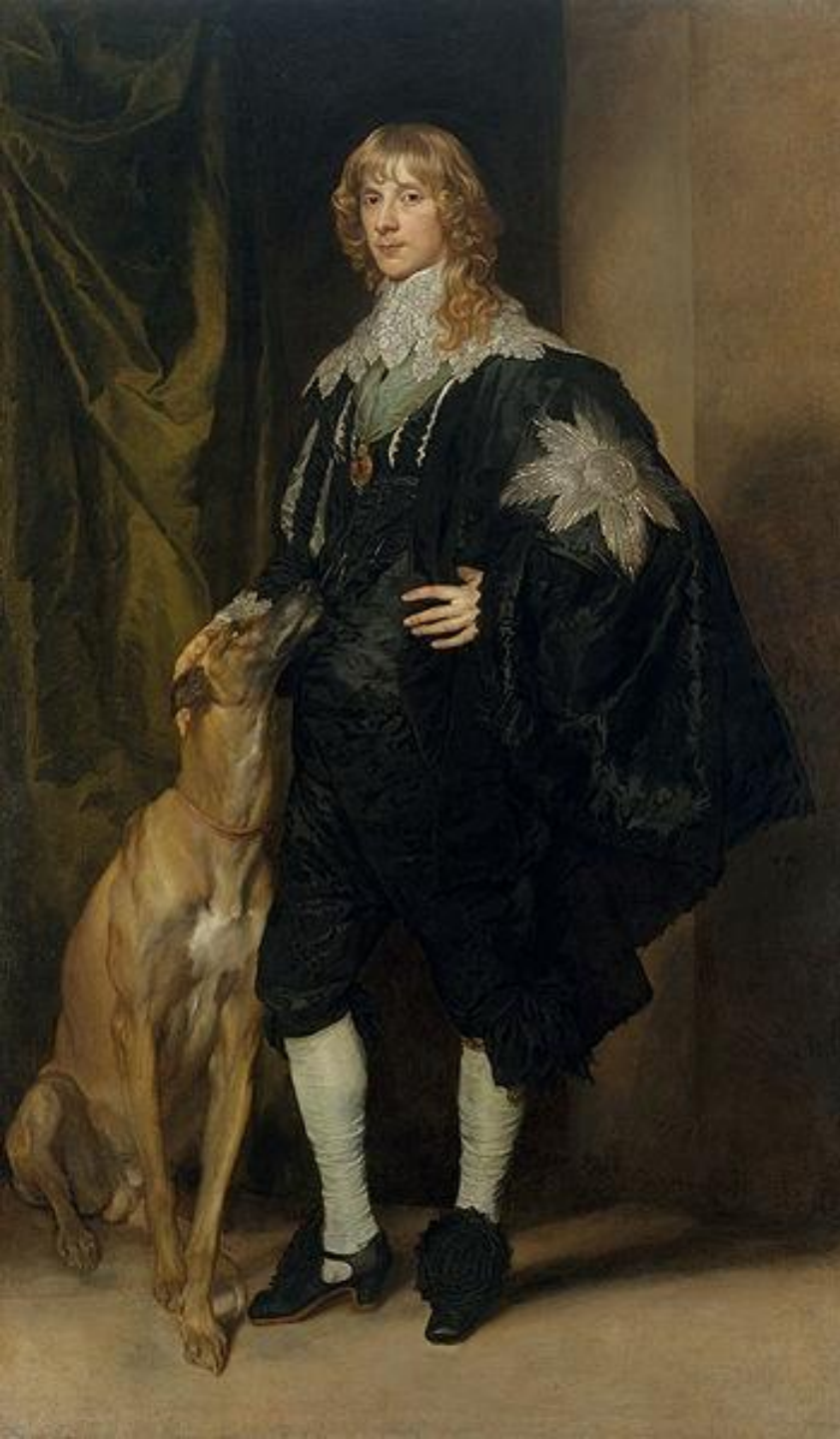
Антонис ван Дейк. Портрет Джеймса Стюарта, ок. 1637