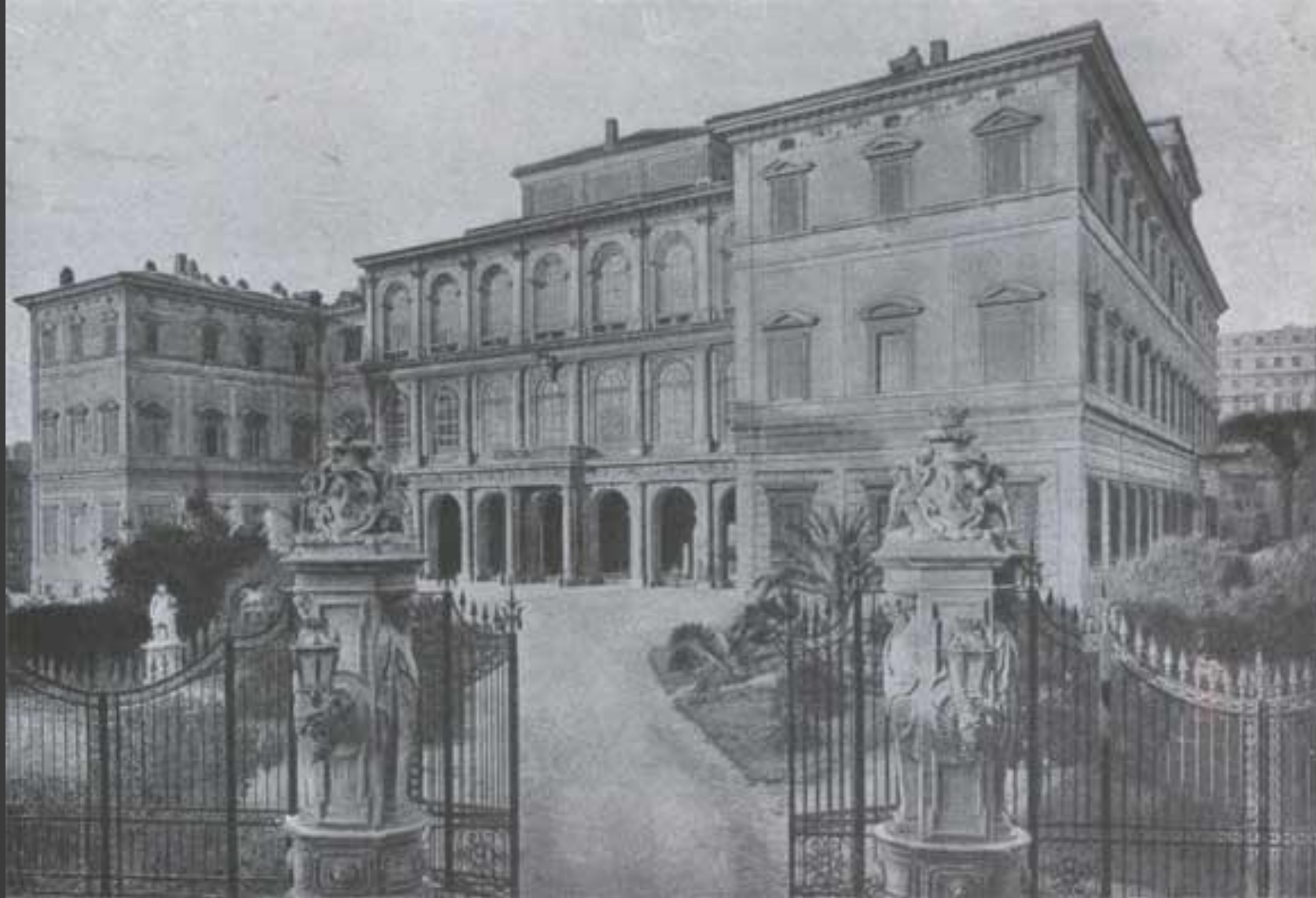
Л. Бернини. Палаццо Барберини в Риме. 1624—1663.