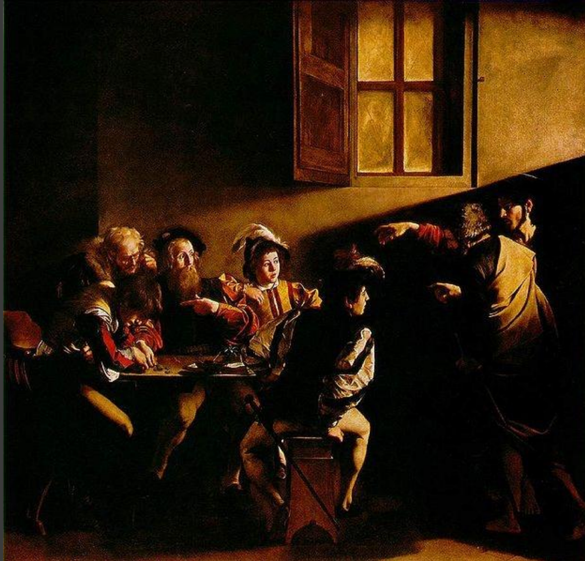
Караваджо. Призвание апостола Матфея.