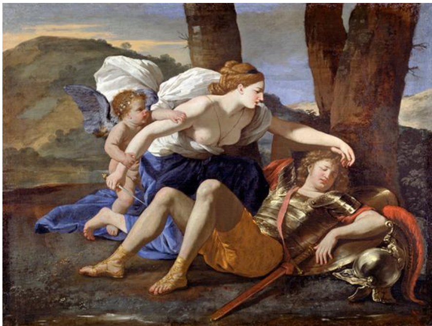
Никола Пуссен, «Ринальдо и Армида»