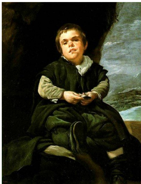
Портрет придворного карлика