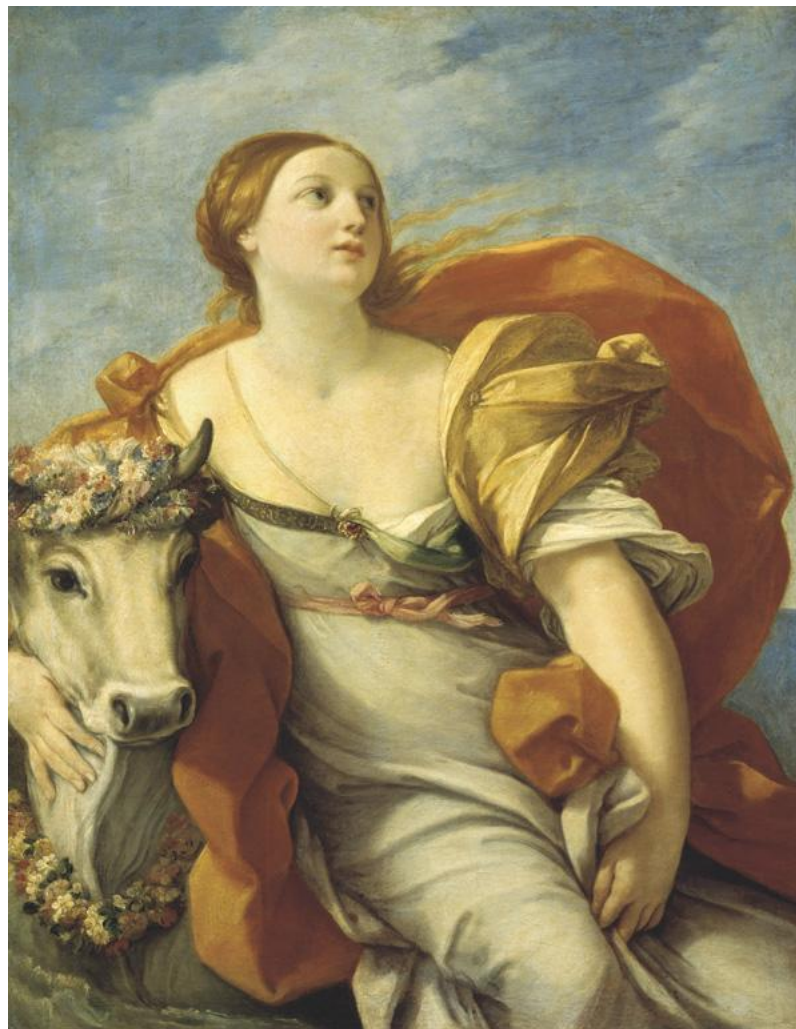
Гвидо Рени, «Похищение Европы»