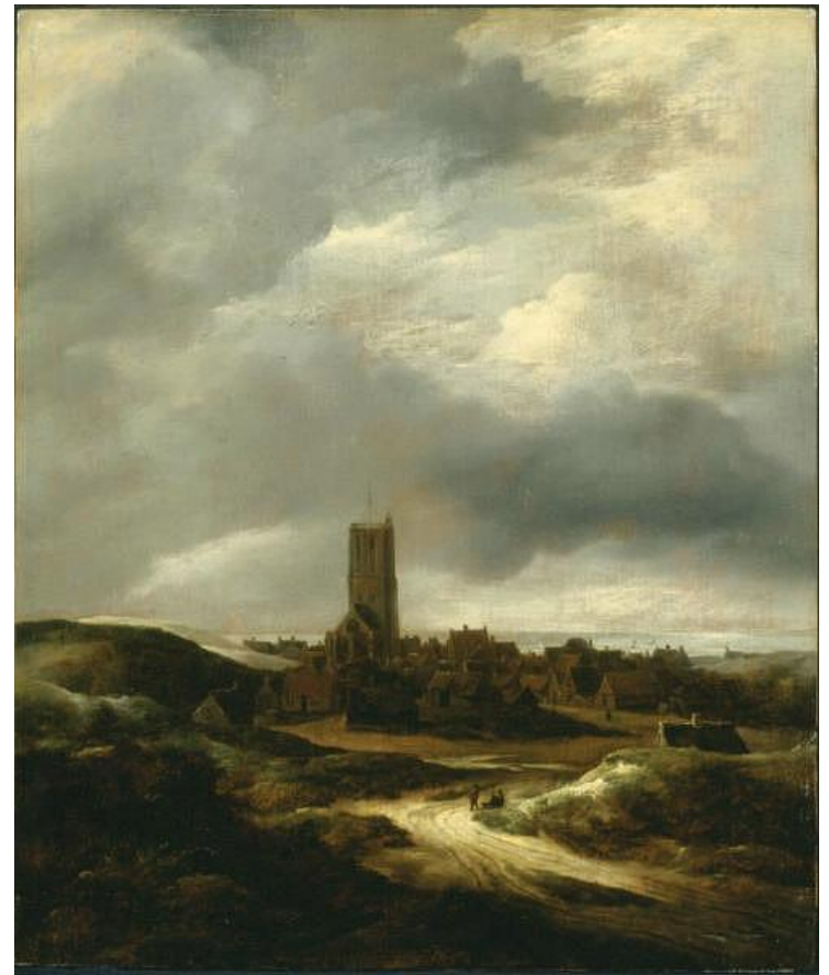
Якоб ван Рейсдал, «Вид деревни Эгмонт»

Вывод: стиль барокко построен на контрастах и асимметрии, тяготеет к грандиозности и пышной декоративности.