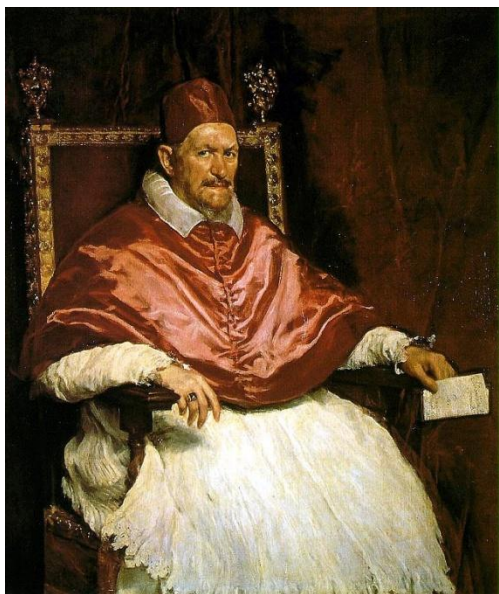
Папа Иннокентий X