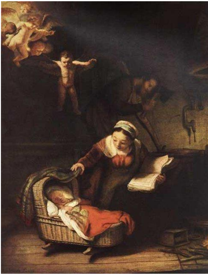
Рембрандт, «Святое семейство»