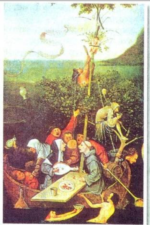
▲ И. Босх. Корабль дураков. XV в.