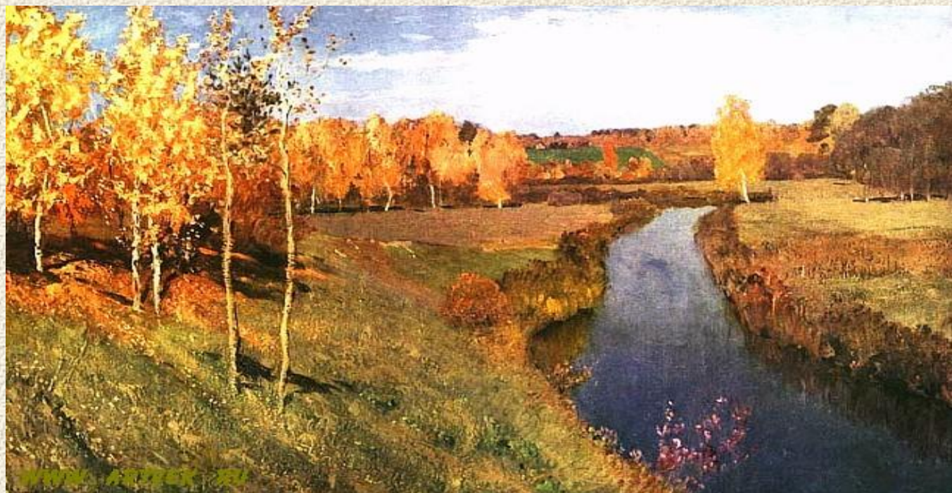
И.И. Левитан «Золотая осень»