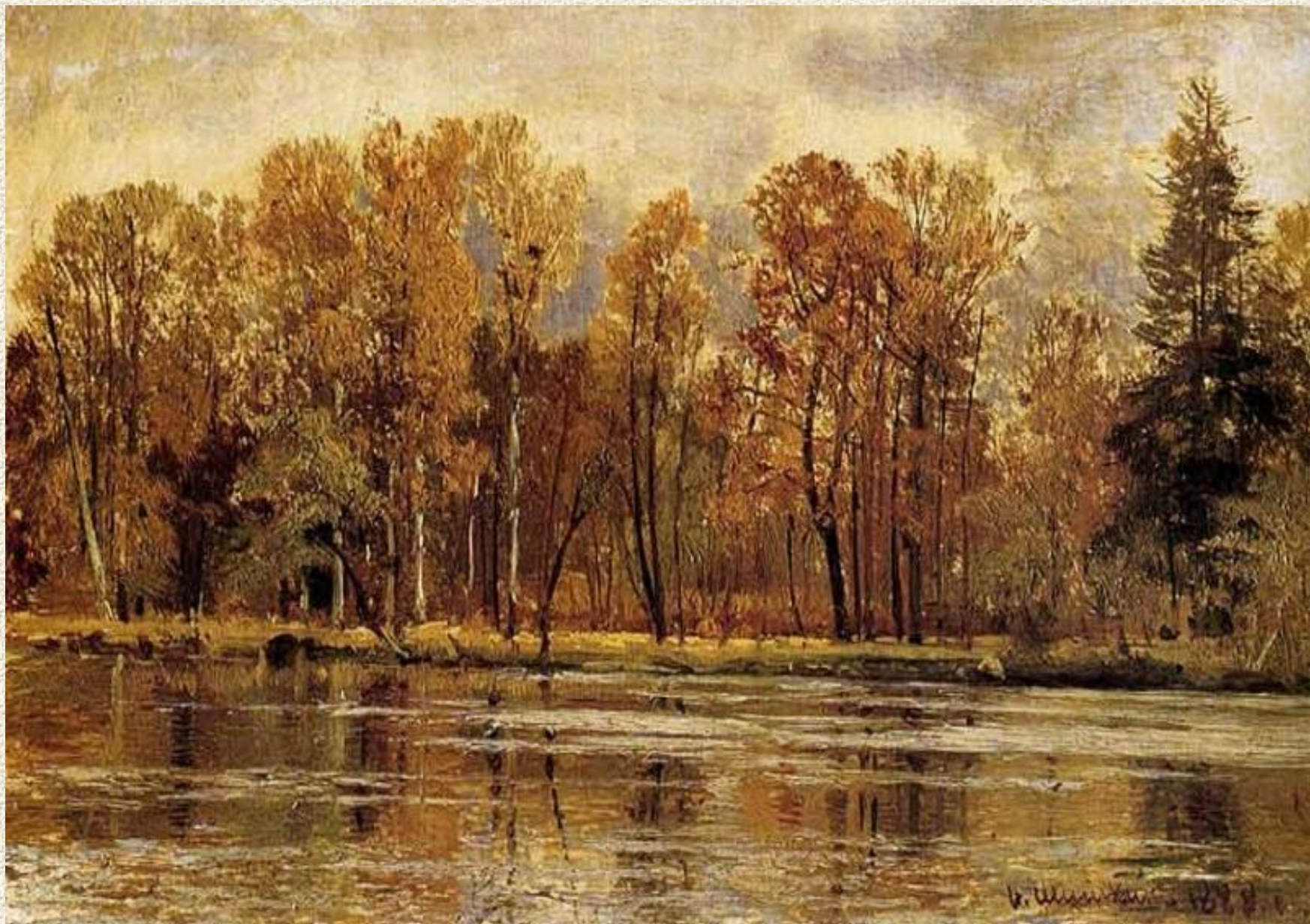
«ЗОЛОТАЯ ОСЕНЬ» И. ШИШКИН