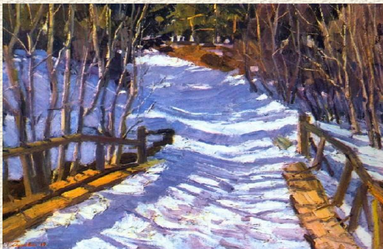
В. ГАВРИЛОВ «Голубые тени»