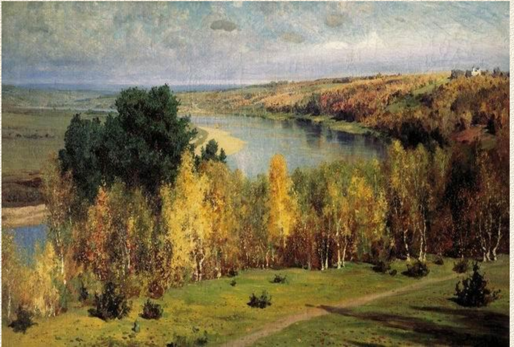
«ЗОЛОТАЯ ОСЕНЬ» В. ПОЛЕНОВ