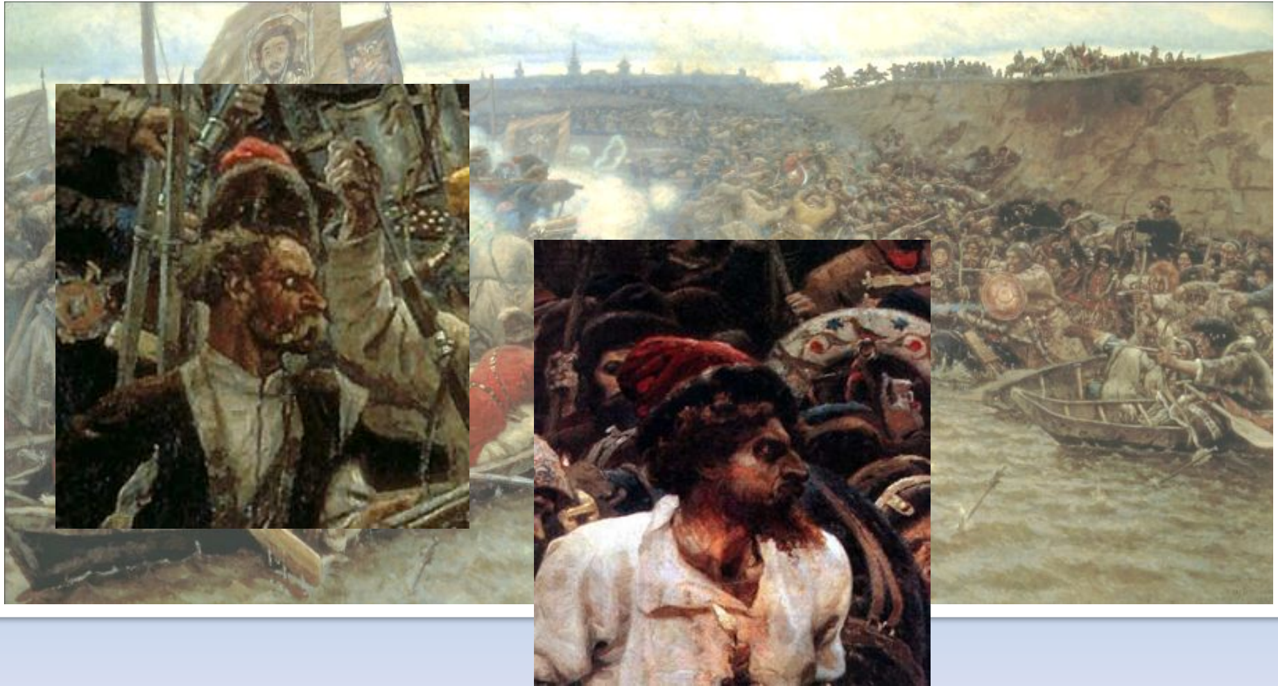
«Покорение Сибири Ермаком». 1895 г.