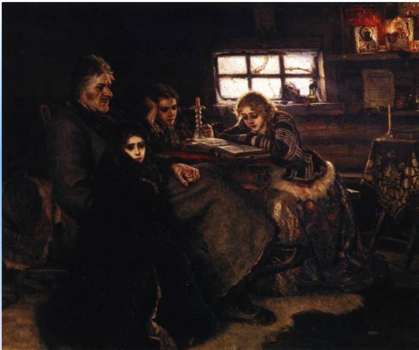
«Меншиков в Берёзове». 1883 г.