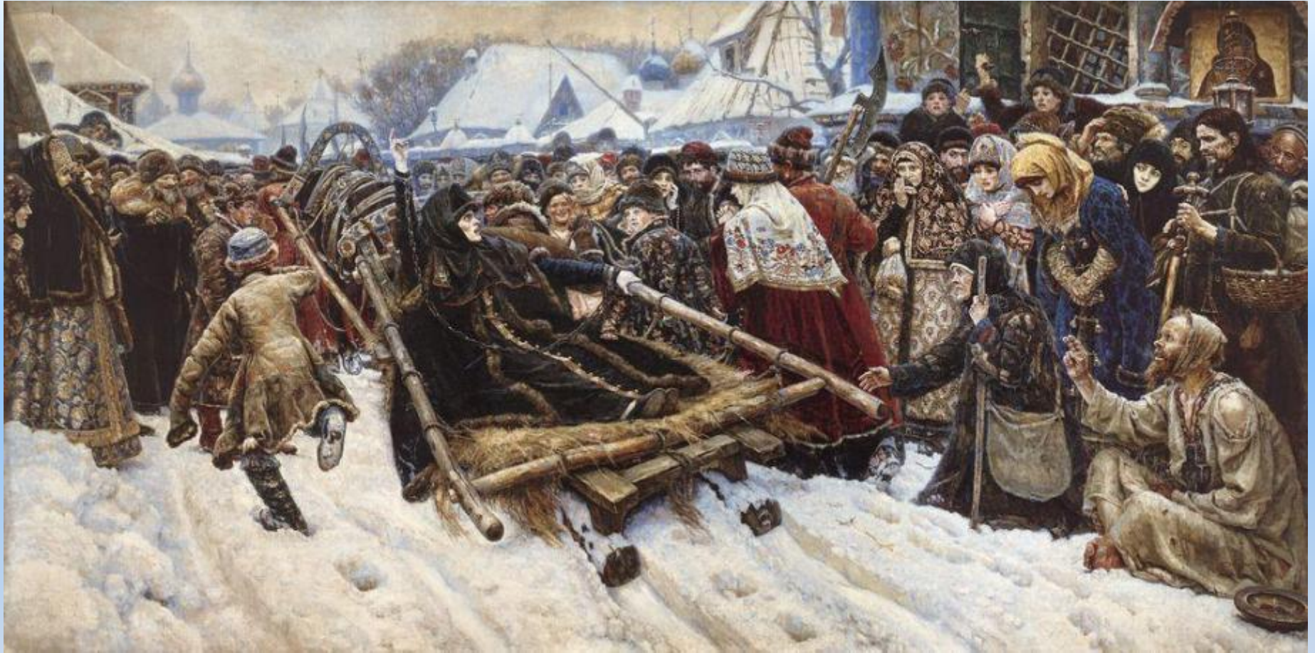
«Боярыня Морозова». 1887 г.