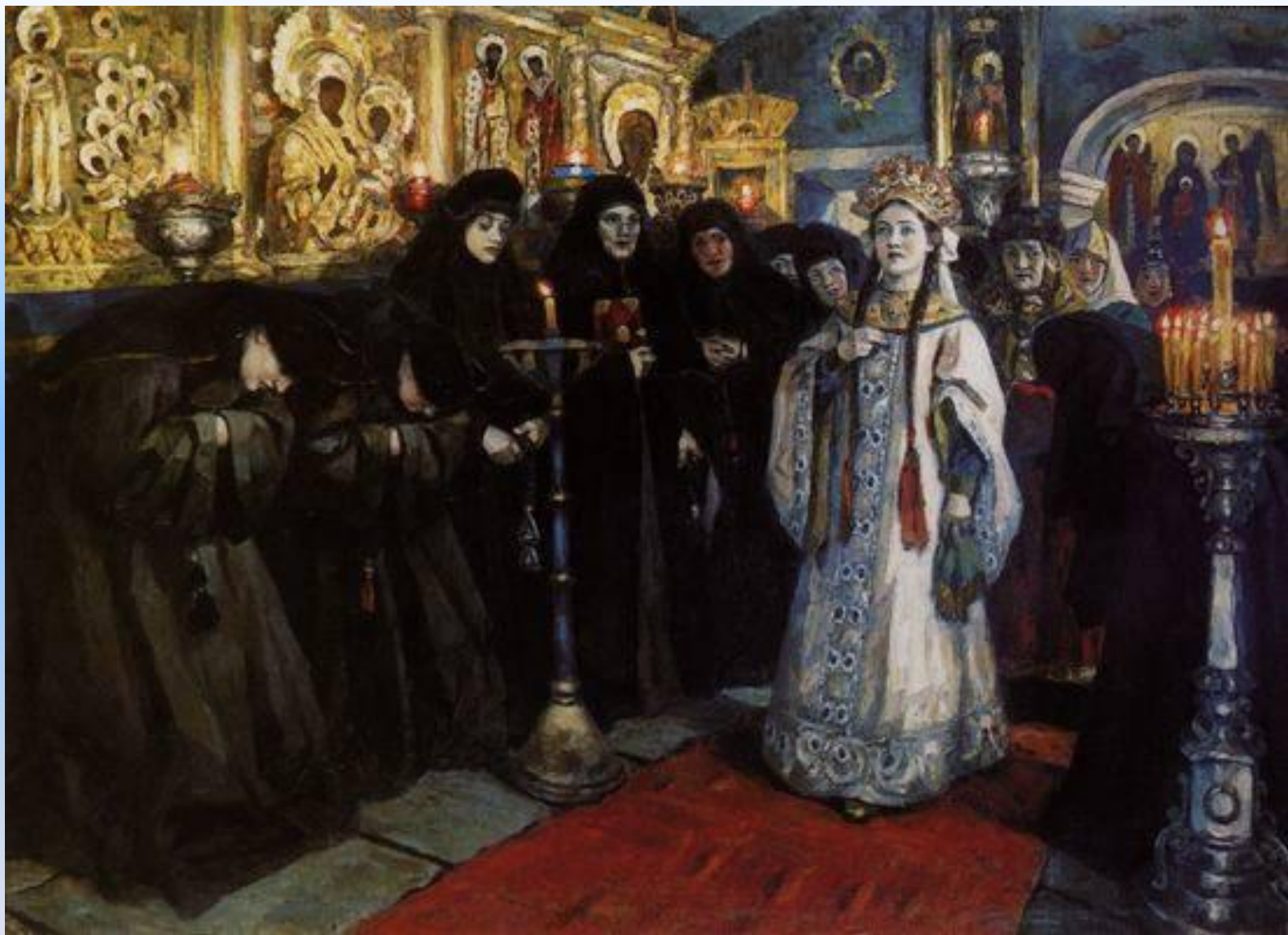
«Посещение царевной женского монастыря». 1912 г.