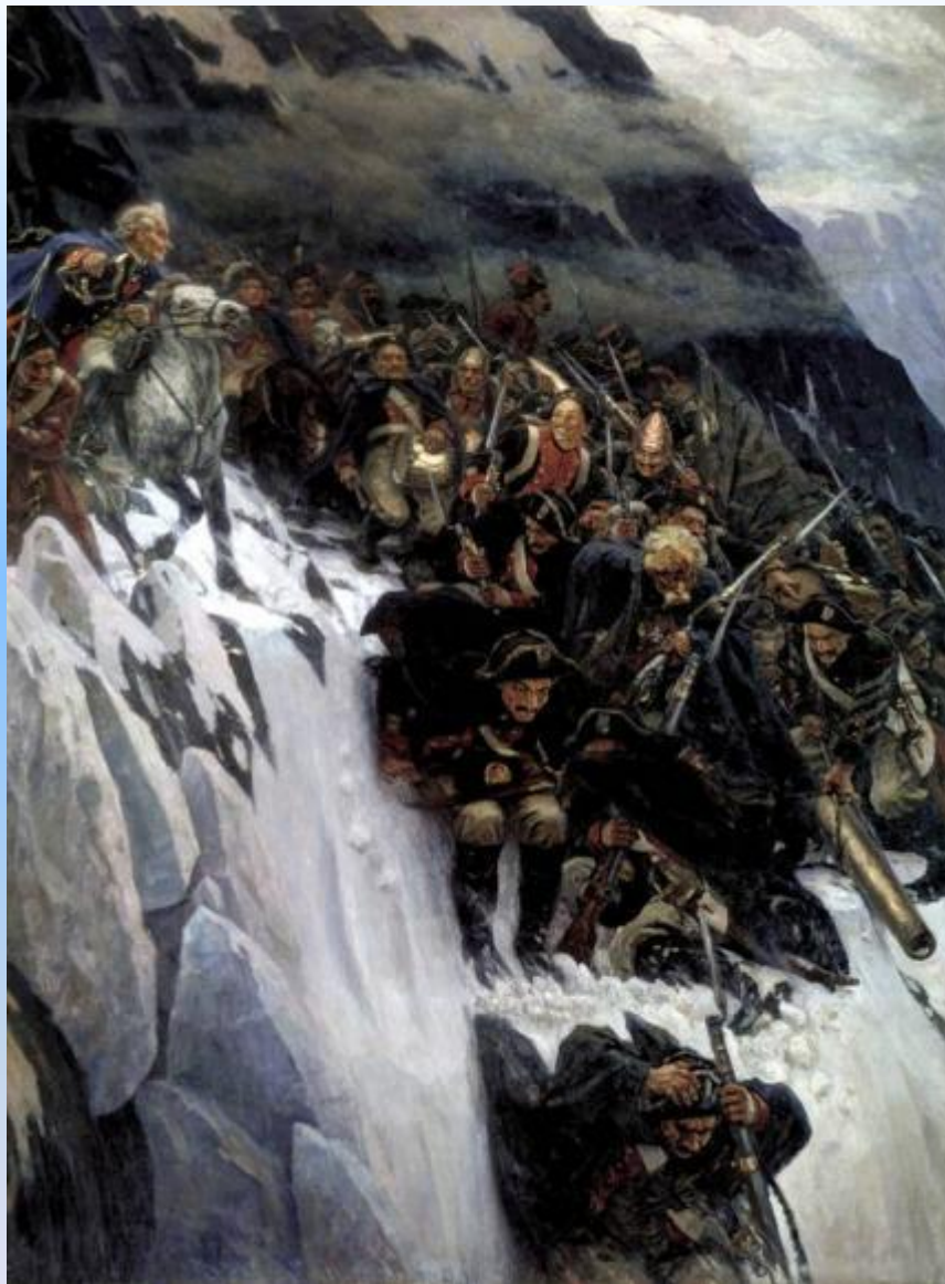
«Переход Суворова через Альпы». 1899 г.