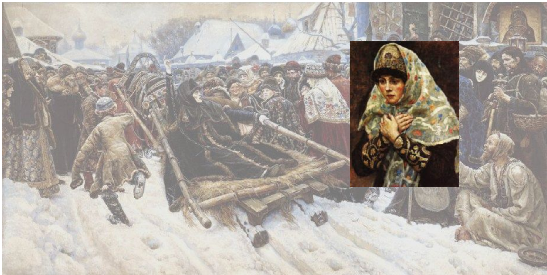
«Боярыня Морозова». 1887 г.