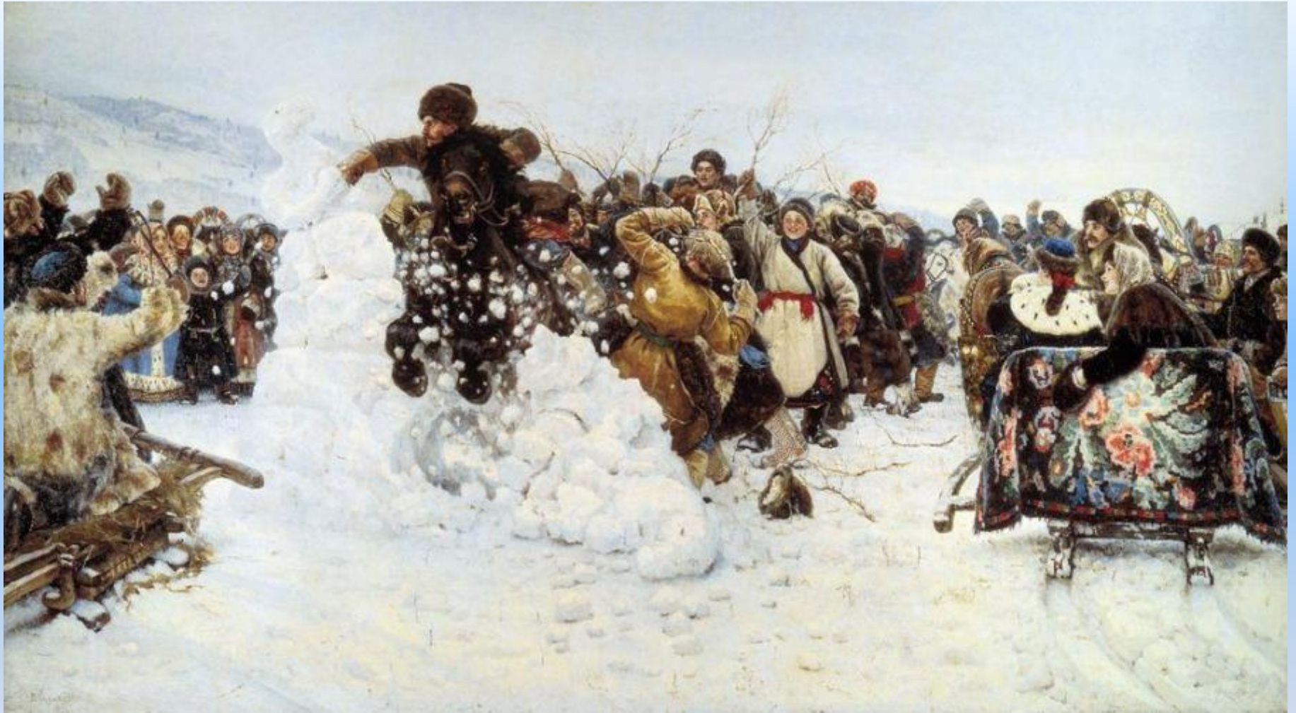
«Взятие снежного городка». 1891 г.