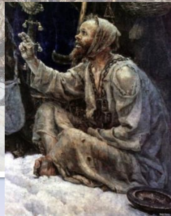
«Боярыня Морозова». 1887 г.