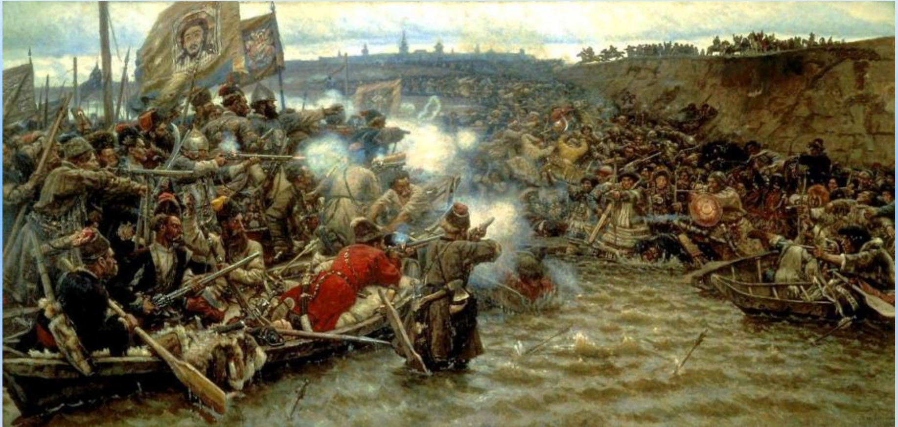
«Покорение Сибири Ермаком». 1895 г.