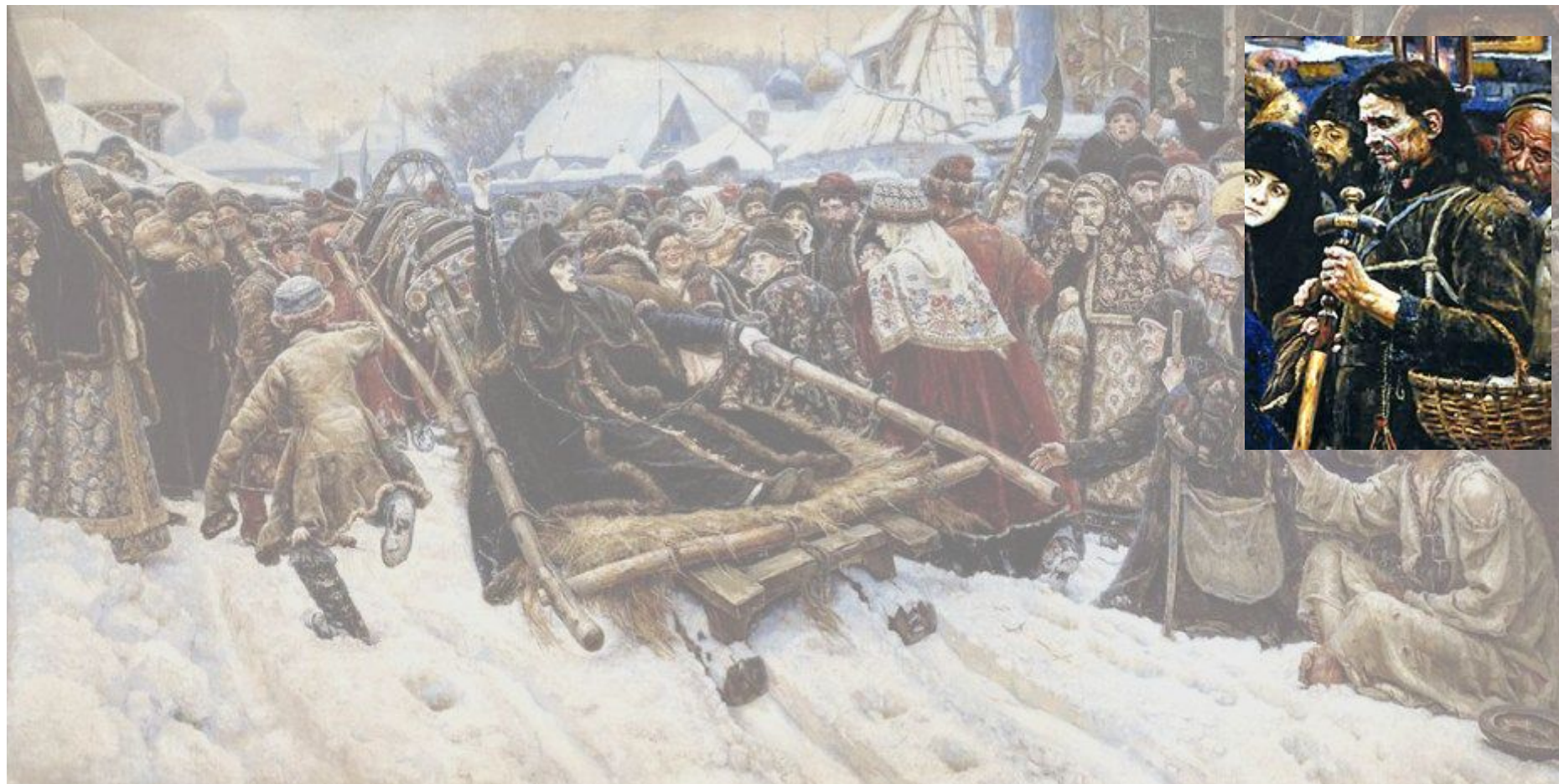
«Боярыня Морозова». 1887 г.