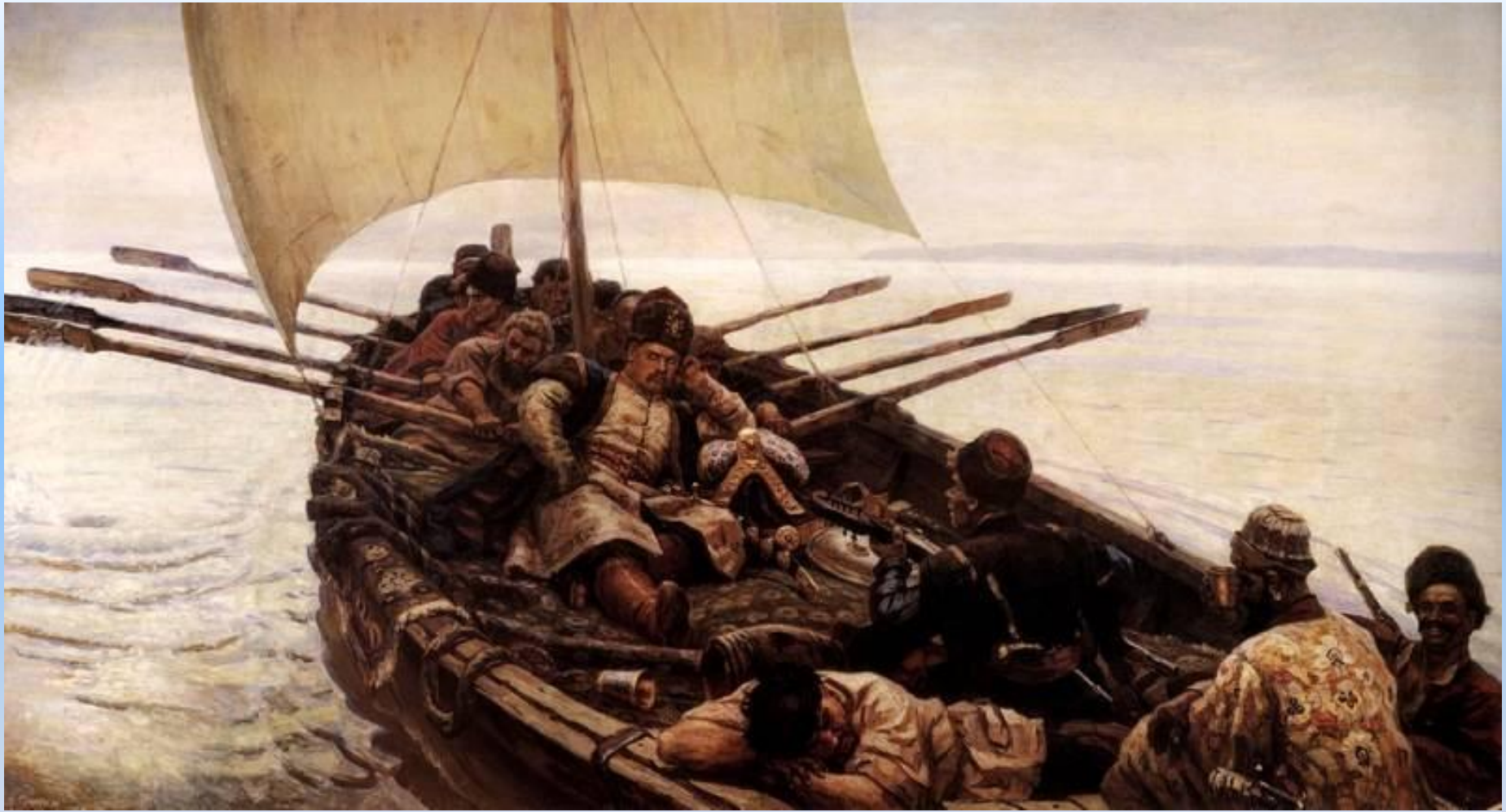
«Степан Разин». 1907 г.