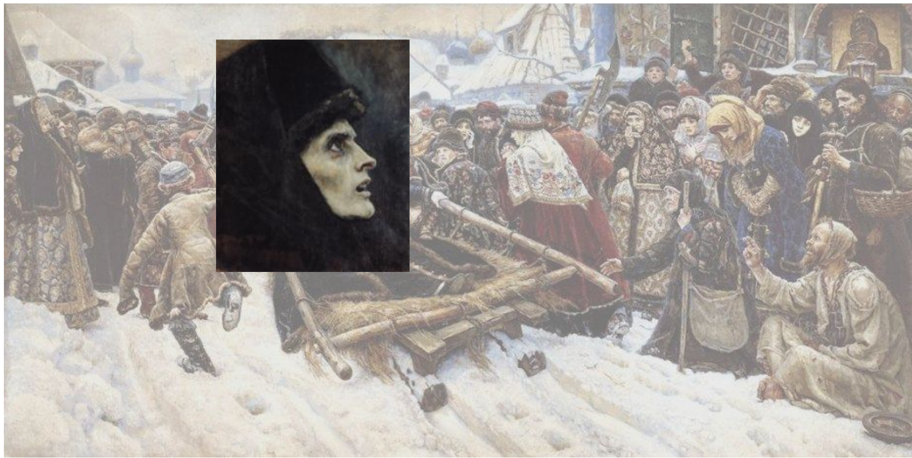
«Боярыня Морозова». 1887 г.