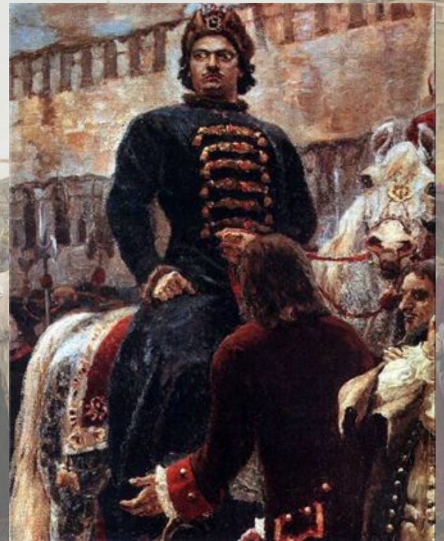
«Утро стрелецкой казни». 1881 г.