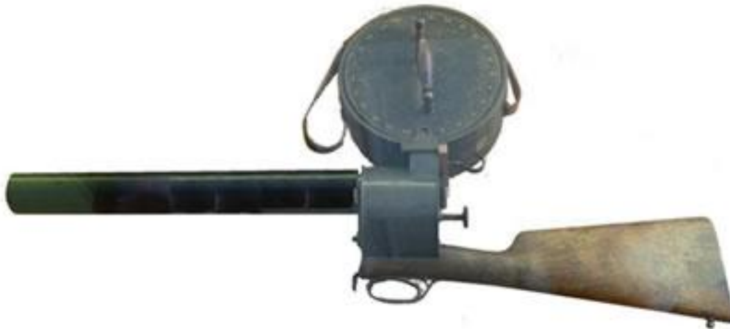
E.J. Marey's photographic gun