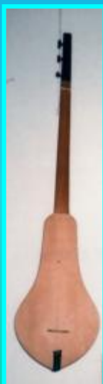
Комуз (киргиз. инстр)