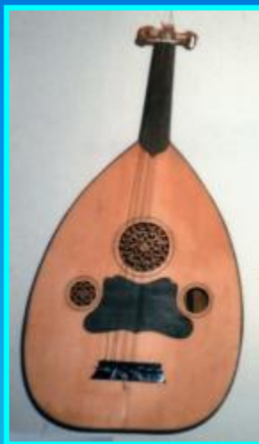
Уд – тур (арабский инстр.)