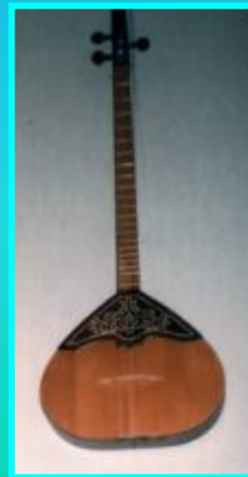
Кылысах (якут. инстр)