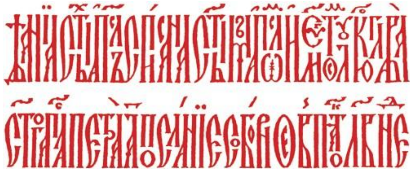
Рис 3. Русская вязь