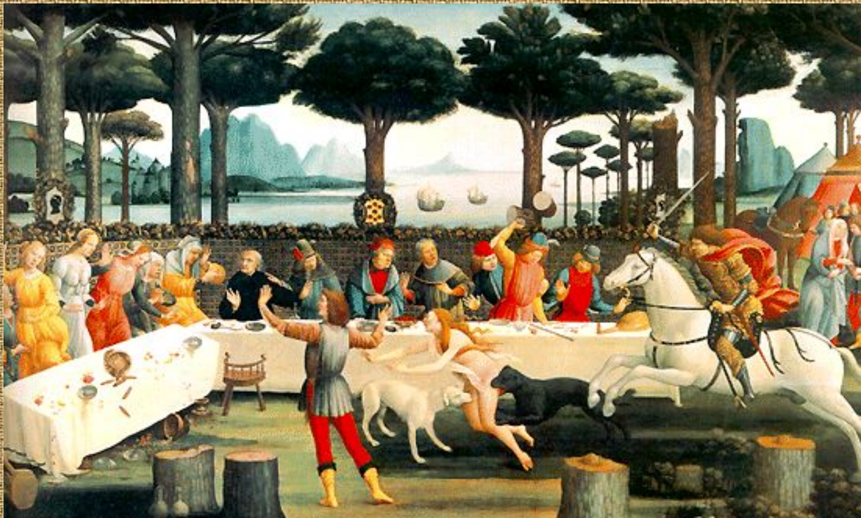
История Настаджо дельи Онести