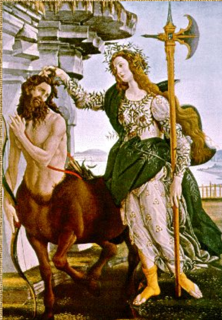
Афина Паллада и кентавр