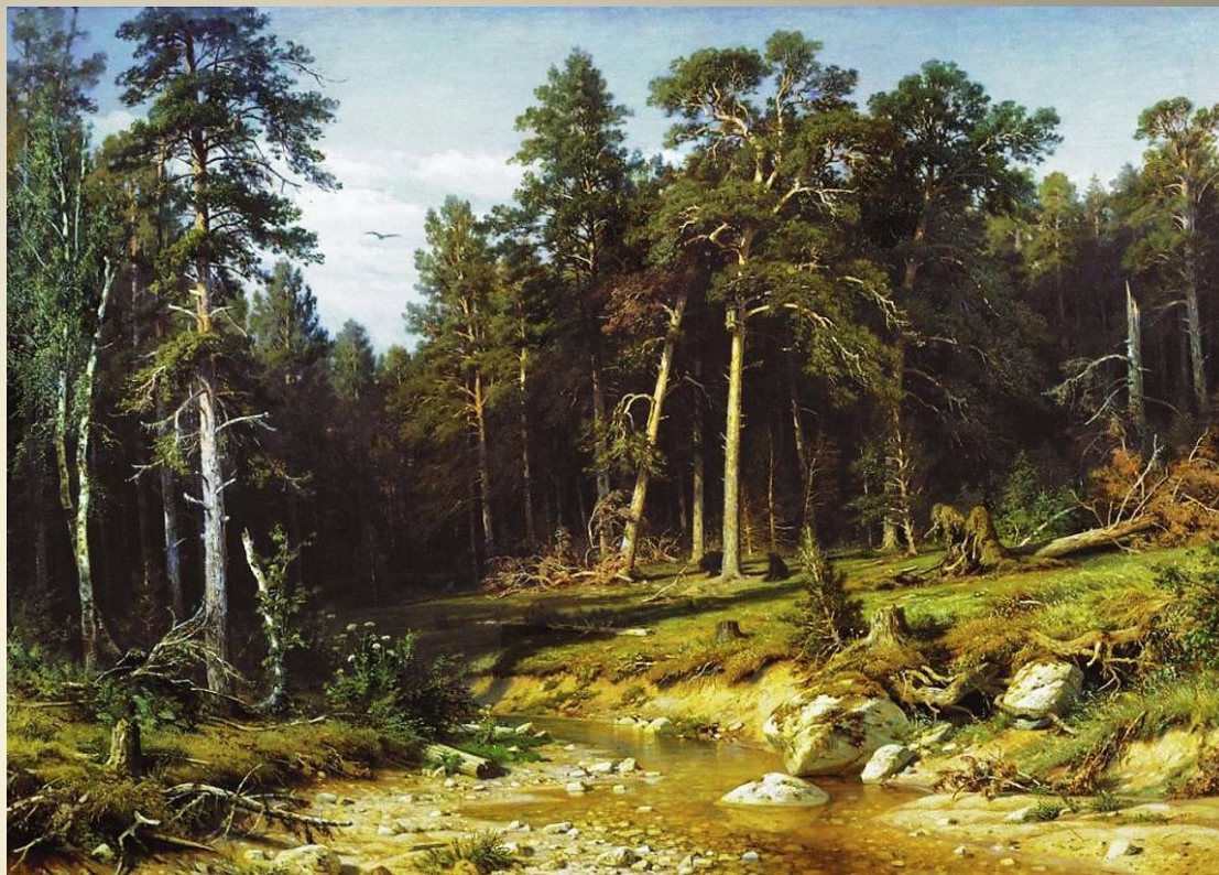
«Сосновый бор. Мачтовый лес в Вятской губернии»

Известная картина «Сосновый бор. Мачтовый лес в Вятской губернии» была написана И. И. Шишкиным в 1872 году, в период наступления творческой зрелости. За нее художник получил свою первую премию от Общества передвижных художников. Полотно все как будто пронизано ярким солнечным светом. Стройные сосны-великаны нежатся в его теплых лучах. Кажется, будто чувствуешь запах земли и смолы. Лесной ручей неторопливо струится по чистому дну, усеянному камнями. Пейзаж безмятежен и светел по настроению.