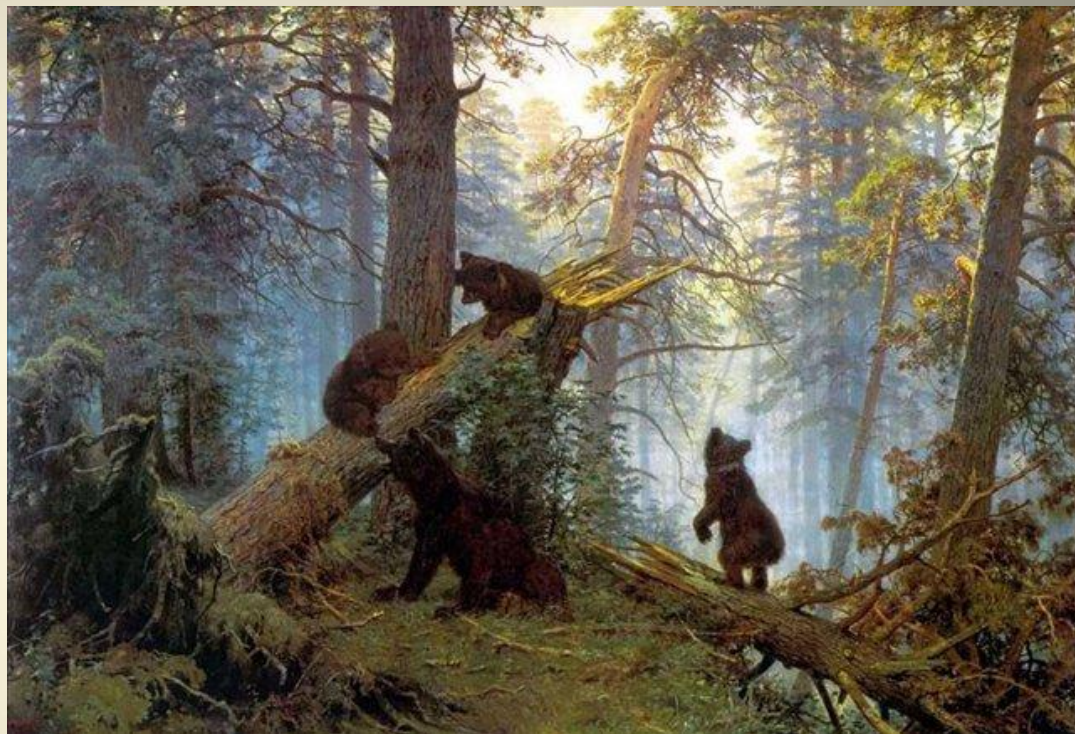
"Утро в сосновом бору"

Пожалуй, самая известная картина выдающегося русского пейзажиста И. И. Шишкина – «Утро в сосновом лесу». Картина была написана в 1889 году. Возможно, именно занимательный сюжет картины способствовал ее популярности, однако настоящая ценность полотна определяется точно переданным состоянием природы. Перед нами – не просто сосновый лес, а глухая чаща, которая начинает пробуждаться ранним утром. Солнце только-только всходит. Его смелые лучи уже позолотили верхушки огромных деревьев и проникли вглубь чащи, но над глубоким оврагом еще не рассеялся влажный туман.