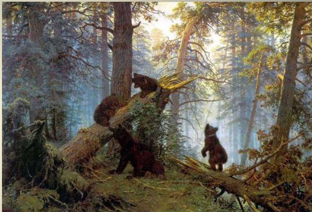
"Утро в сосновом бору"

Пожалуй, самая известная картина выдающегося русского пейзажиста И. И. Шишкина – «Утро в сосновом лесу». Картина была написана в 1889 году. Возможно, именно занимательный сюжет картины способствовал ее популярности, однако настоящая ценность полотна определяется точно переданным состоянием природы. Перед нами – не просто сосновый лес, а глухая чаща, которая начинает пробуждаться ранним утром. Солнце только-только всходит. Его смелые лучи уже позолотили верхушки огромных деревьев и проникли вглубь чащи, но над глубоким оврагом еще не рассеялся влажный туман.