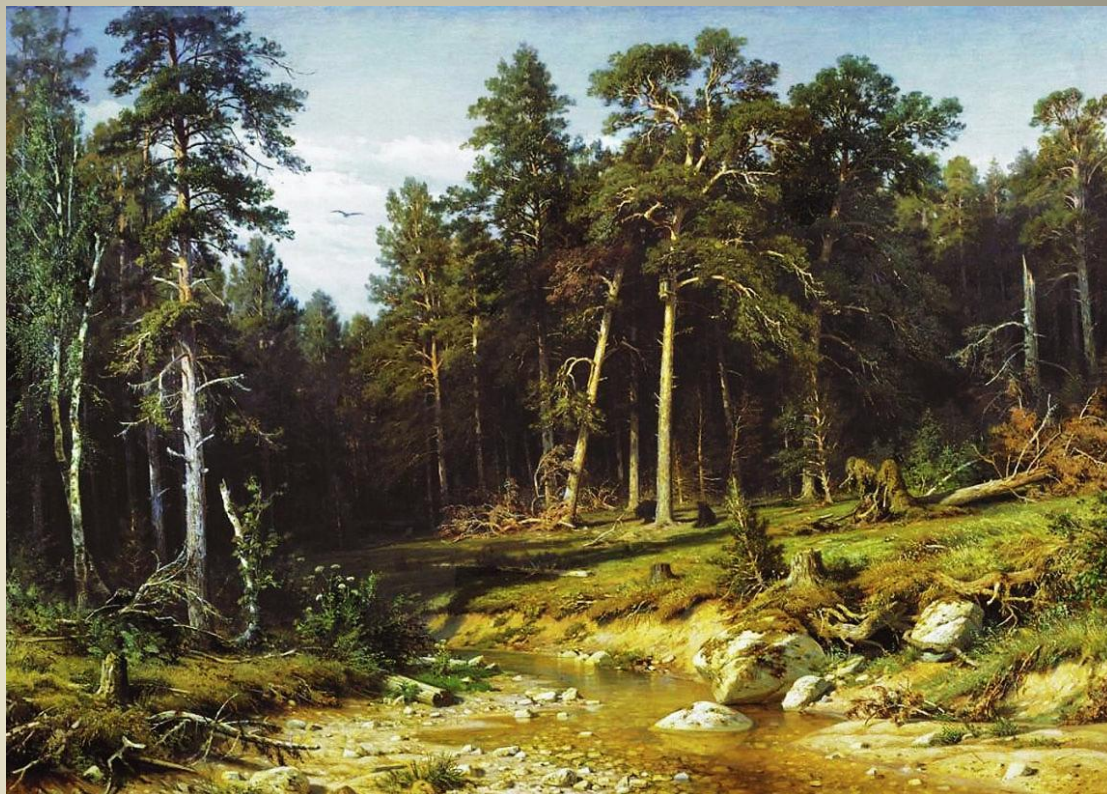
«Сосновый бор. Мачтовый лес в Вятской губернии»

Известная картина «Сосновый бор. Мачтовый лес в Вятской губернии» была написана И. И. Шишкиным в 1872 году, в период наступления творческой зрелости. За нее художник получил свою первую премию от Общества передвижных художников. Полотно все как будто пронизано ярким солнечным светом. Стройные сосны-великаны нежатся в его теплых лучах. Кажется, будто чувствуешь запах земли и смолы. Лесной ручей неторопливо струится по чистому дну, усеянному камнями. Пейзаж безмятежен и светел по настроению.