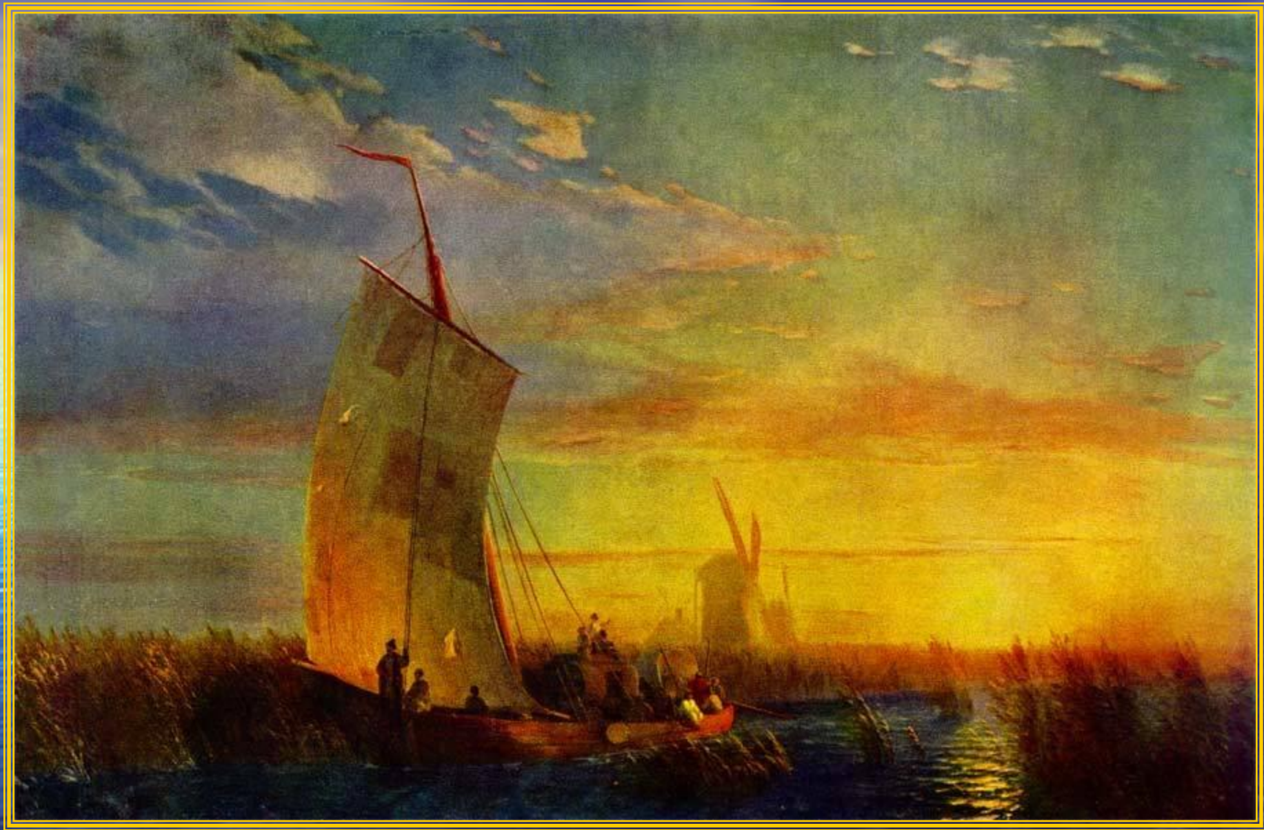
Камыши на Днепре близ местечка Алёшки 1857 год