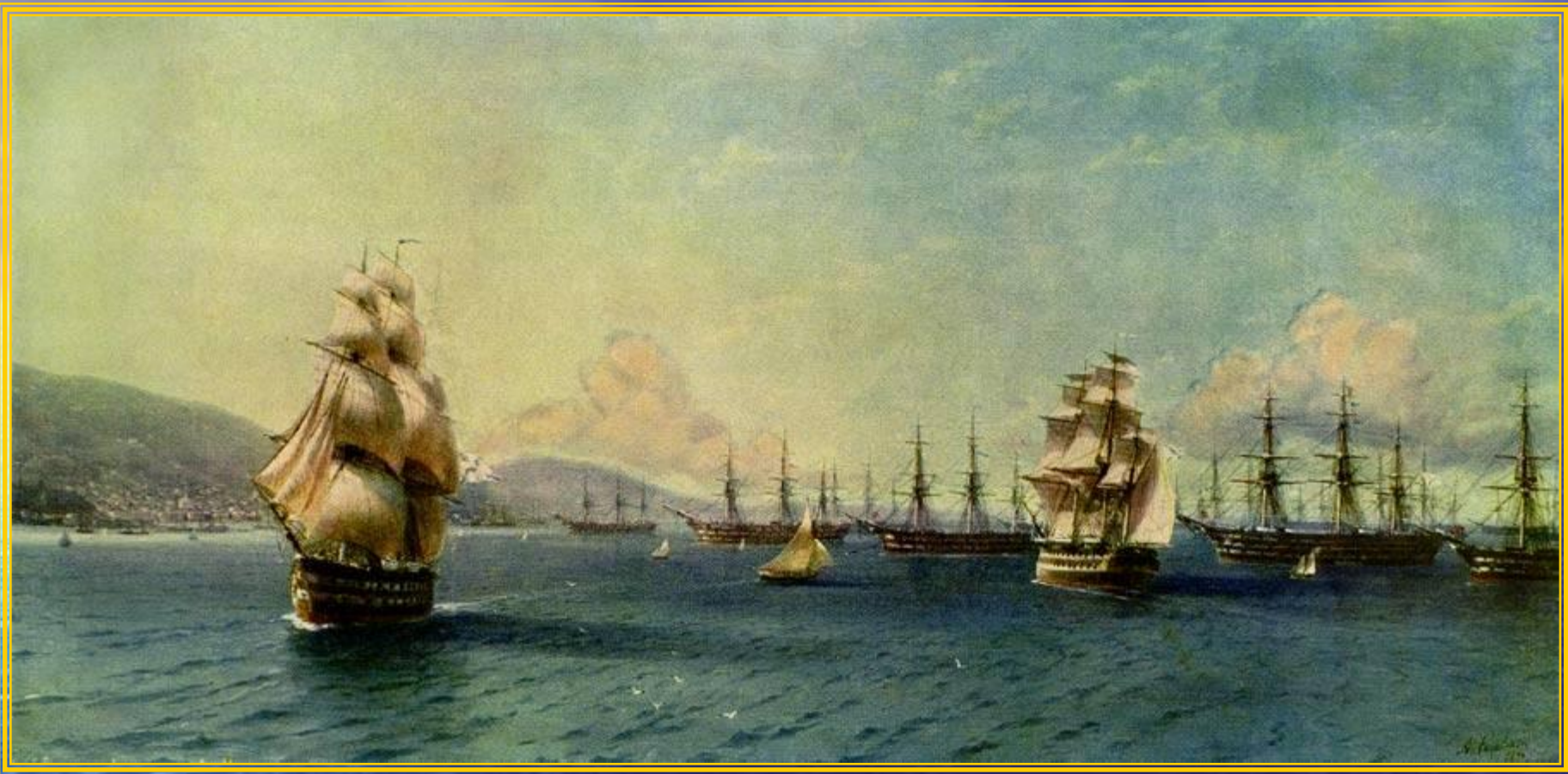
Черноморский флот в Феодосии 1890 год