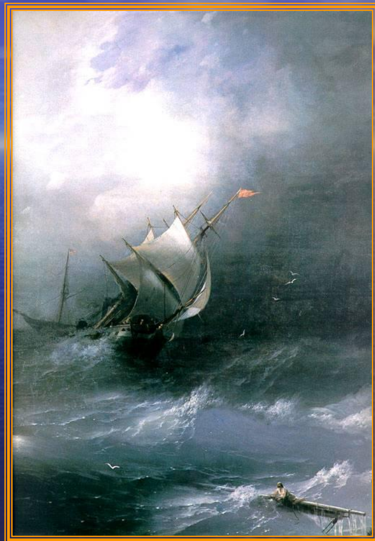
Буря на ледовитом океане 1864 год