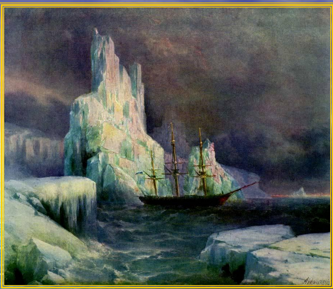
Ледяные горы 1870г.