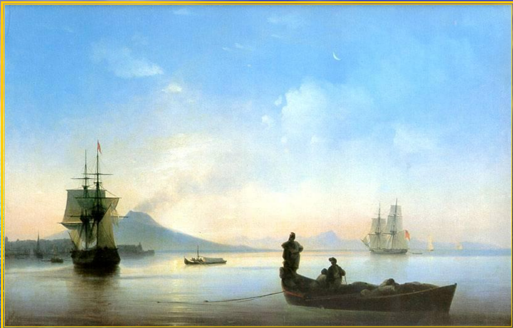
Неаполитанский залив 1841 год