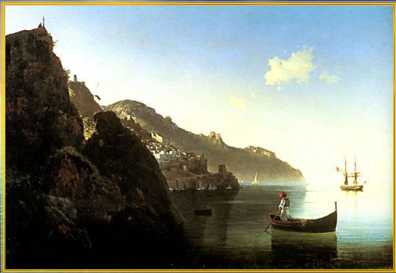
Побережье в Амальфи 1841 год