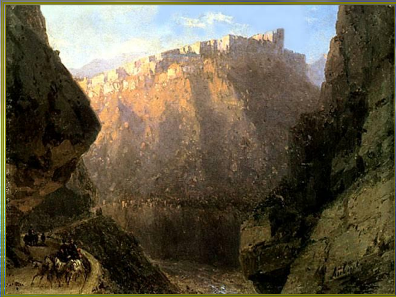
Дарьяльское ущелье 1855 год