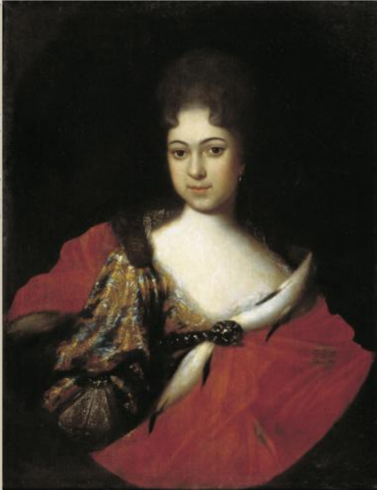
Портрет царевны Прасковьи Иоанновны