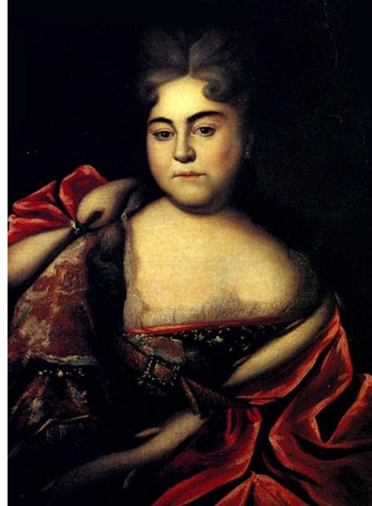
Портрет царевны Наталии Алексеевны