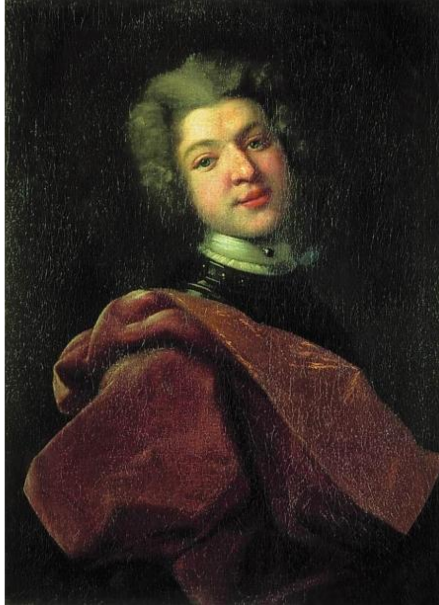
Портрет барона С.Г. Строганова