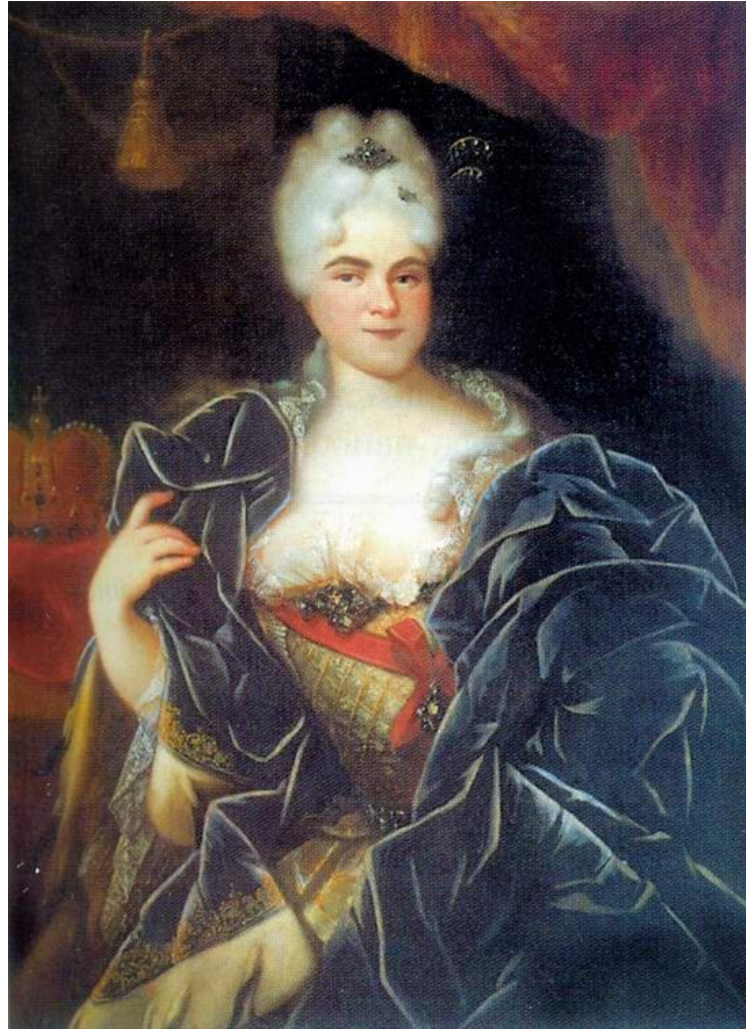
Портрет императрицы Екатерины I