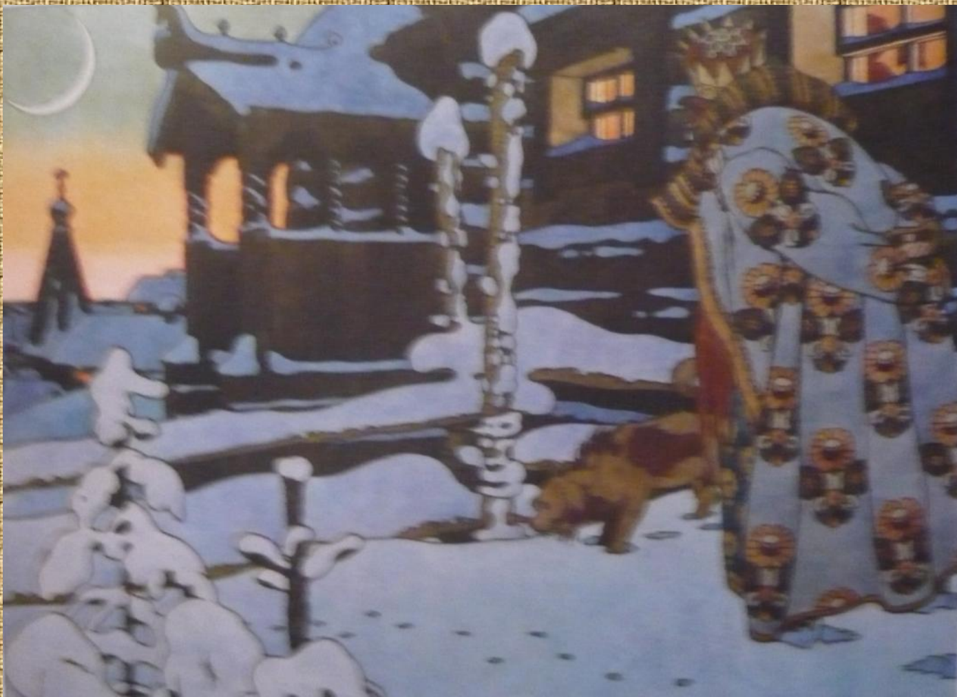
«Сказка о царе Салтане»