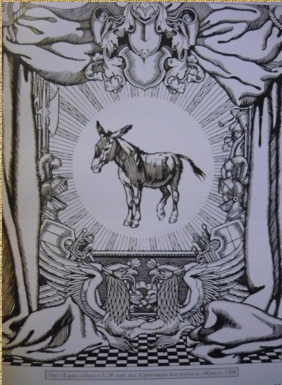
Осел (Equus asinus) в 1/20 нат. вел. Карикатура для журнала «Жизнь», 1906

Самая безжалостная антимонархическая карикатура журнала «Осёл».