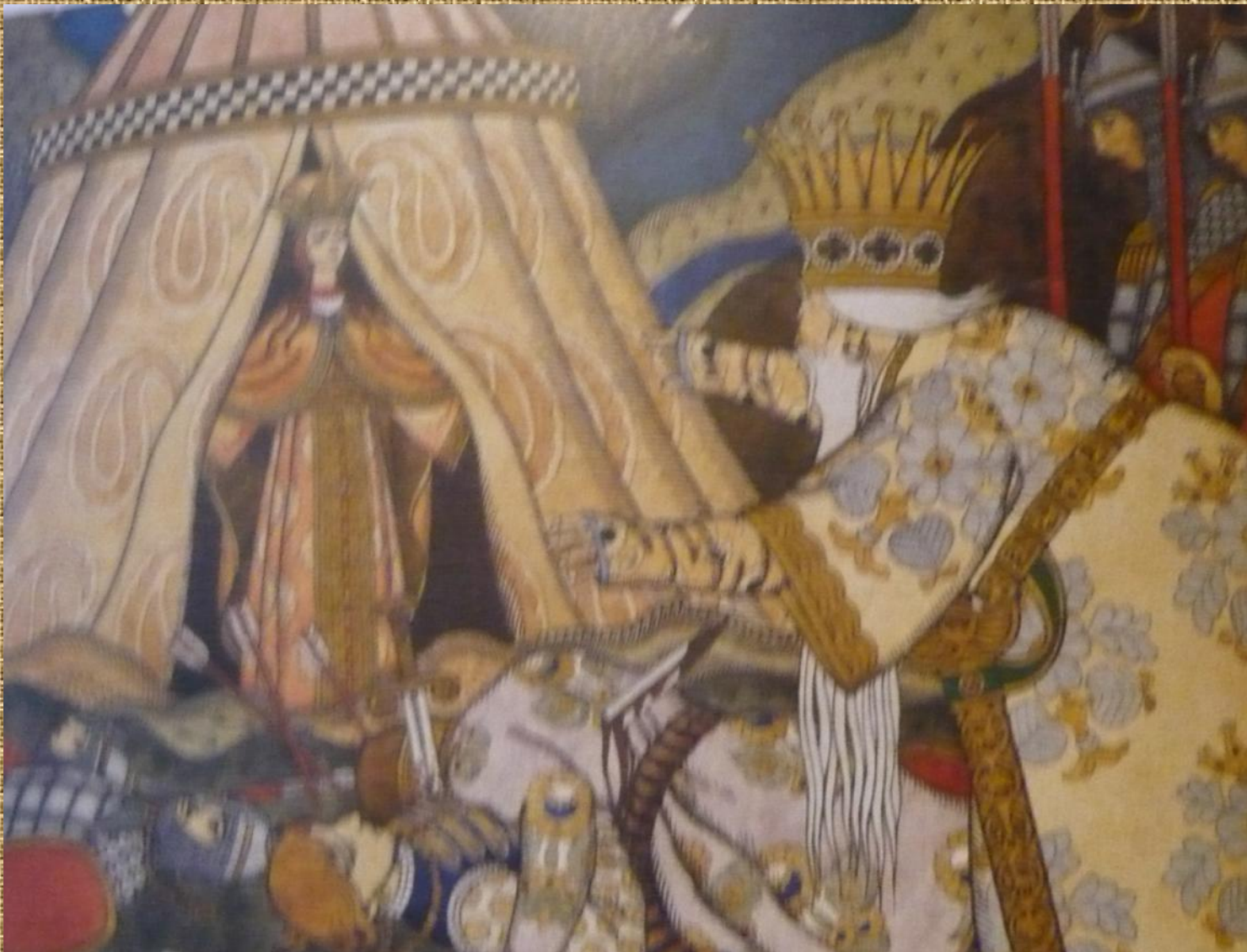
«Сказка о Золотом петушке»