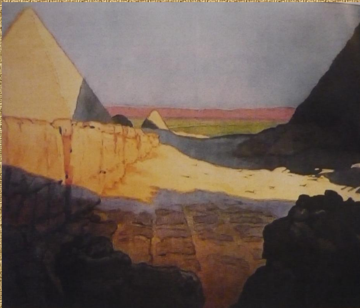
Египет. Пирамиды 1924 г