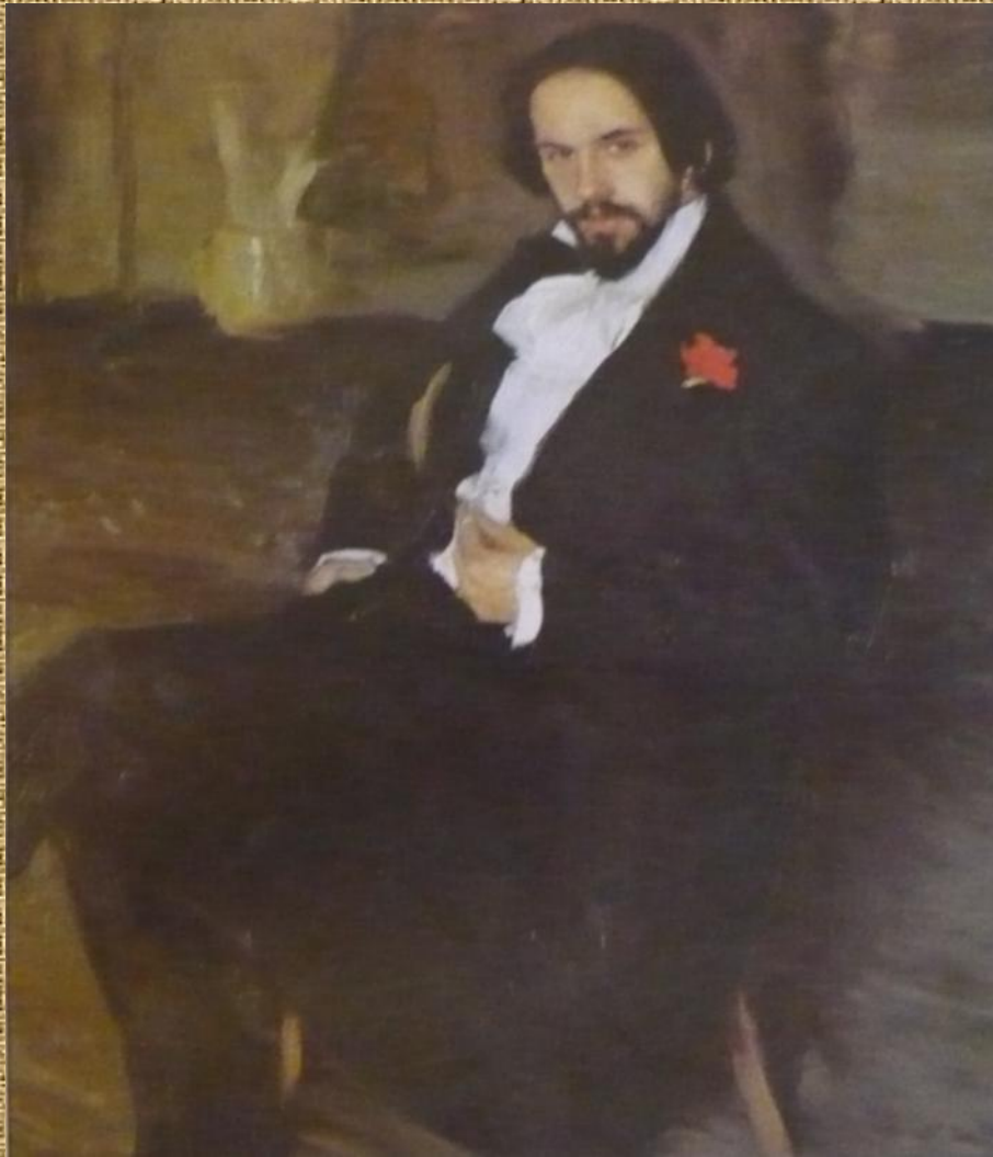
Б.М. Кустодиев. Портрет И.Я. Билибина. 1901 г