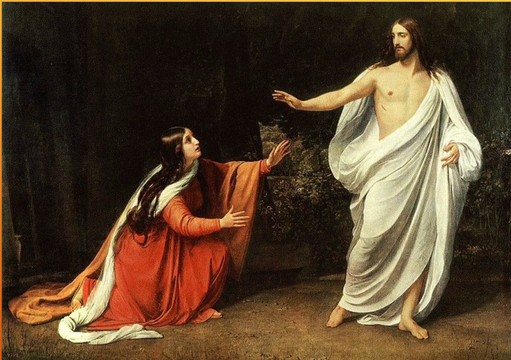
"Явление Христа Марии Магдалине" (1834-1835)