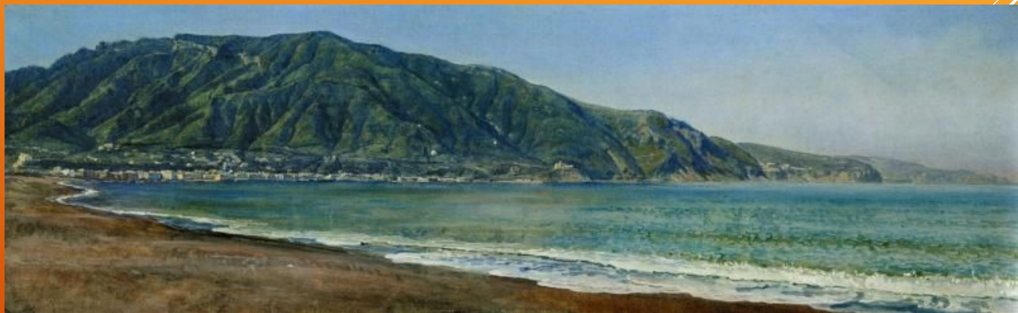
"Неаполитанский залив у Кастелламаре"