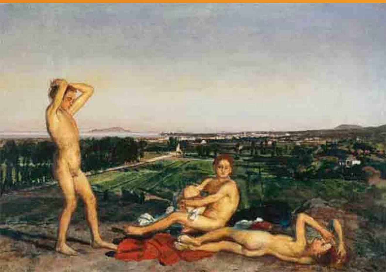
"Мальчики на Неаполитанском заливе"