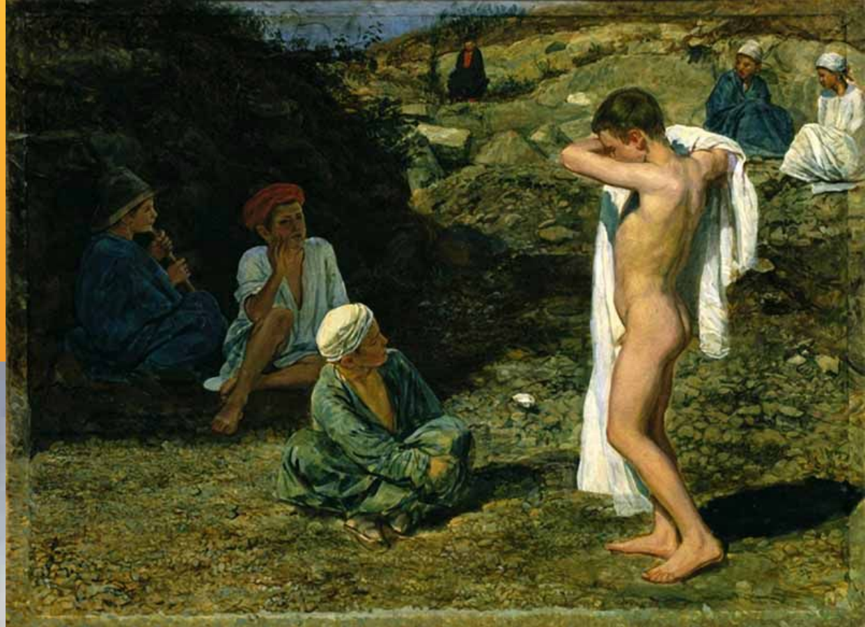
"Семь мальчиков в цветных одеждах и драпировках"