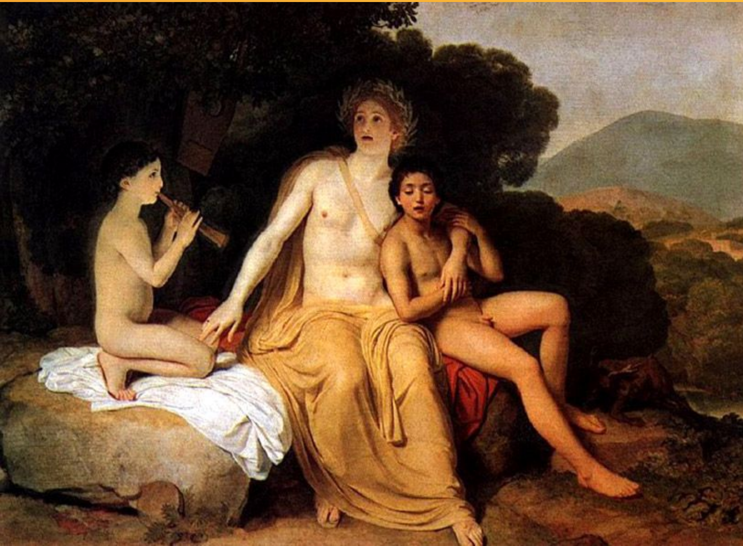
"Аполлон, Гиацинт и Кипарис, занимающиеся музыкой и пением" (1831-1834)

В Италии он изучает античные памятники, знакомится с искусством Ренессанса, восхищается венецианскими фресками.