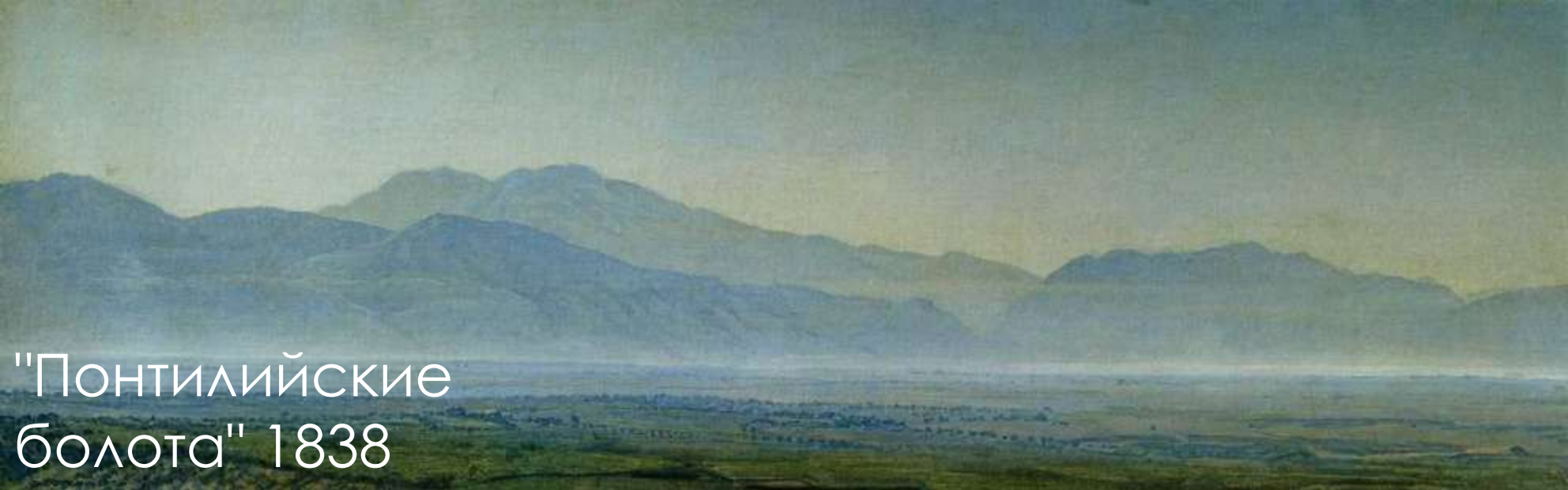
"Понтийские болота" 1838