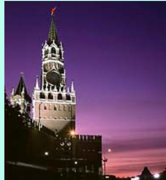
Спасская башня – главная башня Московского Кремля