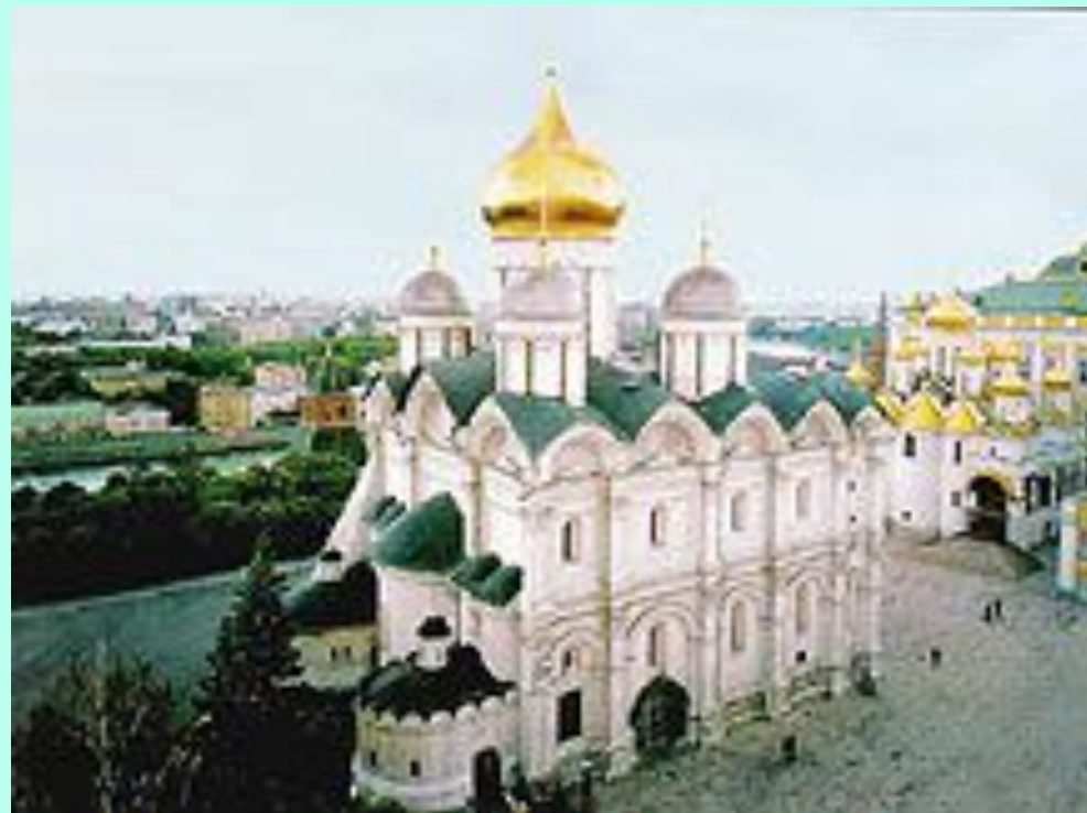
Архангельский собор Московского Кремля

Архангельский собор – самый пышный из всех кремлёвских соборов, украшенный белокаменными раковинами и резными пирамидами. Напоминает сказочный заморский дворец.