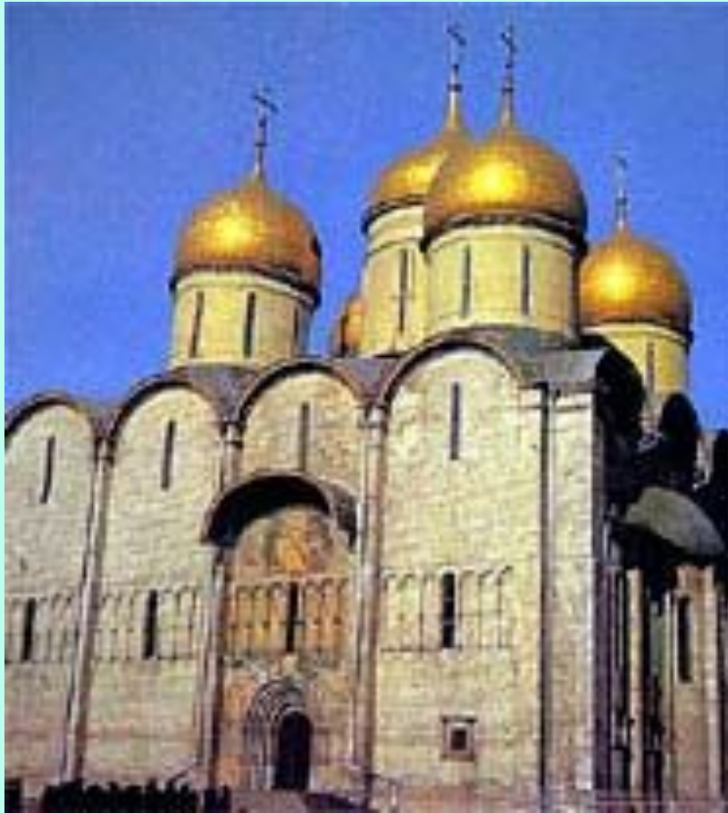
Успенский собор Московского Кремля

В Успенском соборе в торжественной обстановке венчались на царствование цари. Воины русские, уходя в бой, клялись в Успенском соборе не пощадить жизни для Москвы и всей отчей стороны.