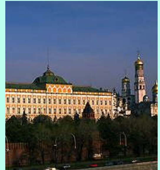
Вид на Большой кремлёвский дворец Московского Кремля