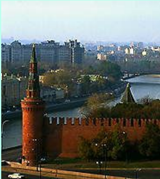
Стены и башни Московского Кремля