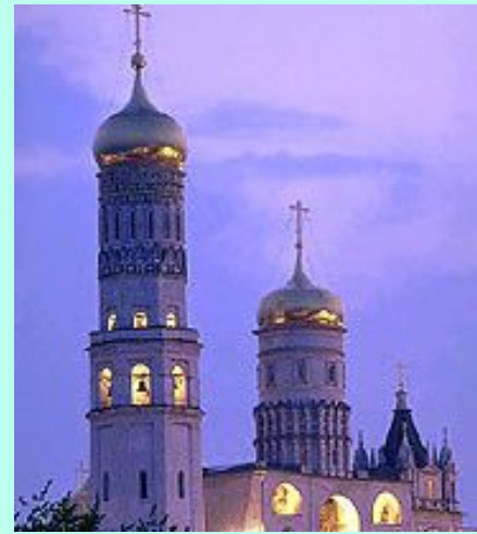
Колокольня Ивана Великого вечером

Рядом с Архангельским собором возвышается колокольня Ивана Великого.