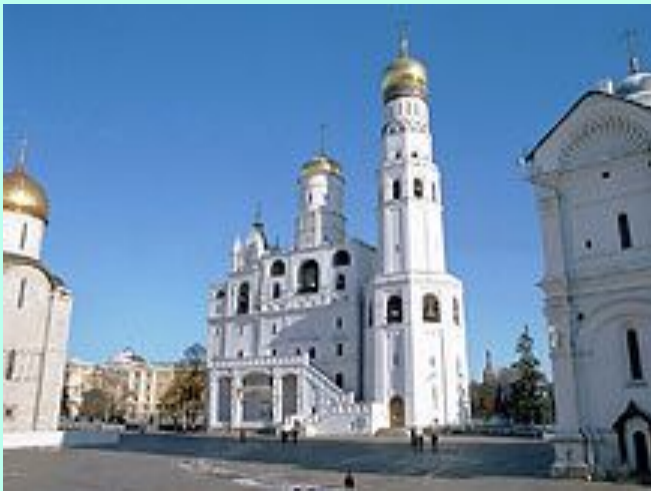
Колокольня Ивана Великого