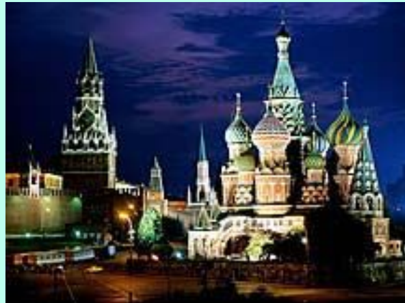
Вид на Покровский собор и Кремль вечером