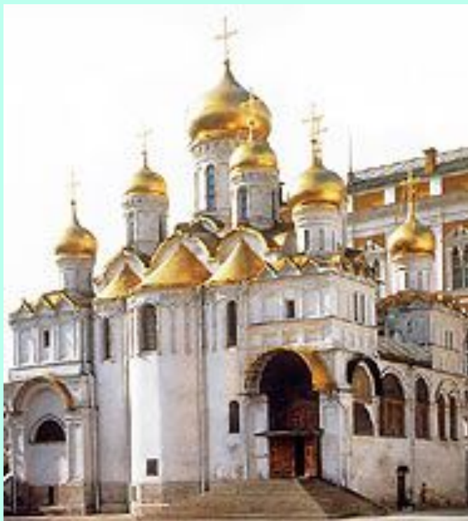
Благовещенский собор Московского Кремля