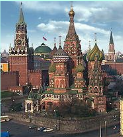
Храм Василия Блаженного