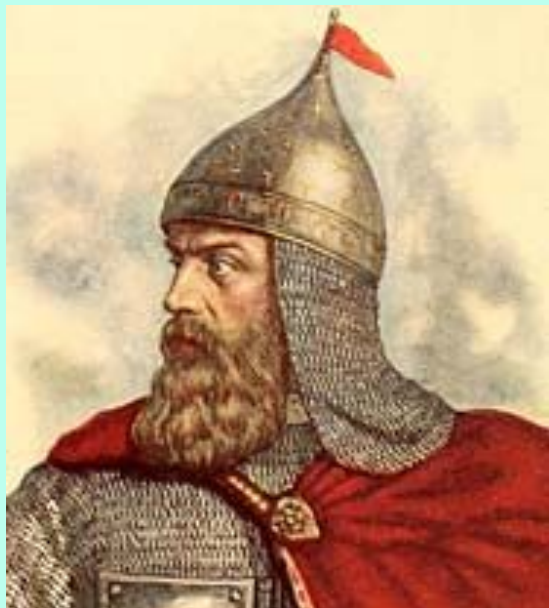
Князь Дмитрий Донской

При князе Дмитриии Донском стены и башни Московского Кремля были построены из белого камня. И прозвали люди Москву белокаменной.