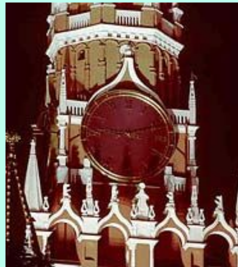
Куранты на Спасской башне