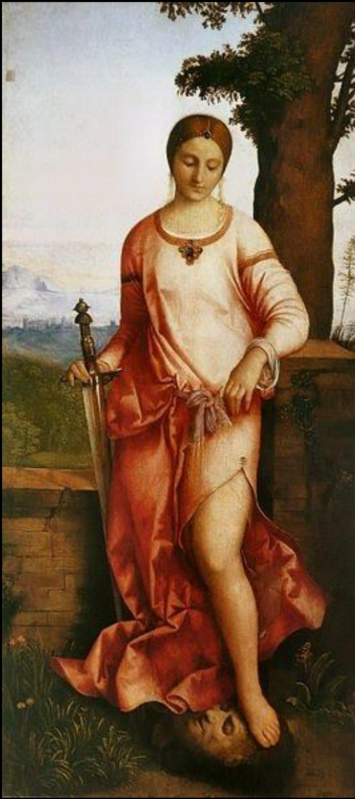
Джорджоне (1477-1510) Юдифь с головой Олоферна 1504г.