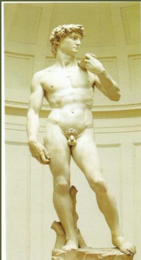
Микеланджело. Давид 1501-1504

Эпоха итальянского Возрождения подарила миру великолепные скульптурные образы и множество живописных произведений.