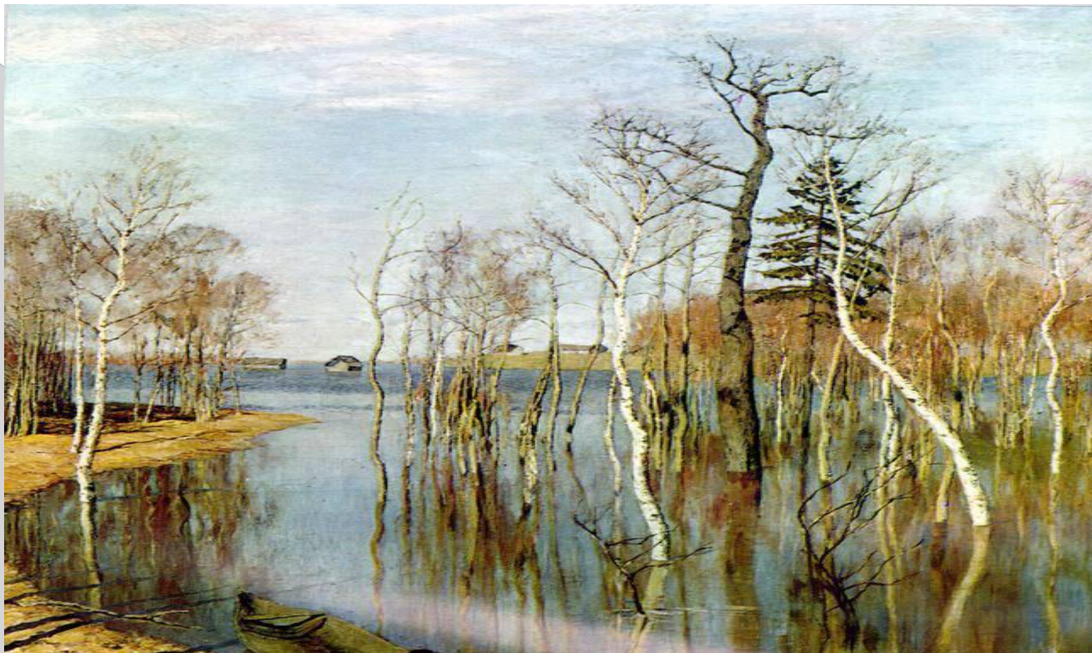
И.И.Левитан «Большая вода».