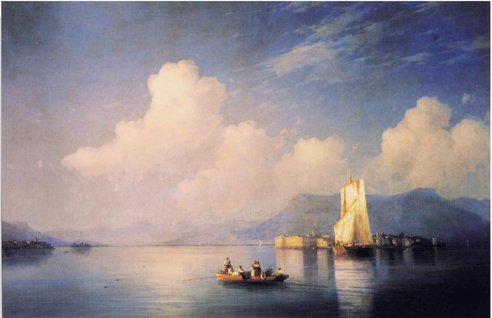
• И.К. Айвазовский «Итальянский пейзаж»