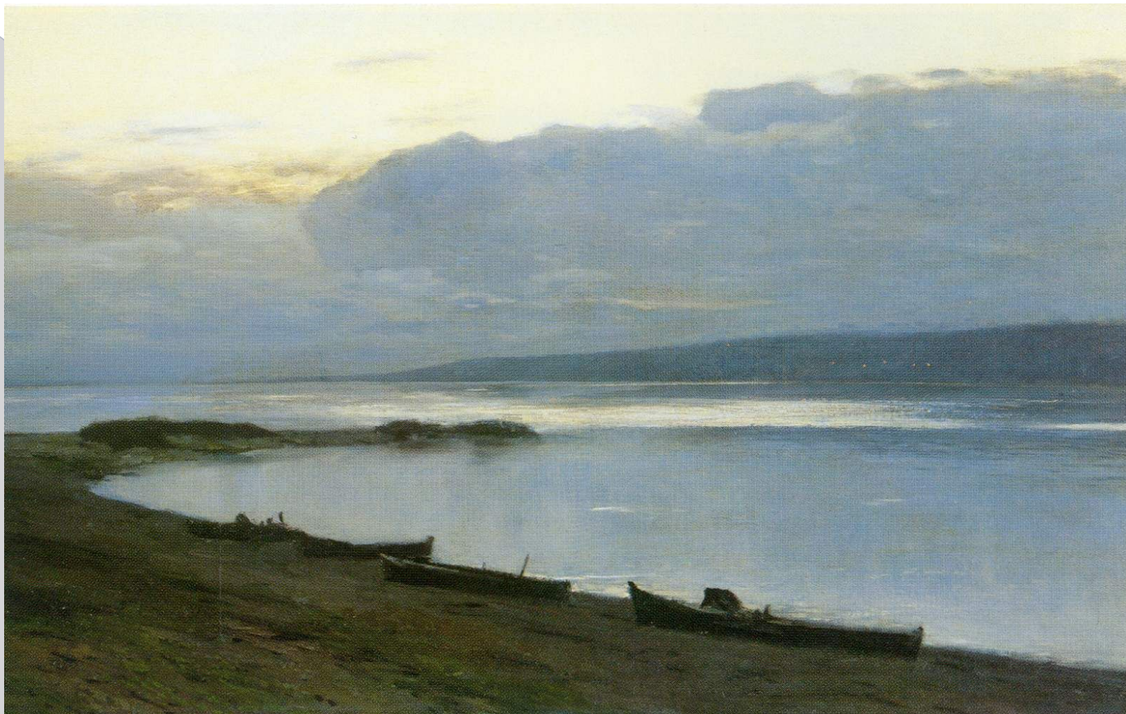
И.И.Левитан «Вечер на Волге»