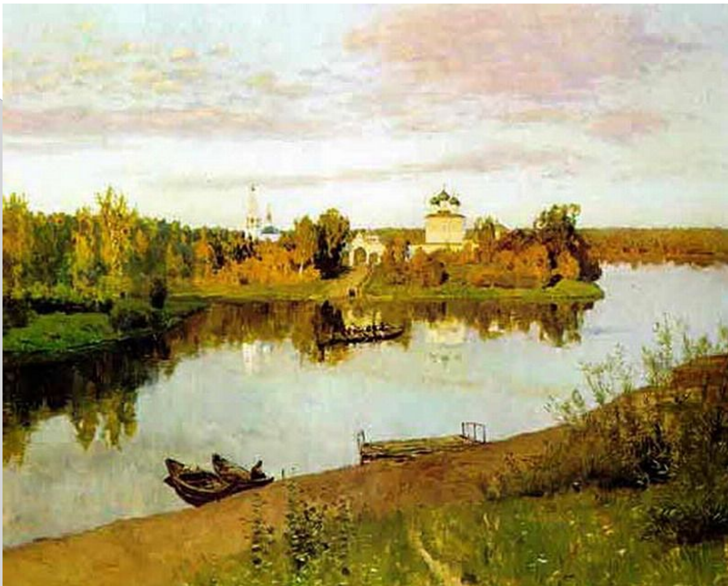
И.И.Левитан «Вечерний звон»