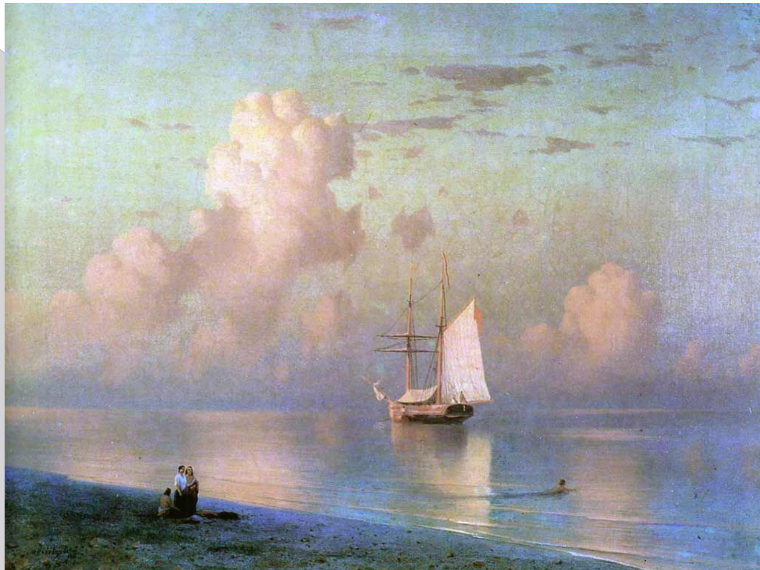
И. К. Айвазовский «Закат»