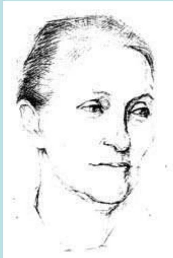
О. Филатова.» Женский портрет.» Учебная работа