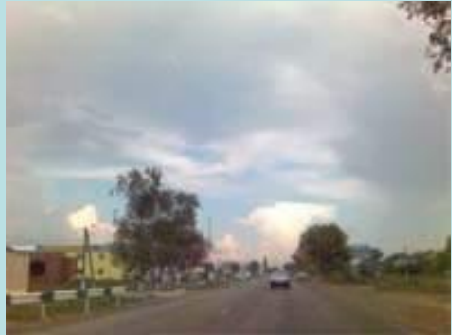
Сельский пейзаж в Краснодарском крае

Для всех, кто прикасается к искусству, непревзойденным Учителем является божественная природа, чьи творения никогда не повторяются, полны жизненной силы, дарующей вдохновение.