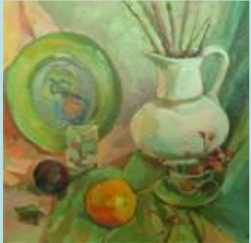
С. Картавцева. Натюрморт с белым кувшином. Учебная работа