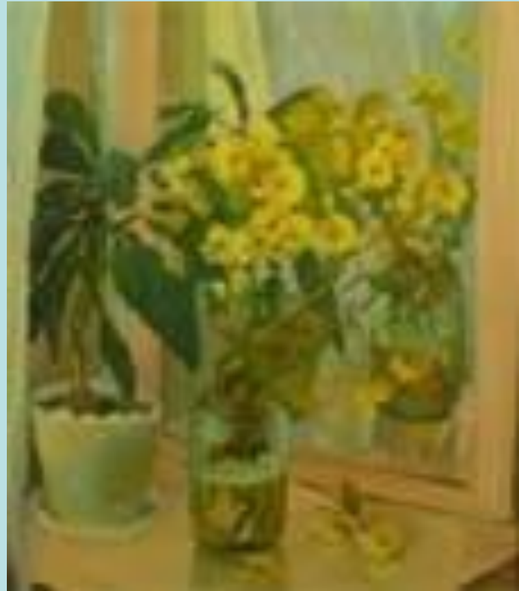
О.Д. Картавцева «Желтые цветы»