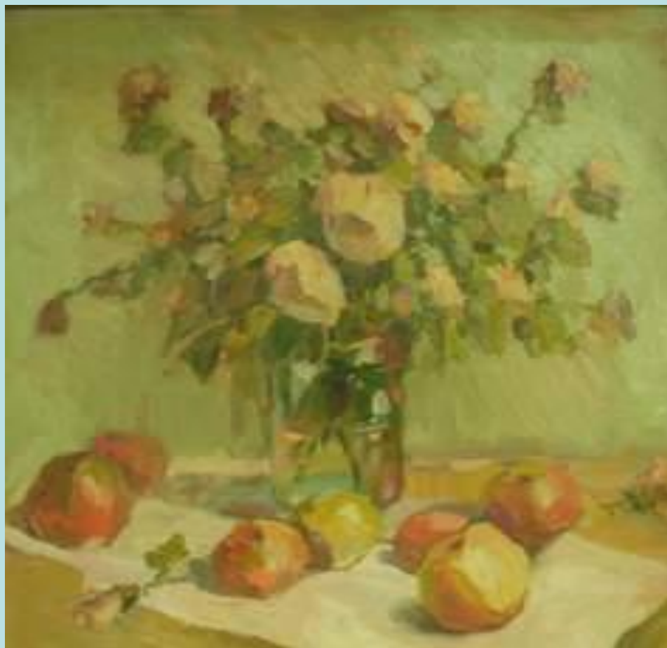
О.Д. Картавцева «Цветы и плоды»