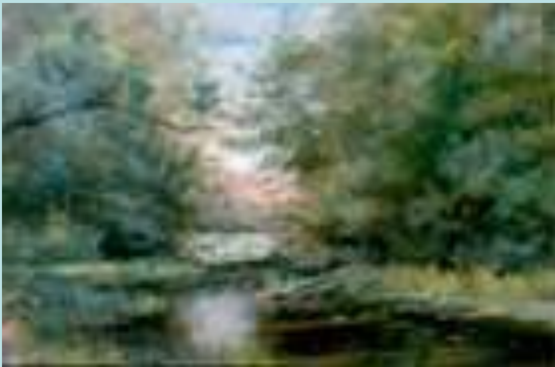
В. Кондратов «В окрестностях ст. Вешенской»