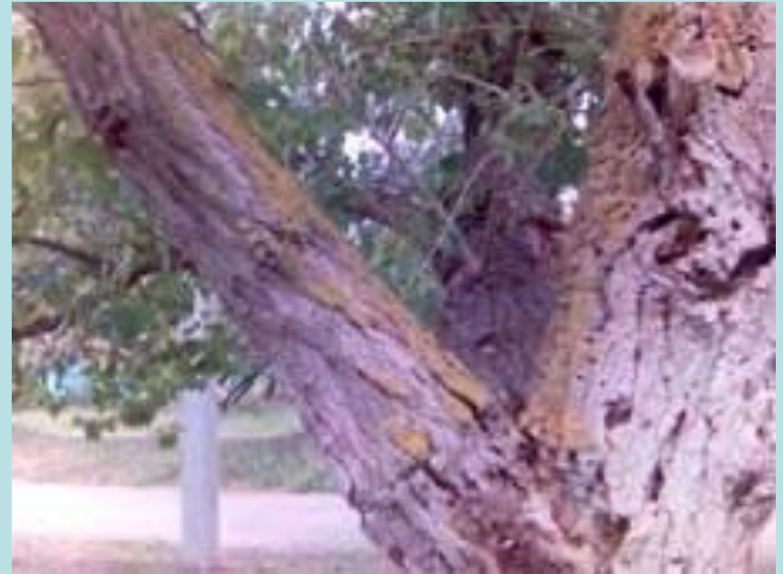
Фрагмент дерева .