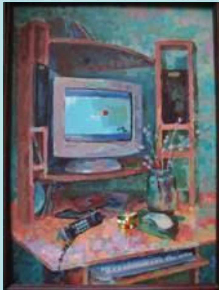
С.. Картавцева «Компьютерный столик», Дипломная работа.