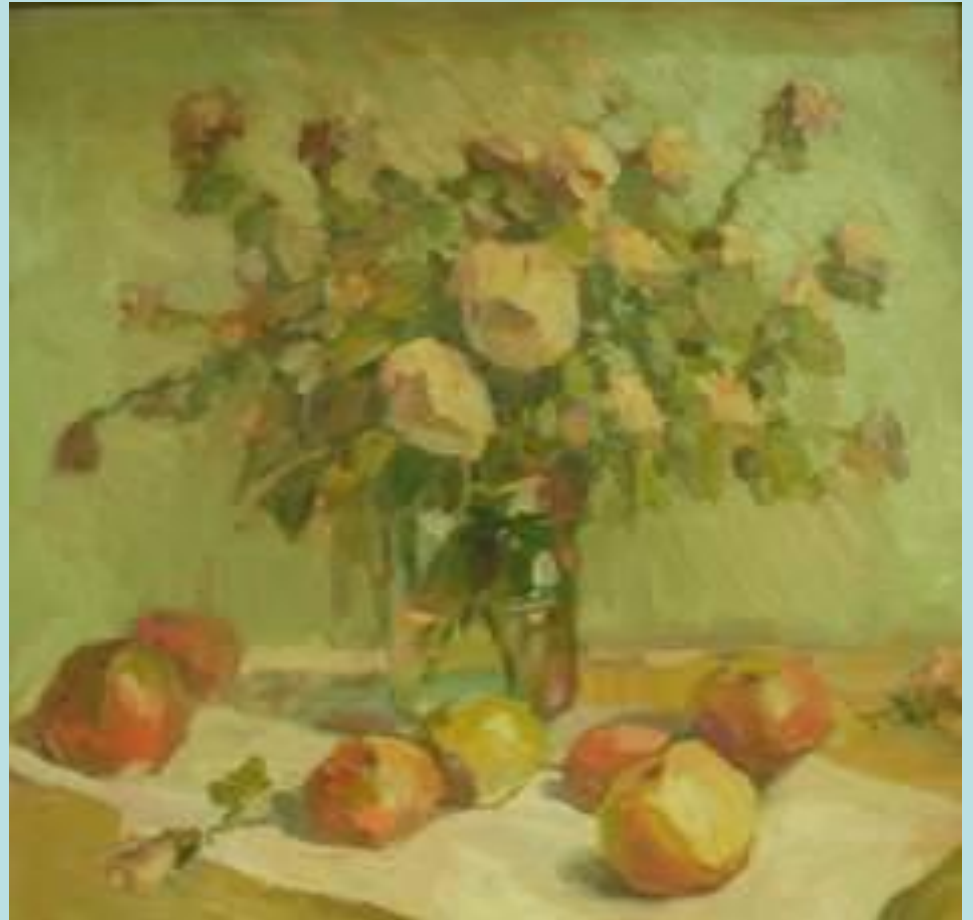
О.Д. Картавцева «Цветы и плоды»