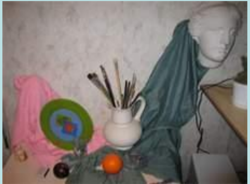
Пример организации постановки натюрморта с предметами искусства.