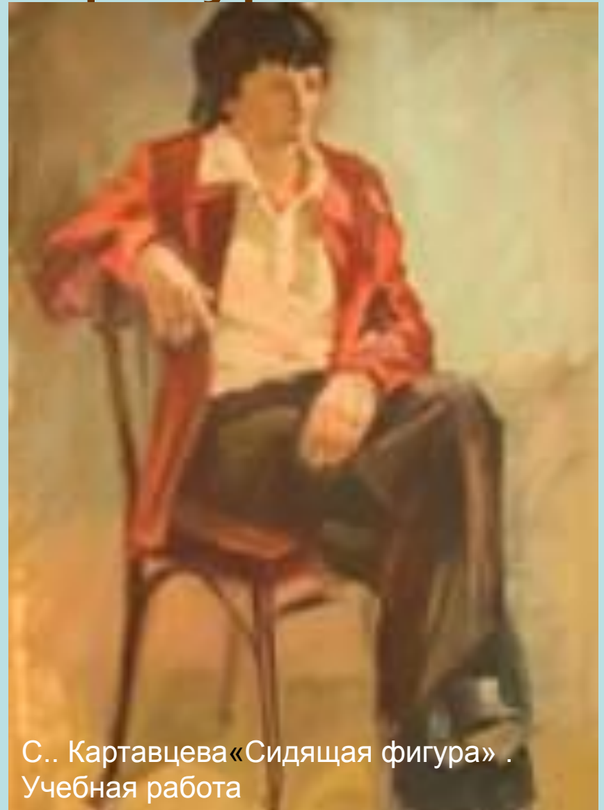
С.. Картавцева «Сидящая фигура» . Учебная работа