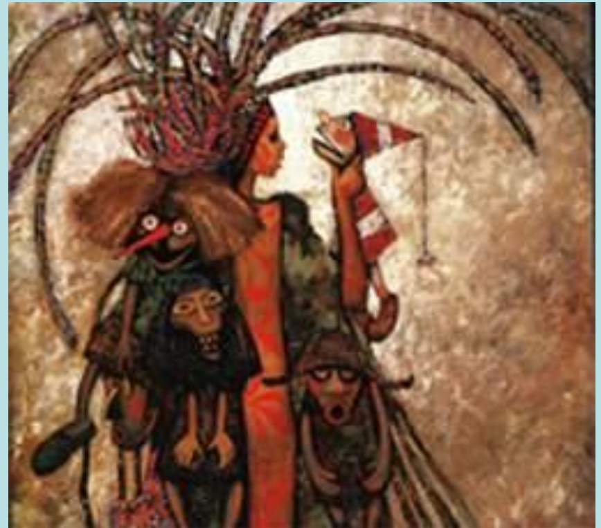
В. Рябчиков «Девушка с куклами»