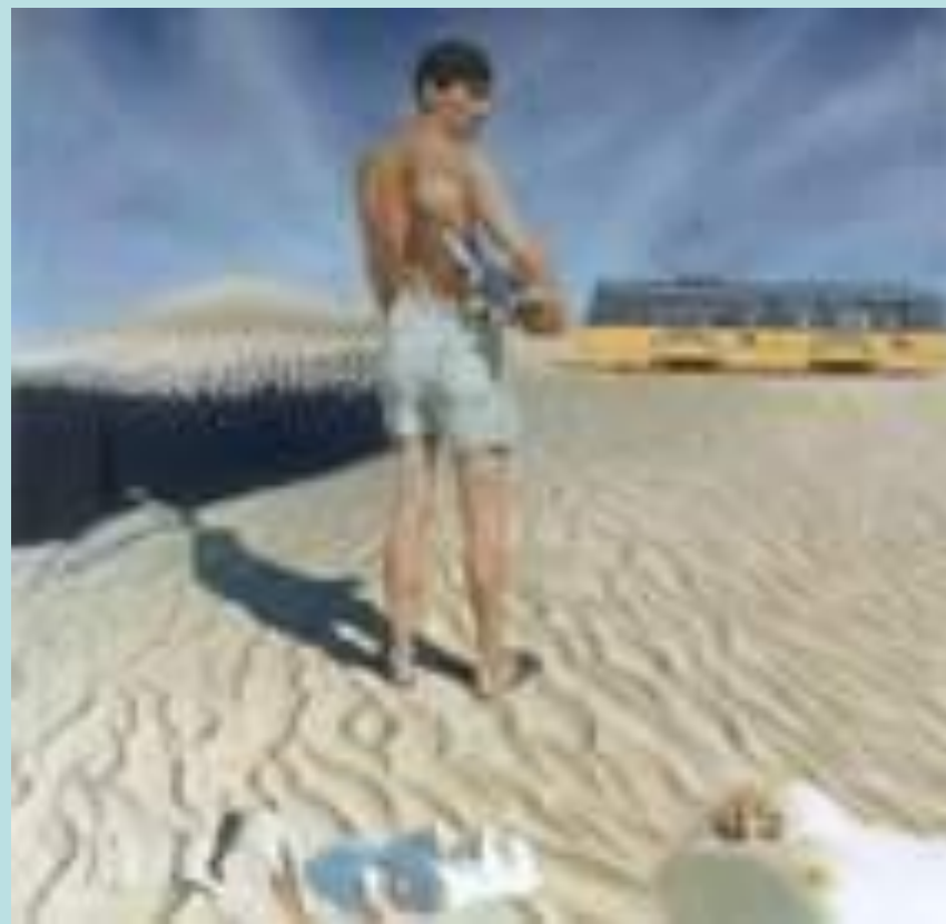
О. Игнатов «Возвращение Европы»