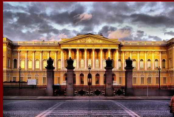
Русский музей в Санкт-Петербурге