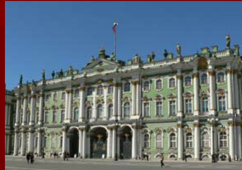
Эрмита́ж в Санкт-Петербурге