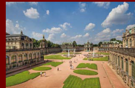
картинная галерея Дрезден, Германия