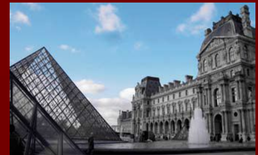
Лувр, Париж, Франция