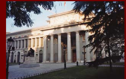
Прадо, Мадрид, Испания