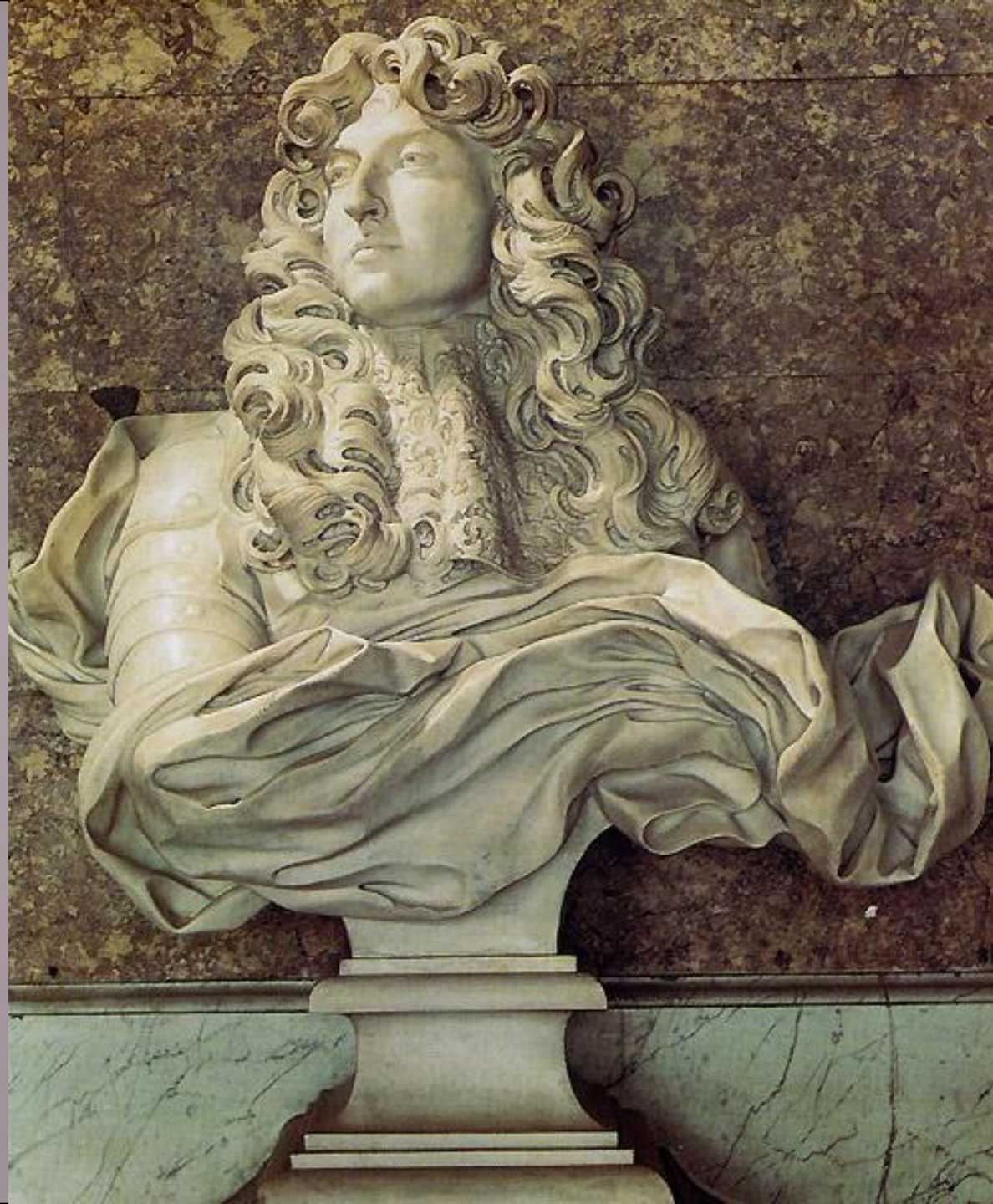
Бюст Людовика XIV