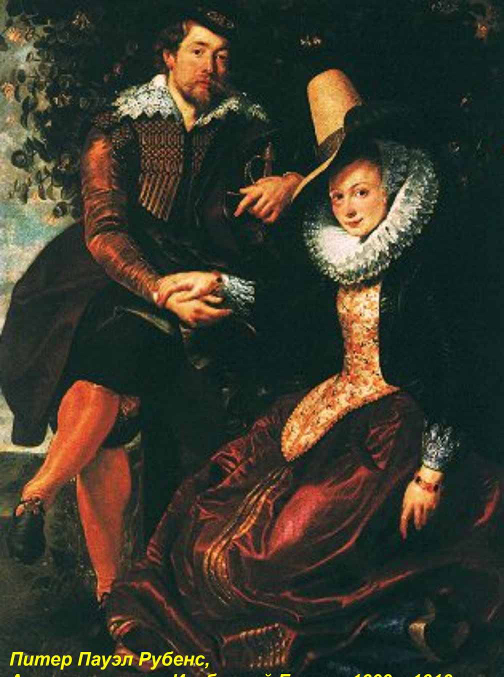
Питер Пауэл Рубенс, Автопортрет с Изабеллой Брапт. 1609—1610 гг. Старая Пинакотека, Мюнхен

Посмотрите а его портрет и вы поймете, насколько талантлив был этот начинающий художник. Красивое лицо Рубенса спокойно и преисполнено чувства собственного достоинства. Модный, щегольской костюм с широким кружевным воротником, шляпа с высокой тульей и металлической брошкой, кожаные туфли с изящными подвязками подчеркивают его аристократичность и тонкий художественный вкус. Он сидит с молодой женой в беседке, увитой зеленью и цветущей жимолостью. С видом ласкового покровительства он слегка склонился к жене, его рука опирается на шпагу. Выразительные глаза обращены прямо к зрителю, их бесконечно добрый взгляд полон тихого и безмятежного счастья. Две склоненные друг к другу фигуры, красноречивый жест соединенных рук символизируют внутреннее согласие и любовь.