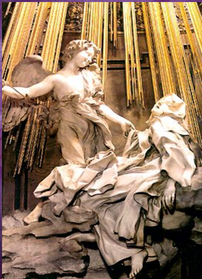
«Экстаз Святой Терезы»