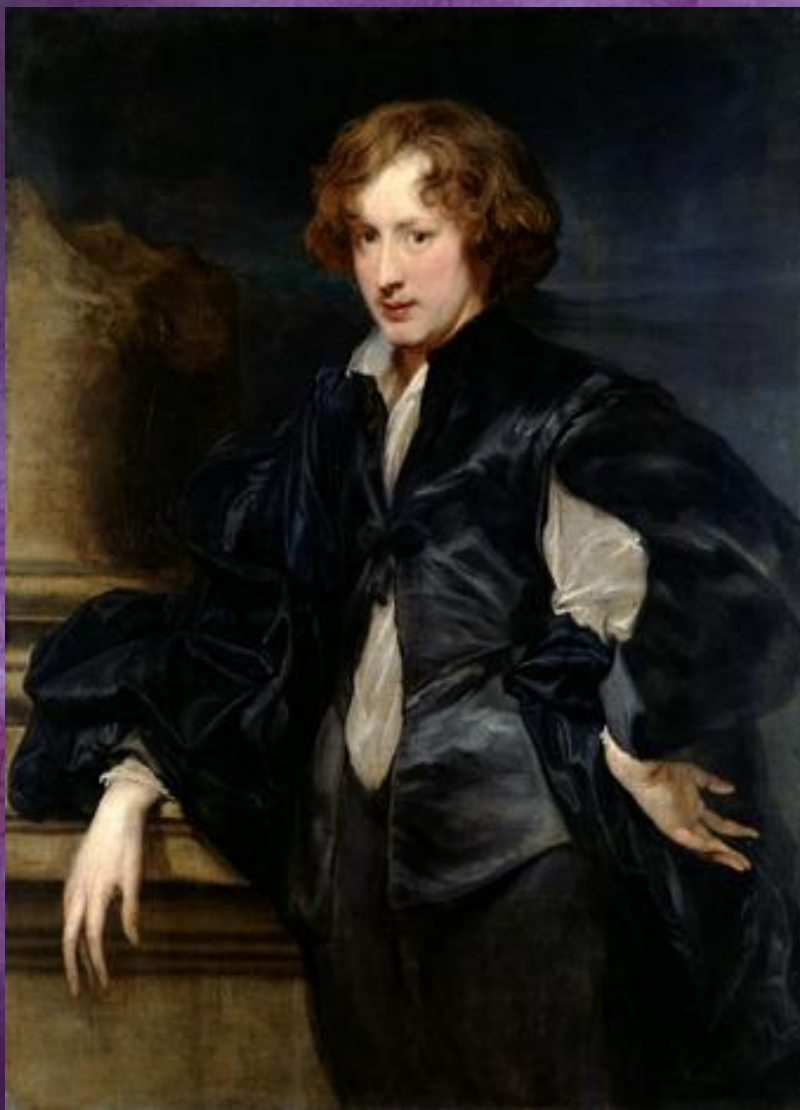
Антонис Ван Дейк. Автопортрет. Конец 1620-х — начало 1630 х гг. Государственный Эрмитаж, Санкт-Петербург