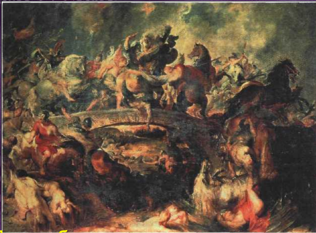
Питер Пауэл Рубенс. Битва амазонок с греками. 1615—1619 гг. Старая Пина котека, Мюнхен