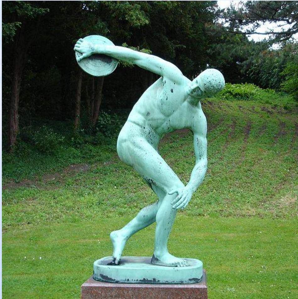
«Дискобол» Мирона в Ботаническом саду Копенгагена