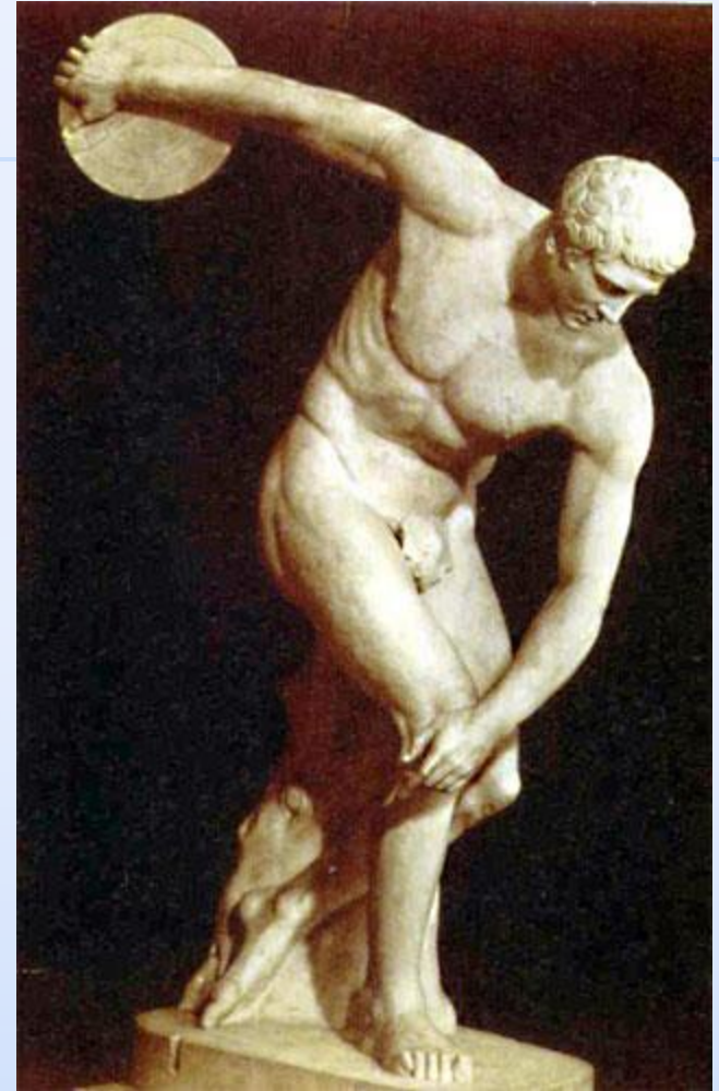
«Дискобол» (копия) в Британском музее.