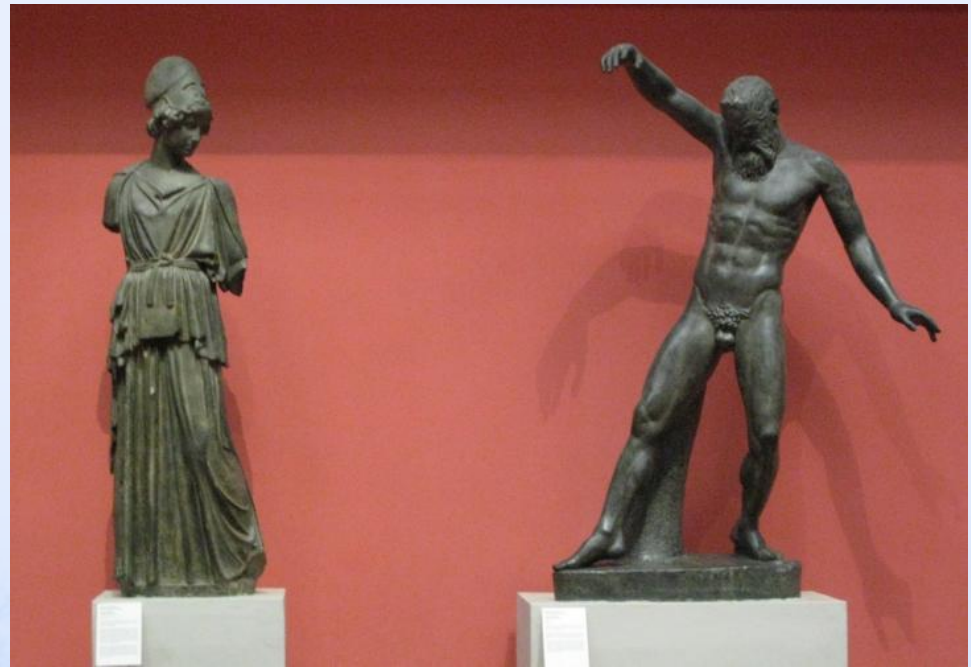
«Афина и Марсий»