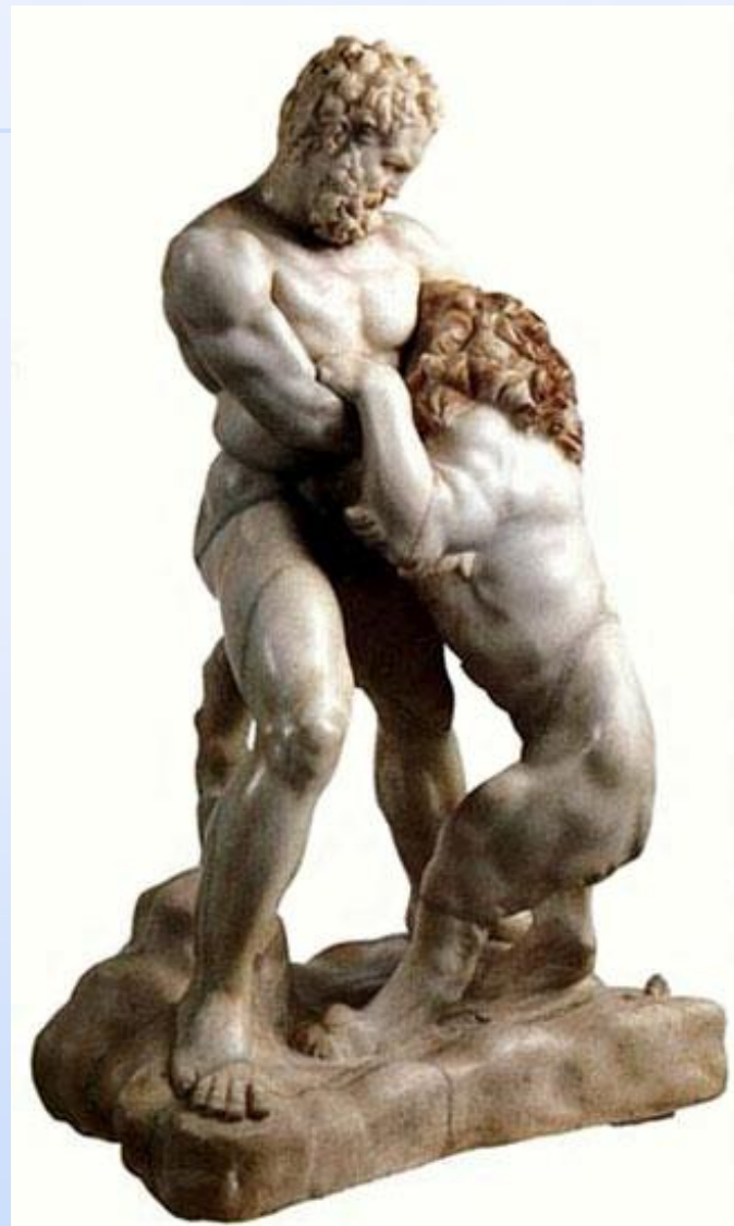
Геракл, борющийся со львом