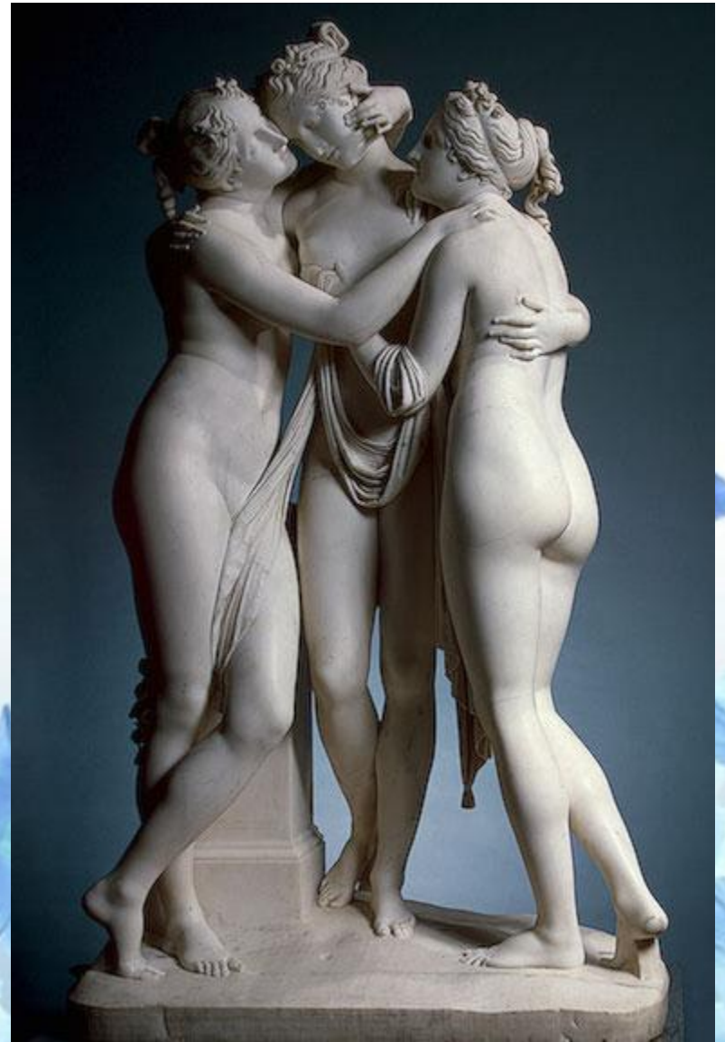
Антонио Канова. Три Грации. 1816г. Эрмитаж