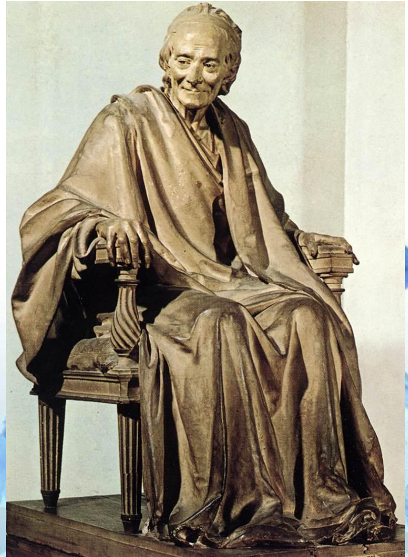
Жан Антуан Гудон. Вольтер 1779-1781 «Комеди Франсез», Париж