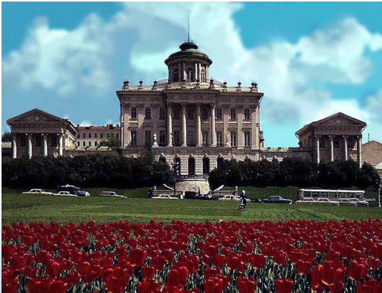
Дом Пашкова В.И.Баженов, 1784-1786 Россия, Москва