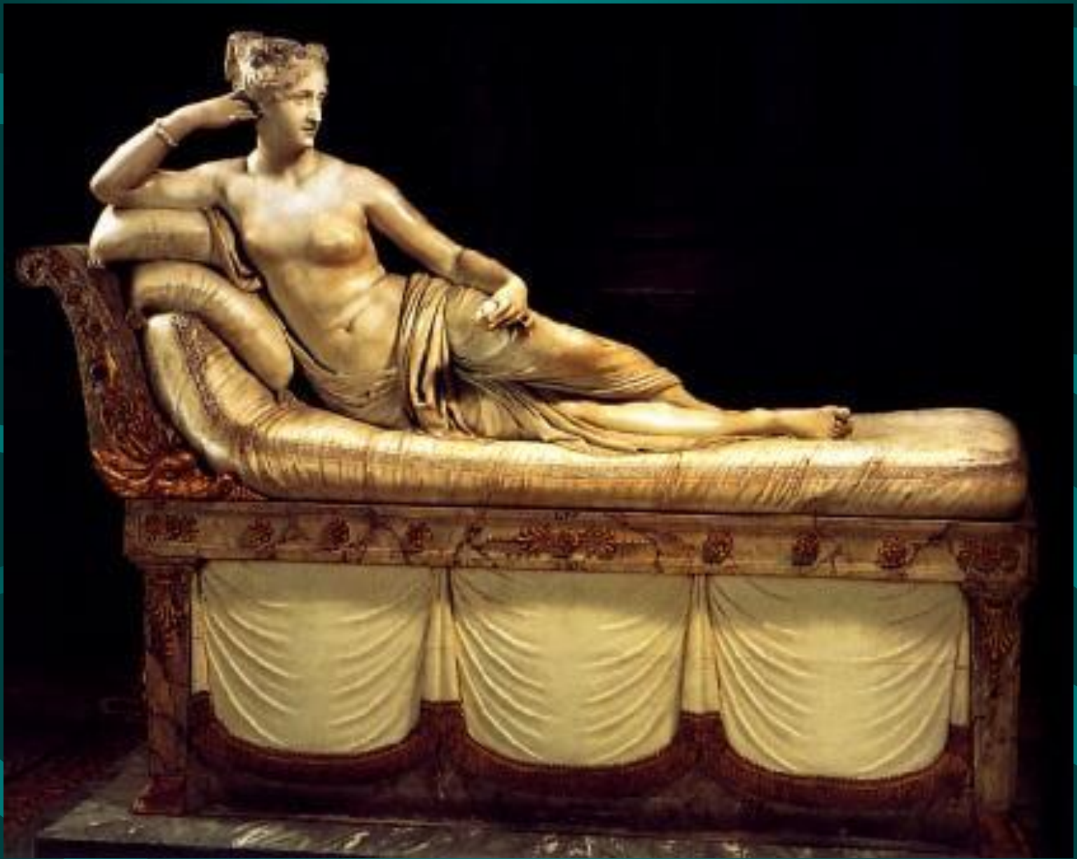
Антонио Канова.. Портрет Полины Боргезе в образе Венеры. Мрамор. 1805-1807 годы. Галерея Боргезе. Рим.