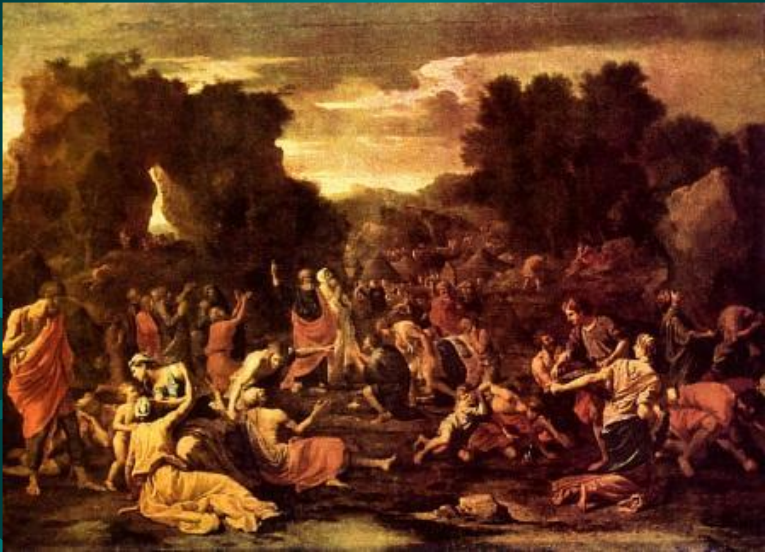
Николо Пуссен. Сбор манны в пустыне.