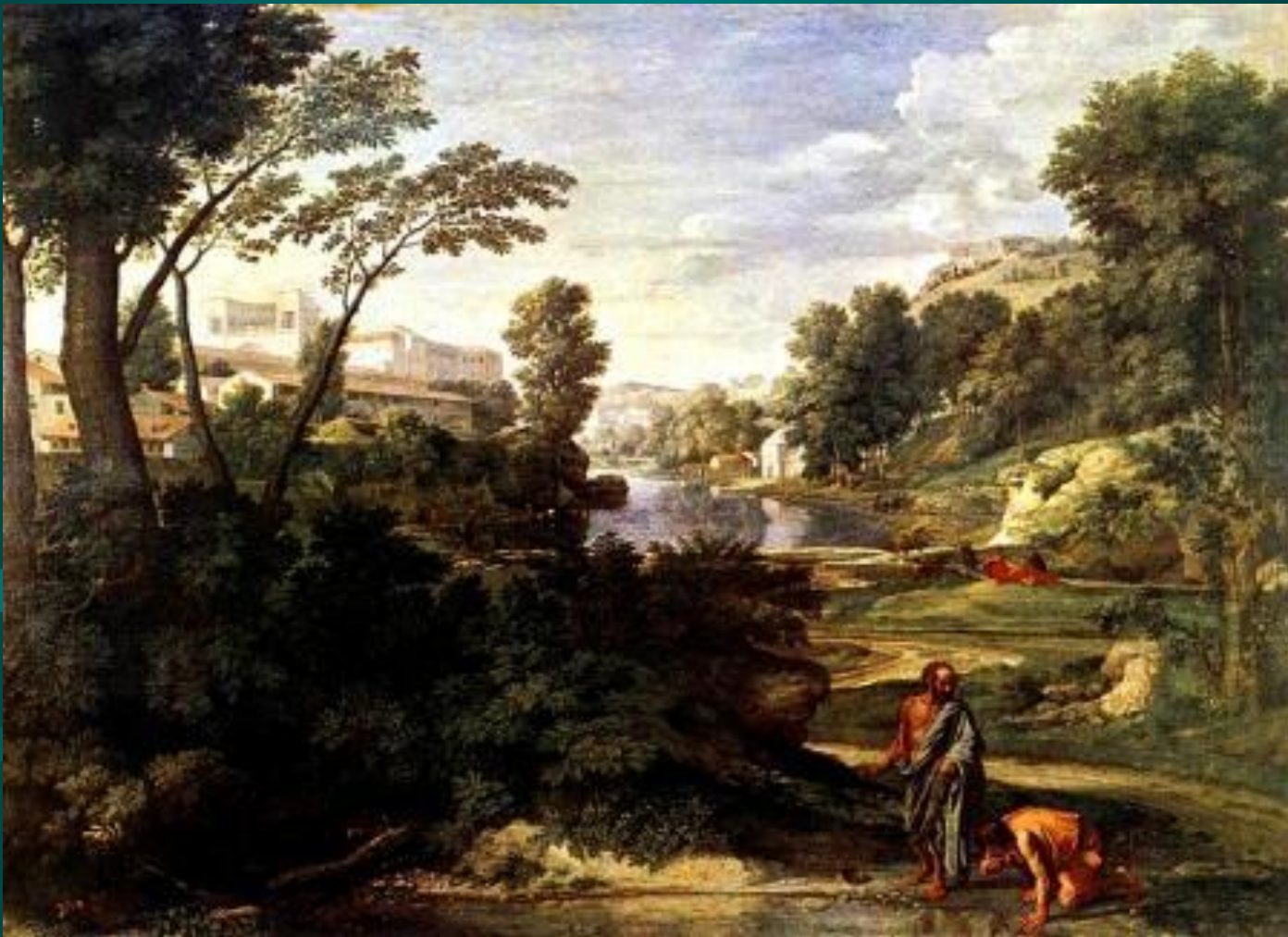
Пуссен. Пейзаж с Диогеном.