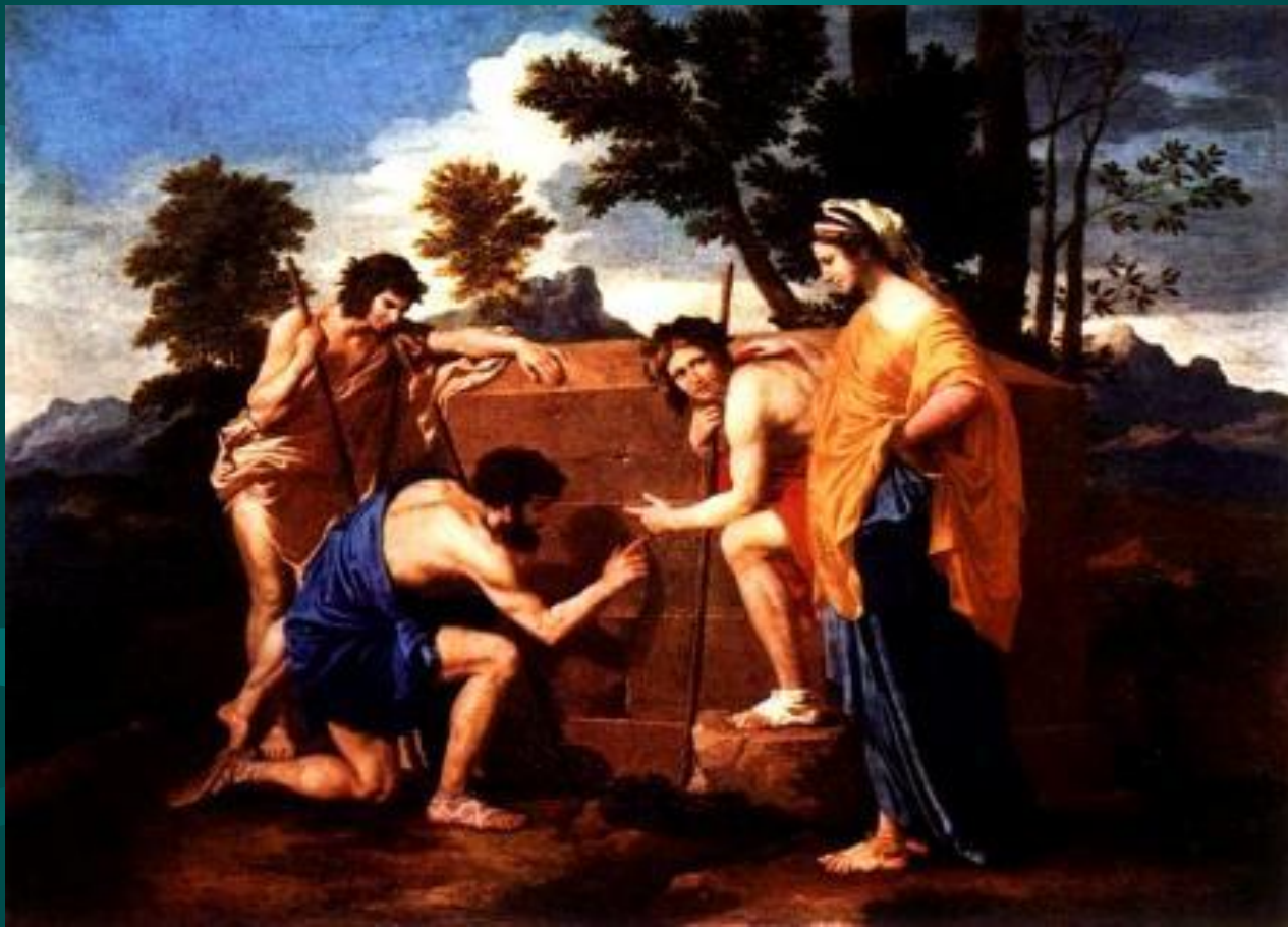
Никола Пуссен. Аркадские пастухи. 1638-1639 гг. Лувр, Париж.

Никола Пуссен – автор многочисленных картин на мифологические, исторические, религиозные и пейзажные темы. Картина «Аркадские пастухи» – одна из вершин творчества художника, плод его неустанных поисков. У каменного надгробия остановились трое молодых людей и молодая женщина. Судя по их одежде и посохам, это пастухи. Один из них припал на колено, он внимательно разбирает надпись на надгробии. Юноша и девушка слева замерли, погружившись в молчаливое раздумье о бренности человеческой жизни.