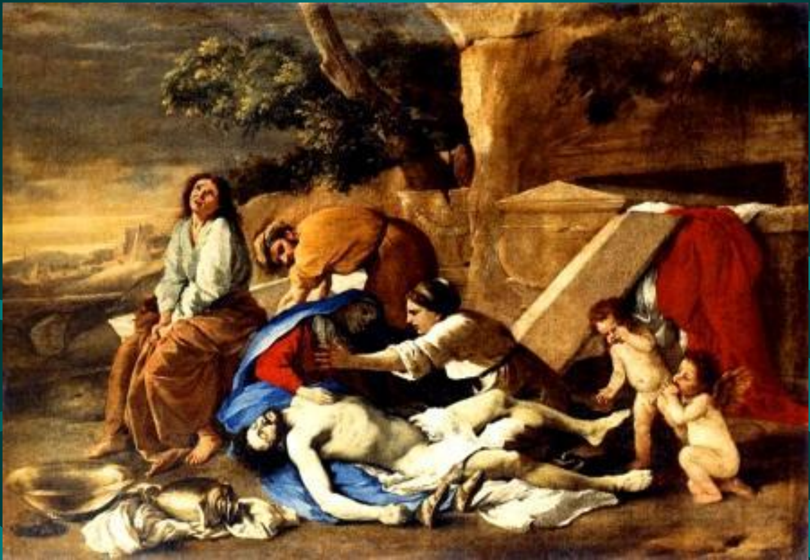
Николо Пуссен. Оплакивание Христа