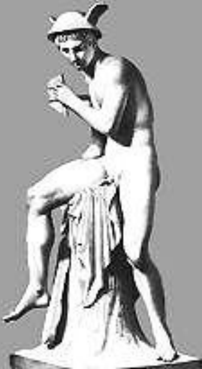
Бертель Торвальдсен. «Меркурий со свирелью». Мрамор. 1818. Музей Торвальдсена. Копенгаген.