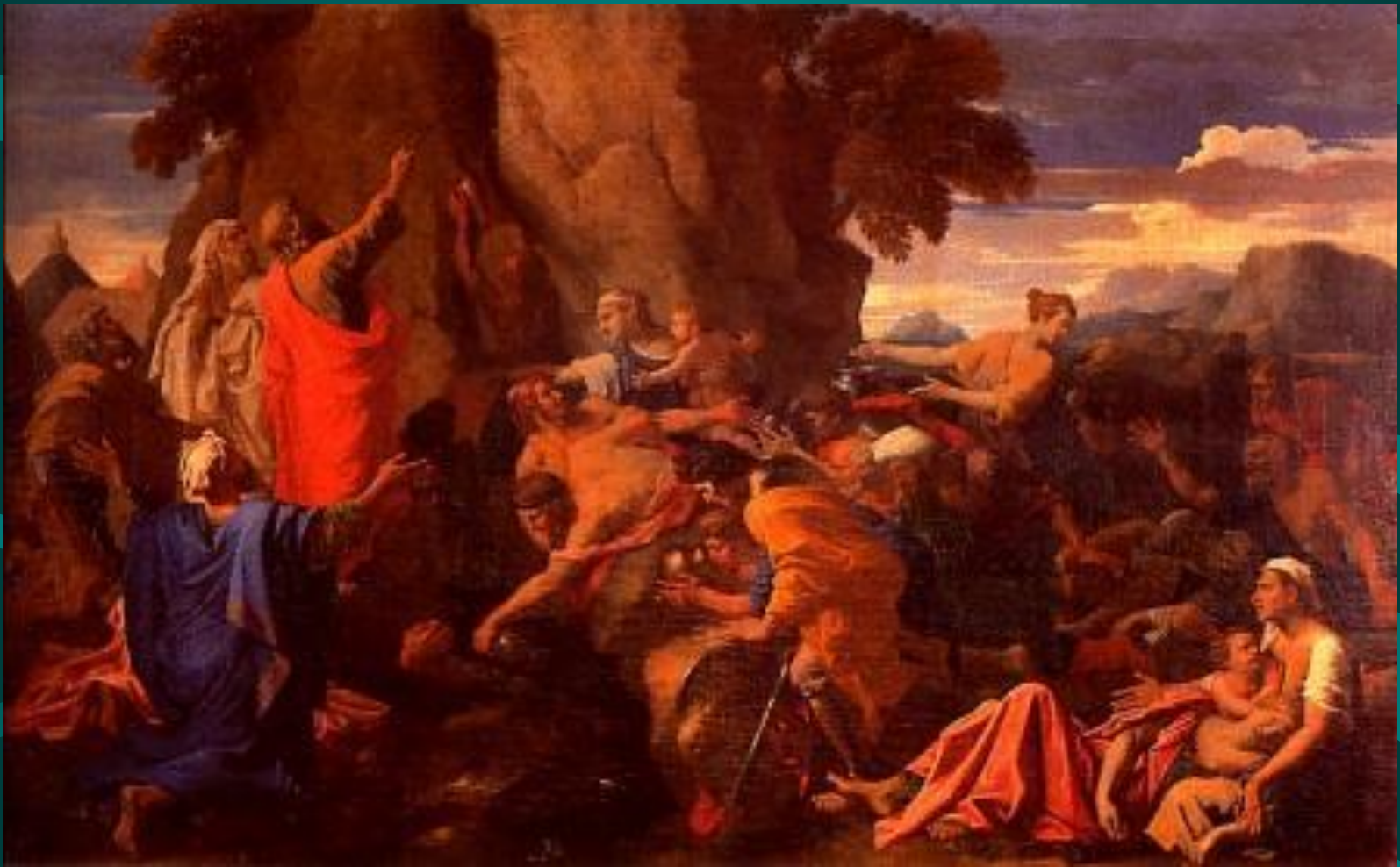
Николо Пуссен. Моисей, источающий воду из скалы