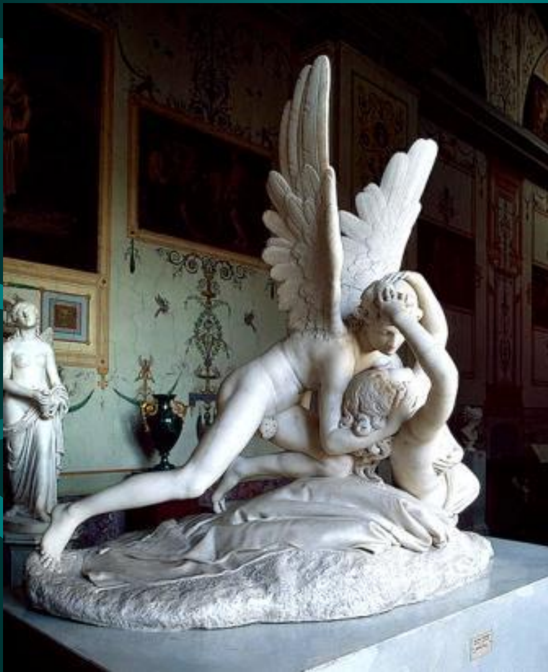
Антонио Канова .Амур, слетающий к Психее. 1793 г.