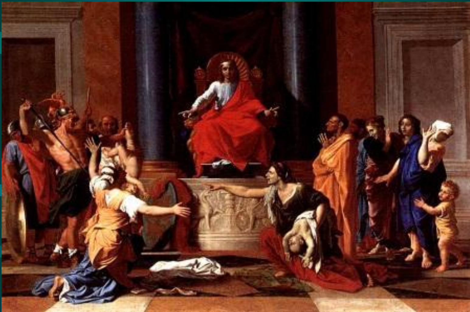
Николо Пуссен. Суд Соломона