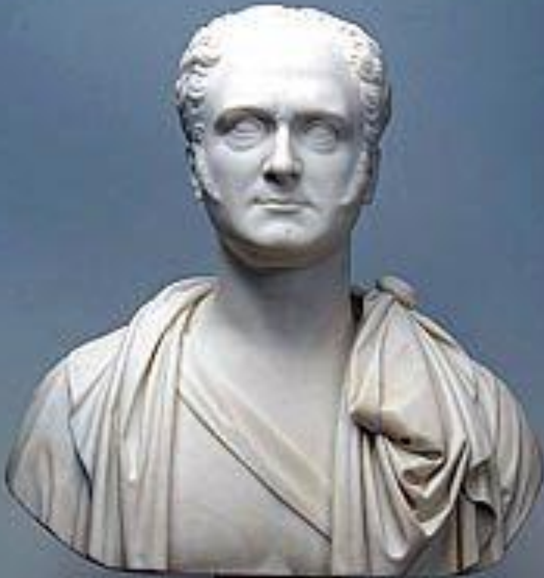
Бертель Торвальдсен. Бюст Александра. I Начало 1820-х годов.