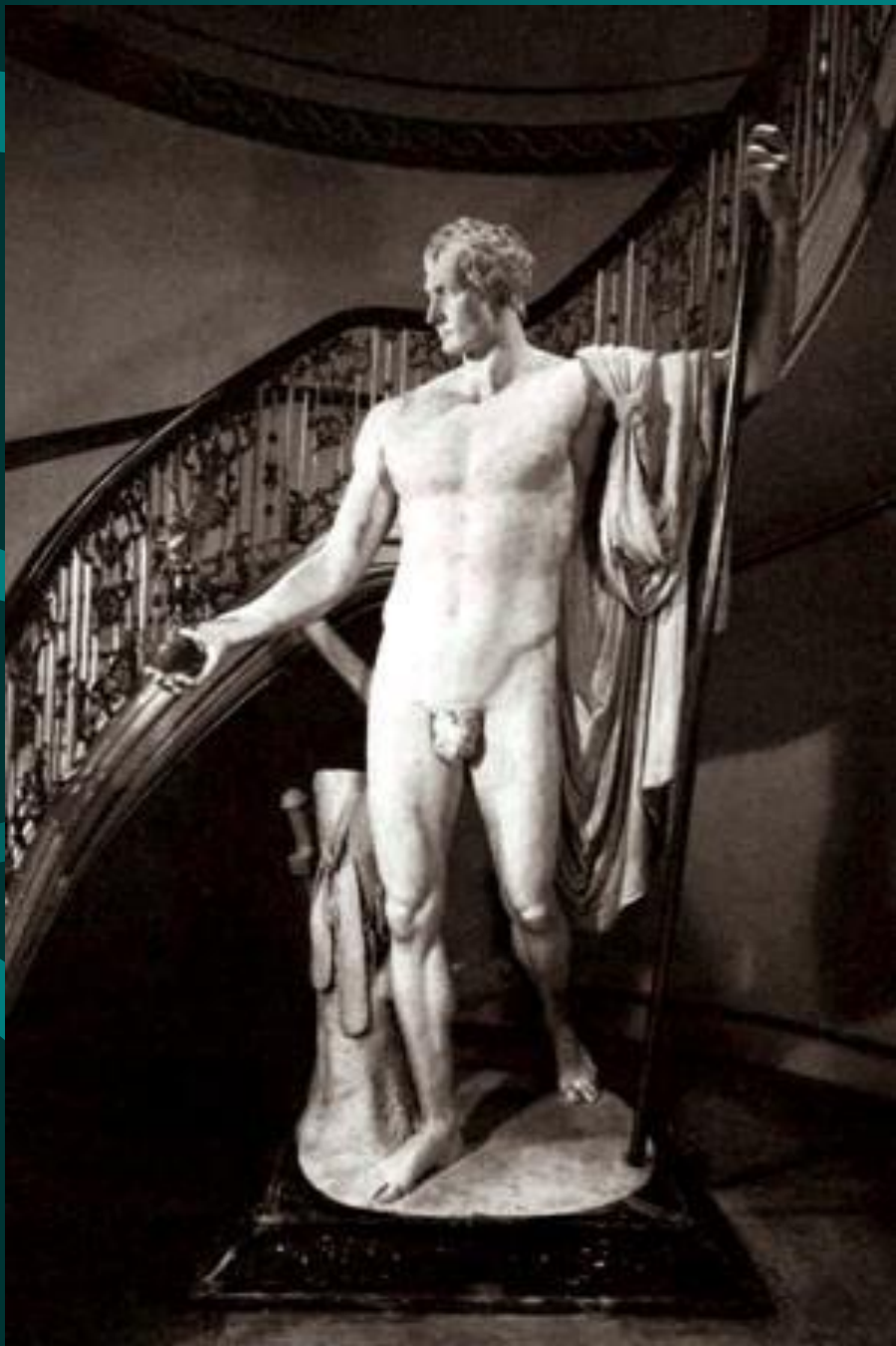
• Антонио Канова. Наполеон в образе Юпитера