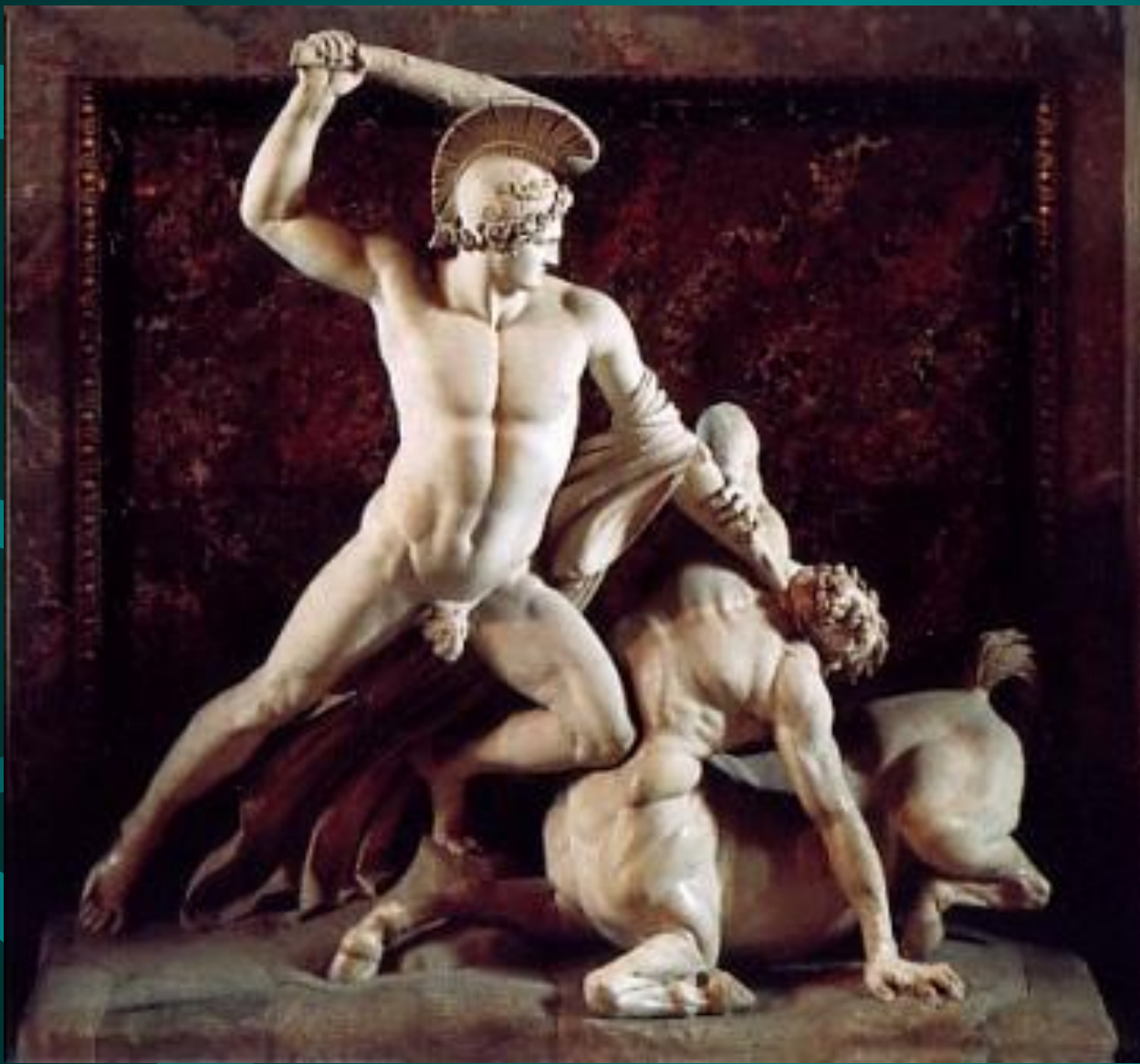
Антонио Канова. Тесей и кентавр.