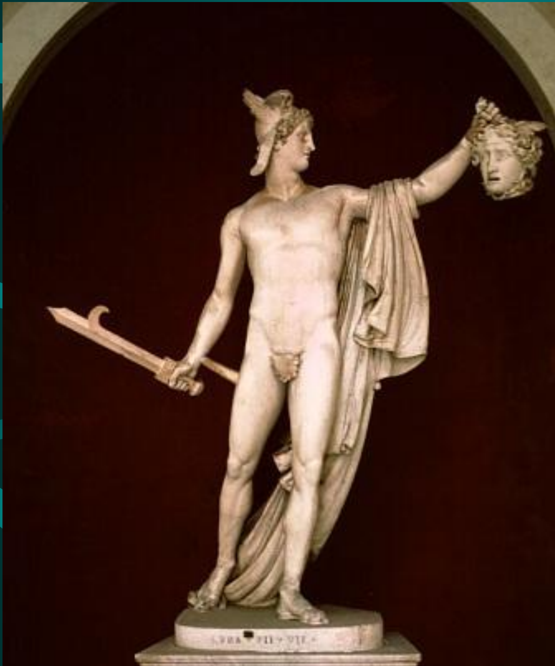
Антонио Канова. Персей.