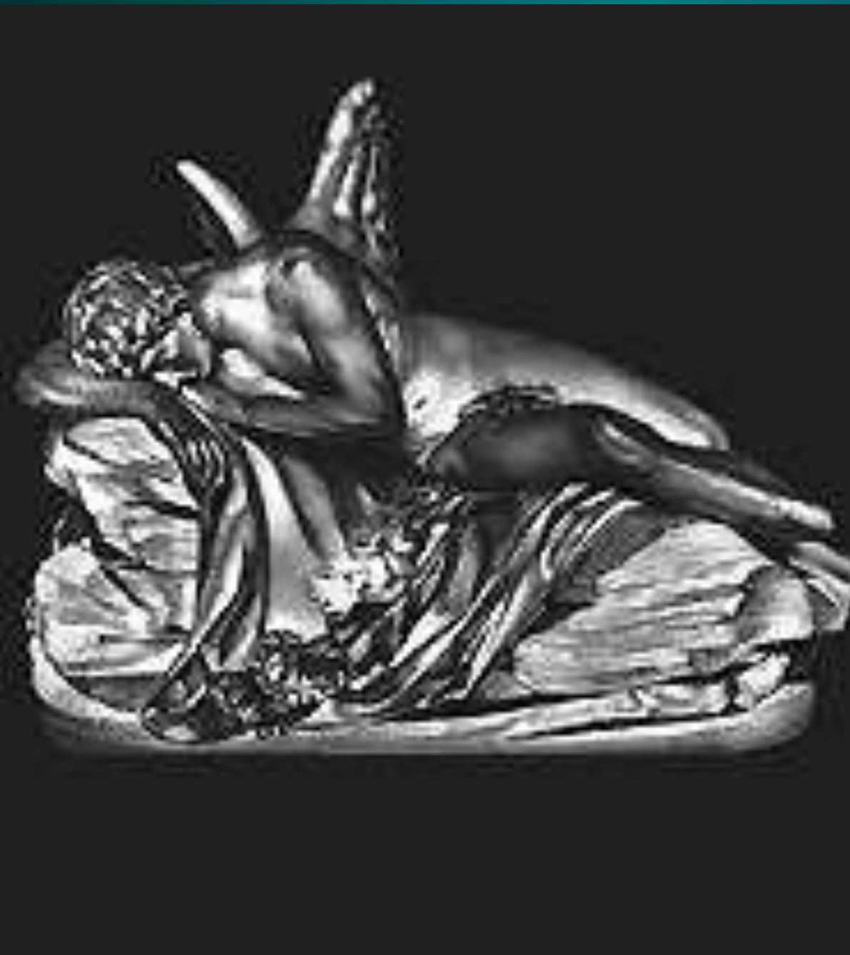
Жан Антуан Гудон. «Морфей». Мрамор. 1769. Лувр.