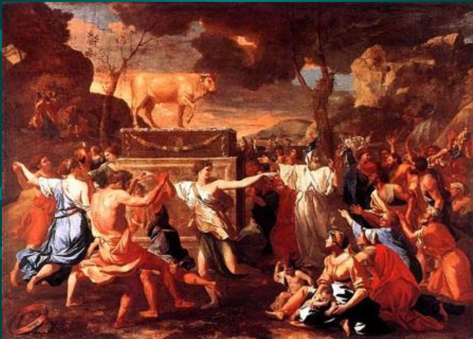
Николо Пуссен. Поклонение золотому тельцу.