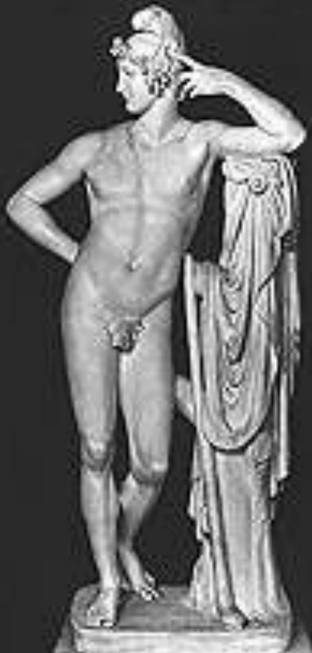
Антонио Канова. «Парис». 1810-1816 годы. Новая пинакотека. Мюнхен.