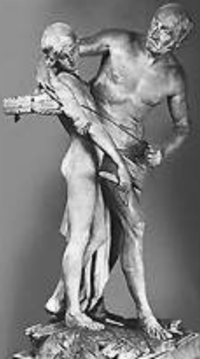
Скульптурная группа Антонио Кановы «Дедал и Икар». 1777-1779 годы. Музей Каррер. Венеция.