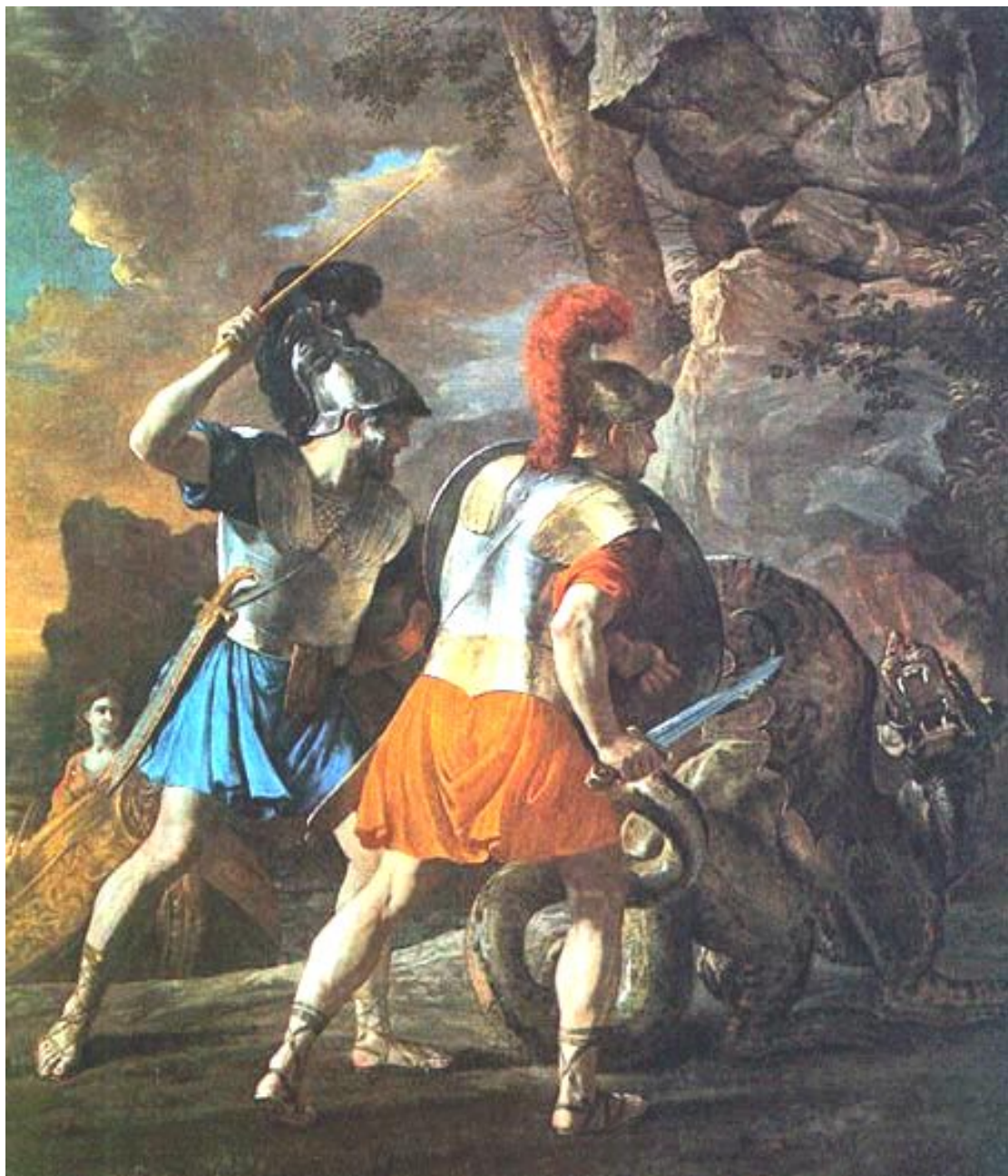
Поединок Ринальдо 1628