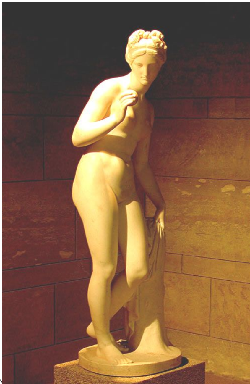
Венера с яблоком