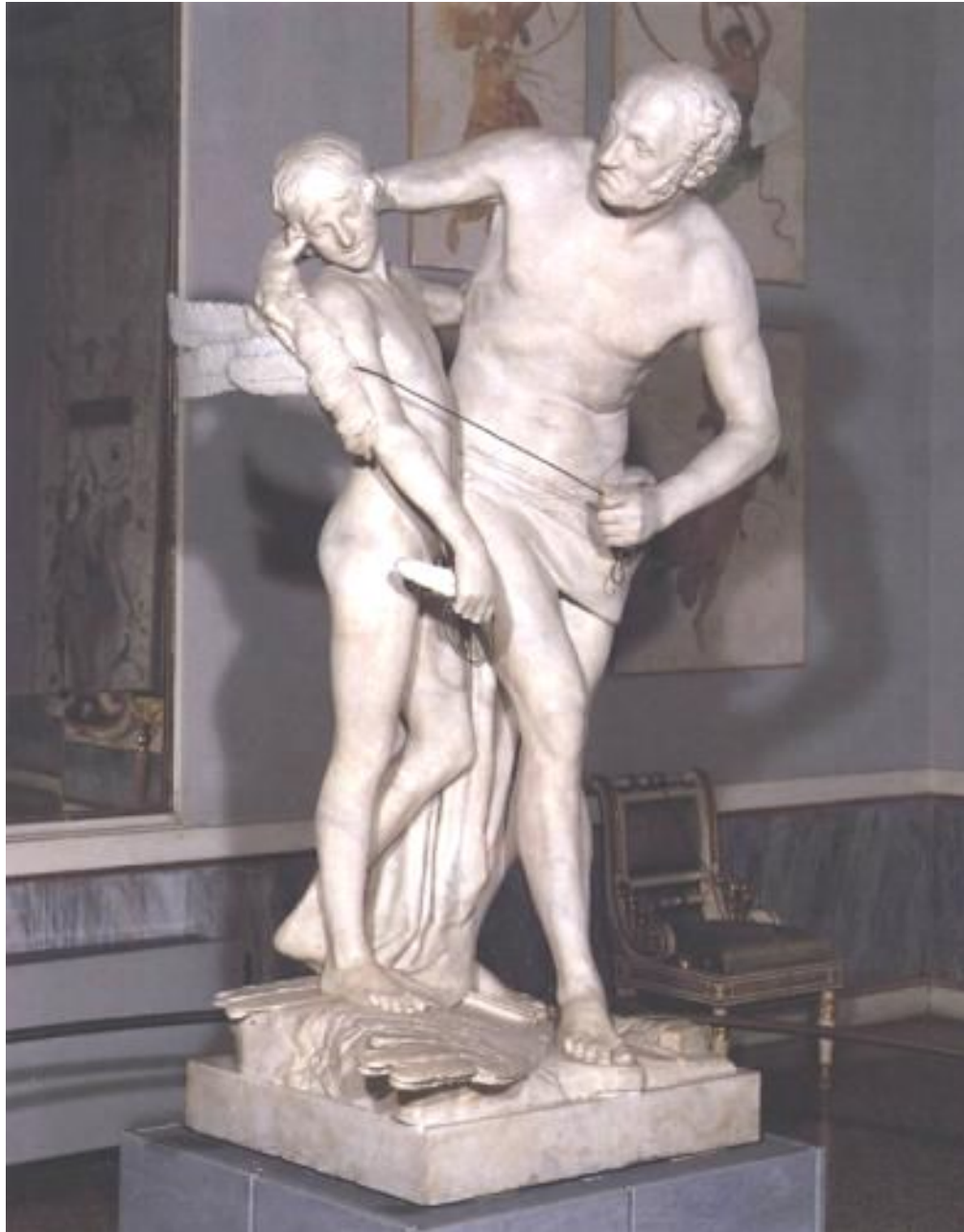
Дедал и Икар. 1777—1779