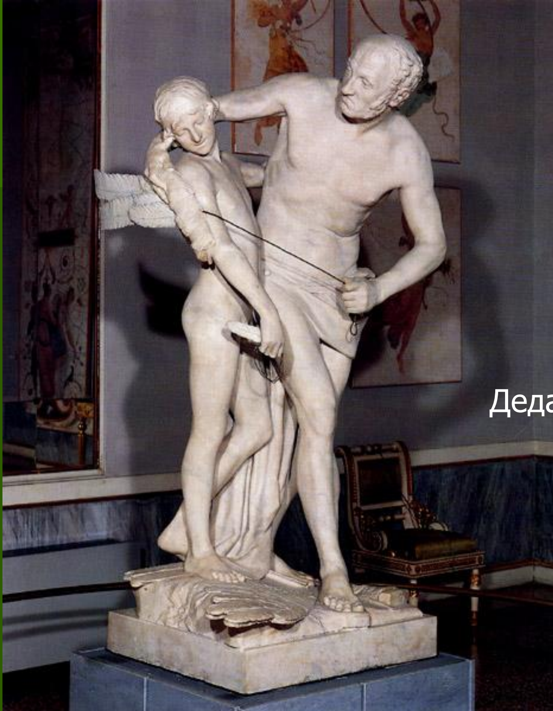
Дедал и Икар