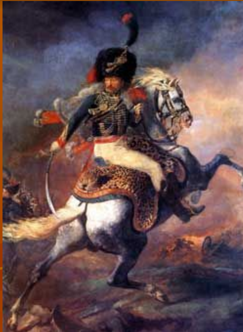
Теодор Жерико(1791-1824) Офицер конных егерей императорской гвардии, идущий в атаку. 1812 г.