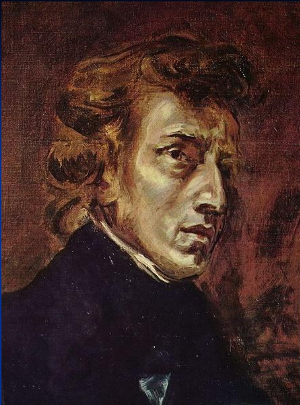
Портрет Шопена работы Эжена Делакруа, 1838