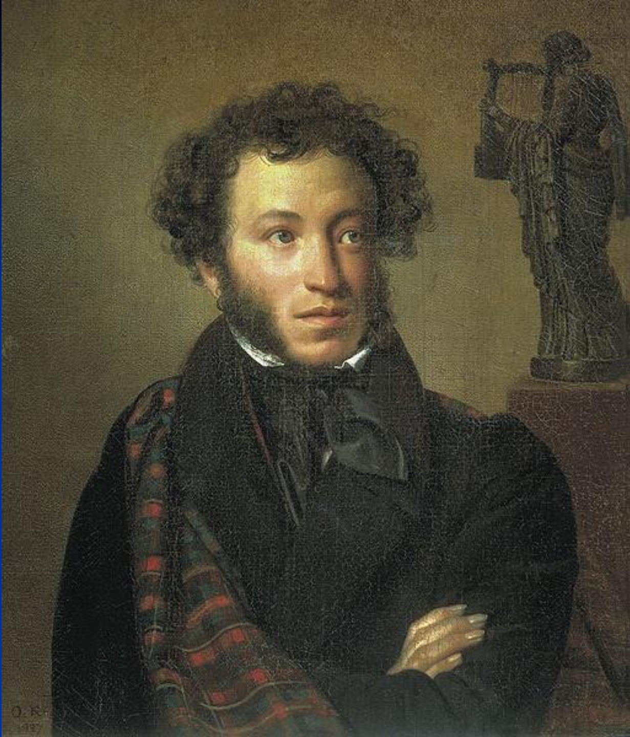
О. Кипренский «Портрет А. С. Пушкина».