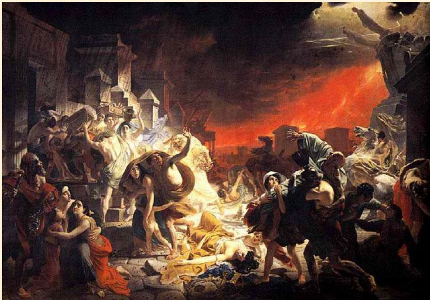
К.П. Брюллов «Последний день Помпеи»