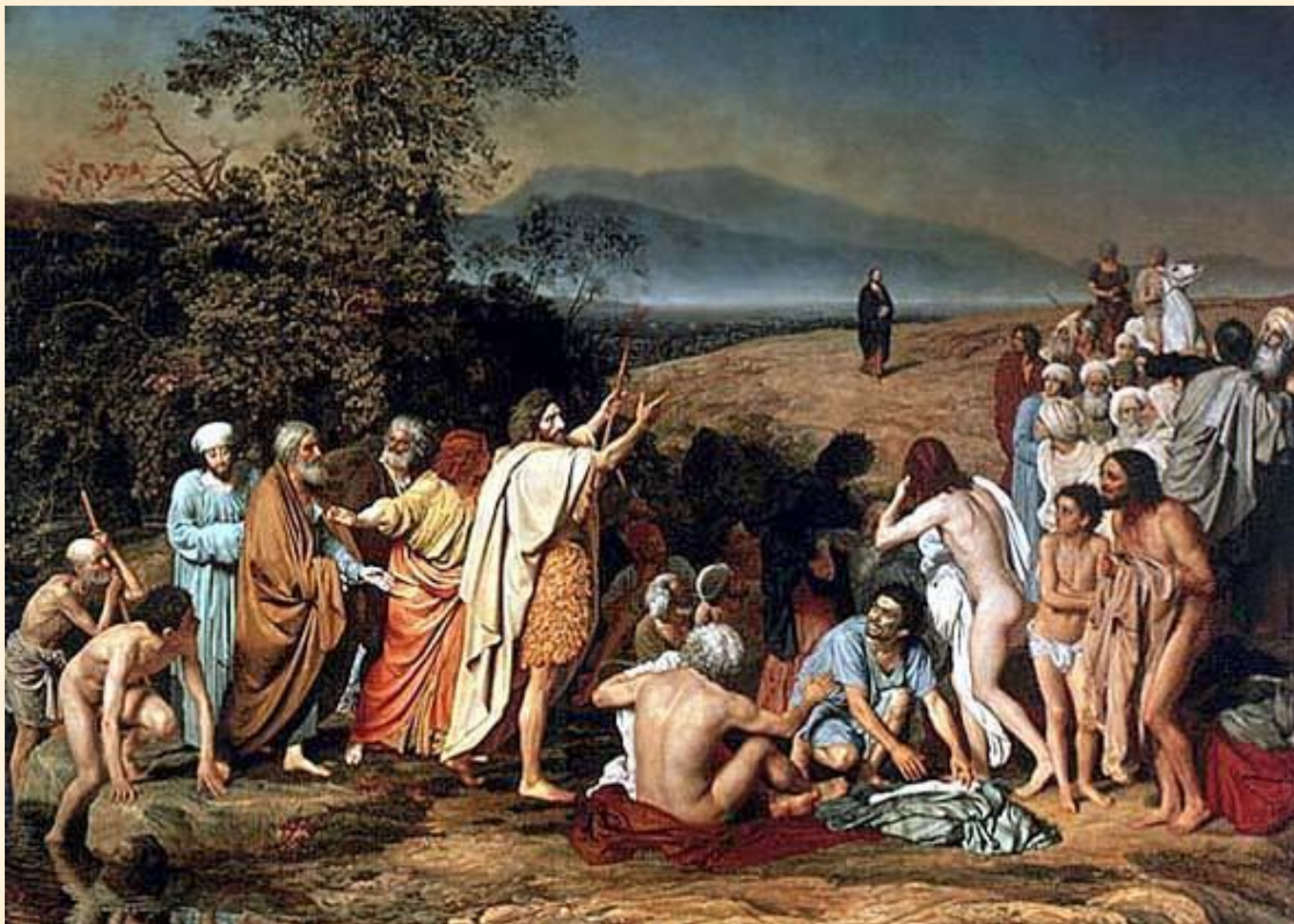
А.А. Иванов «Явление Христа народу»