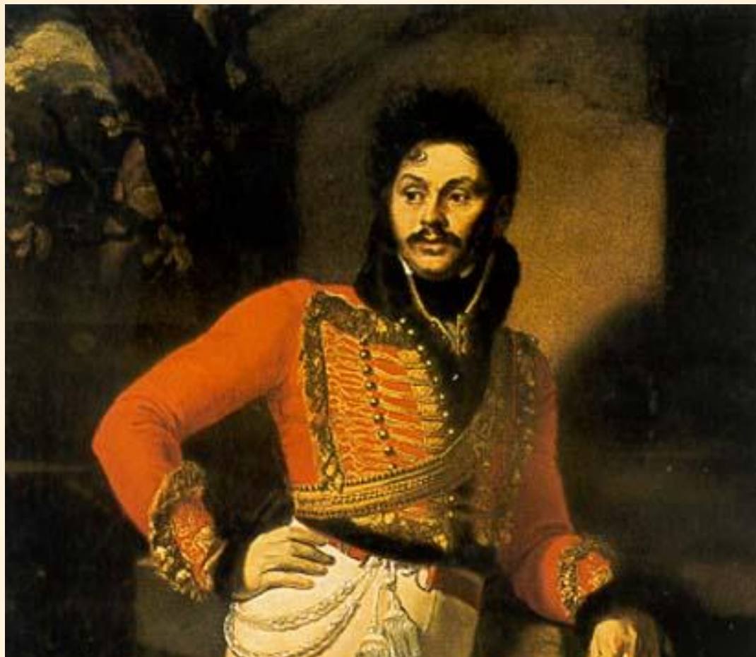
О. А. Кипренский

Портрет Лейб-гусарского полковника Е.В. Давыдова