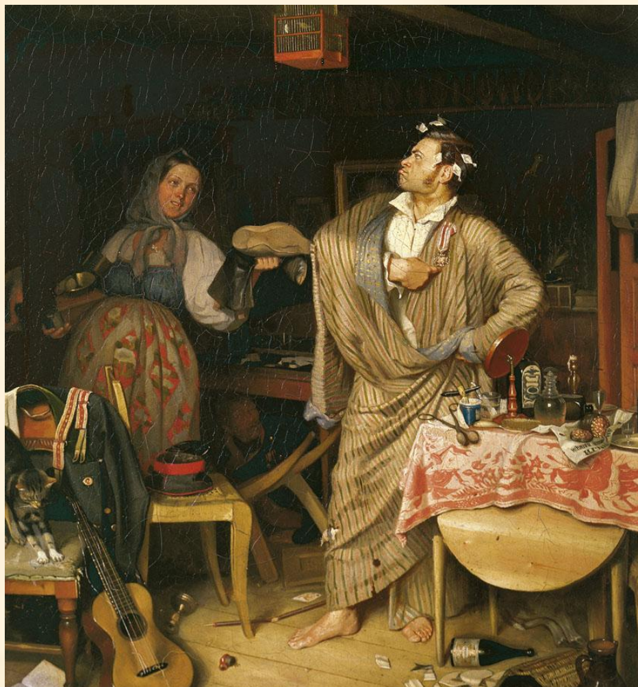
П.А. Федотов Свежий кавалер.