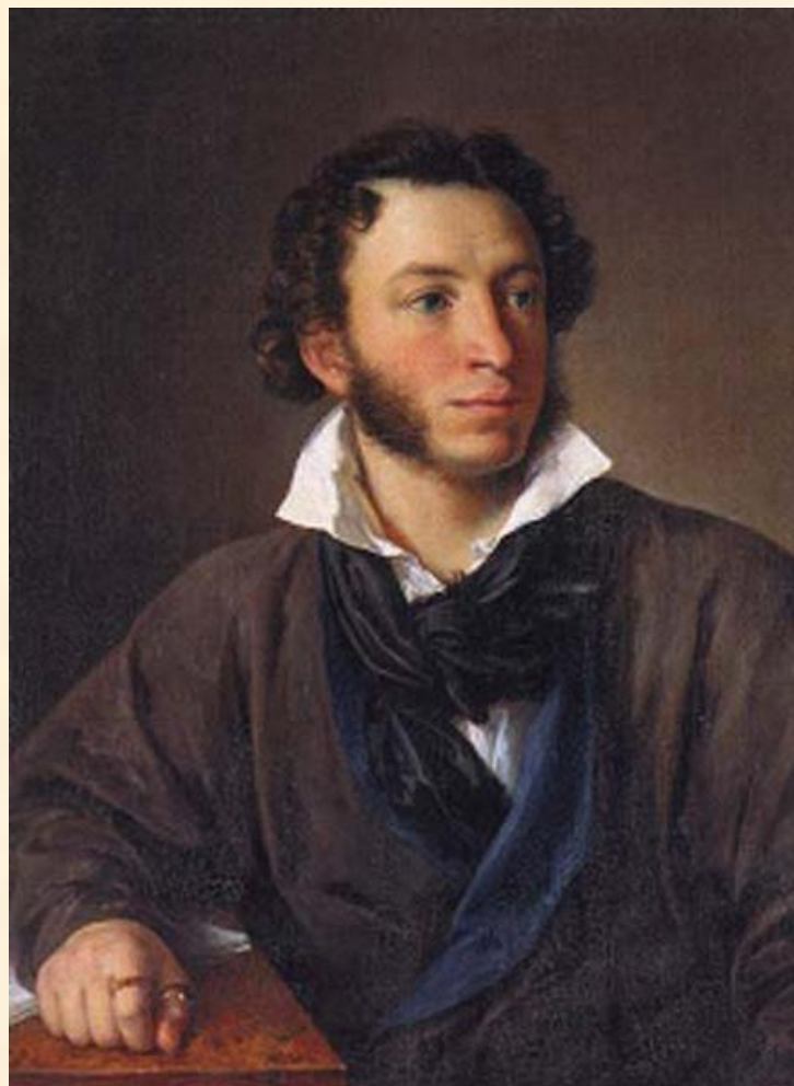
В.А. Тропинин. Портрет А.С. Пушкина