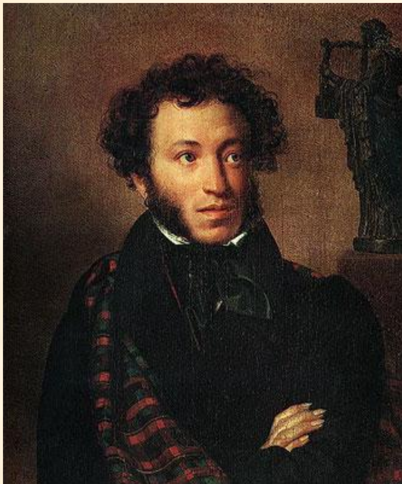
О. А. Кипренский 'Портрет поэта А. С. Пушкина'