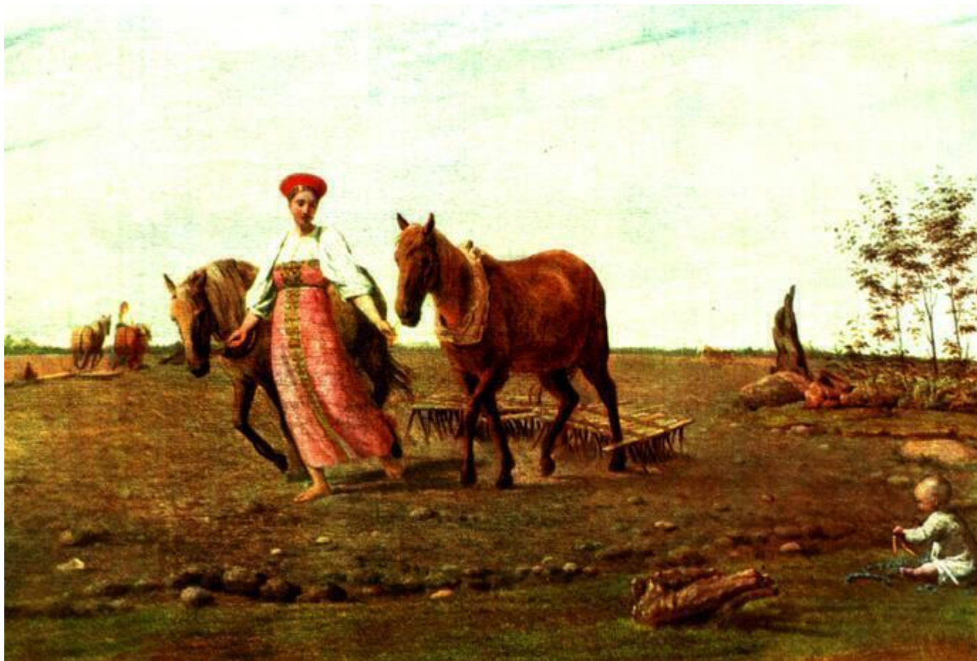
А.Г. Венецианов На пашне.Весна