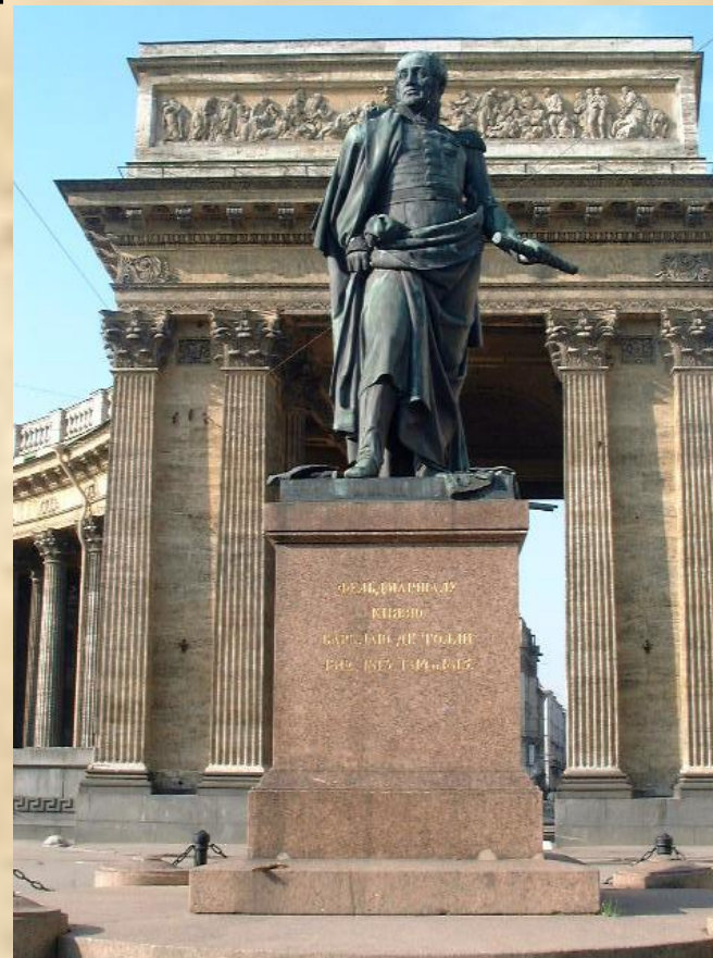
Памятник М.Б. Барклаю де Толли