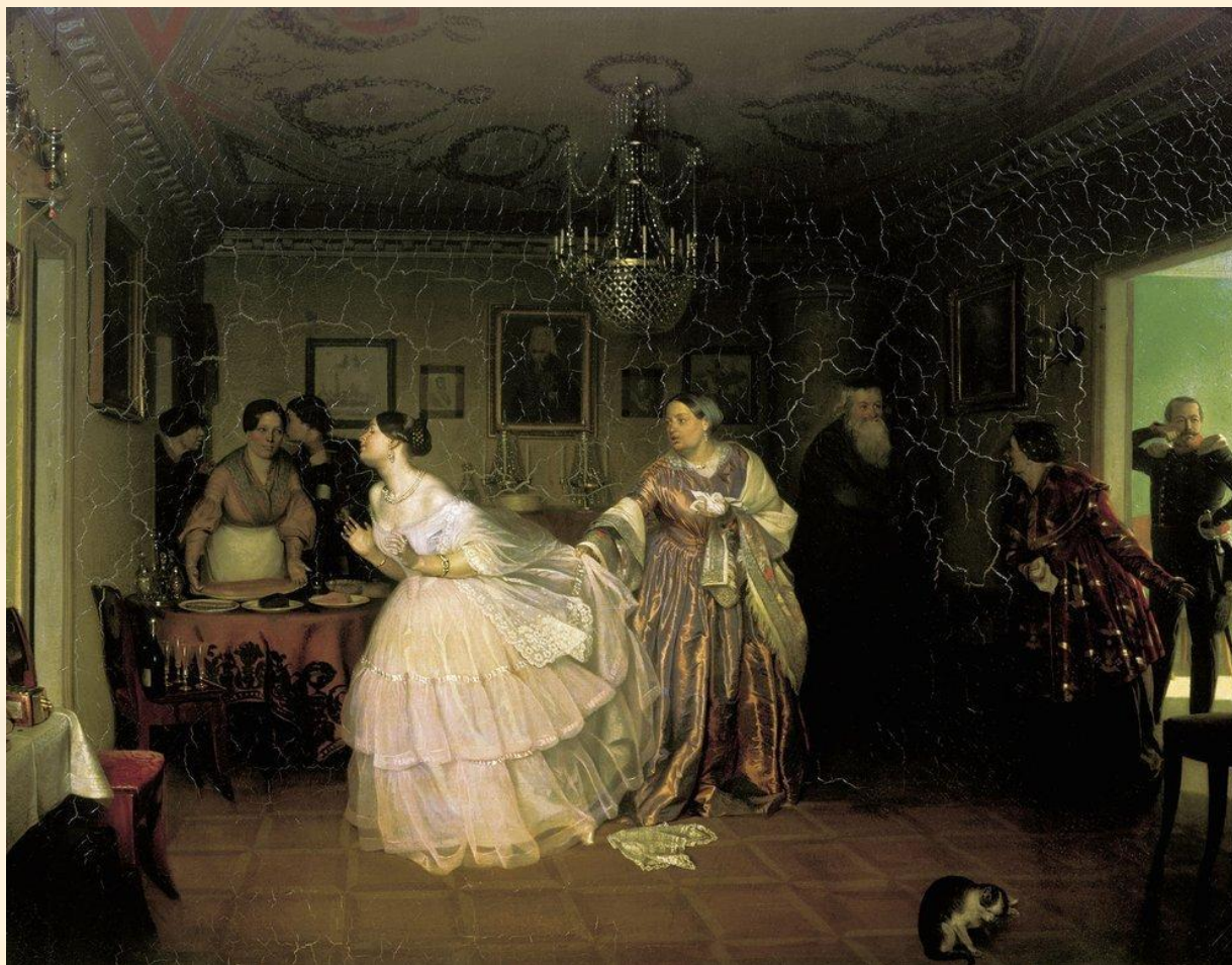
П.А. Федотов Сватовство майора