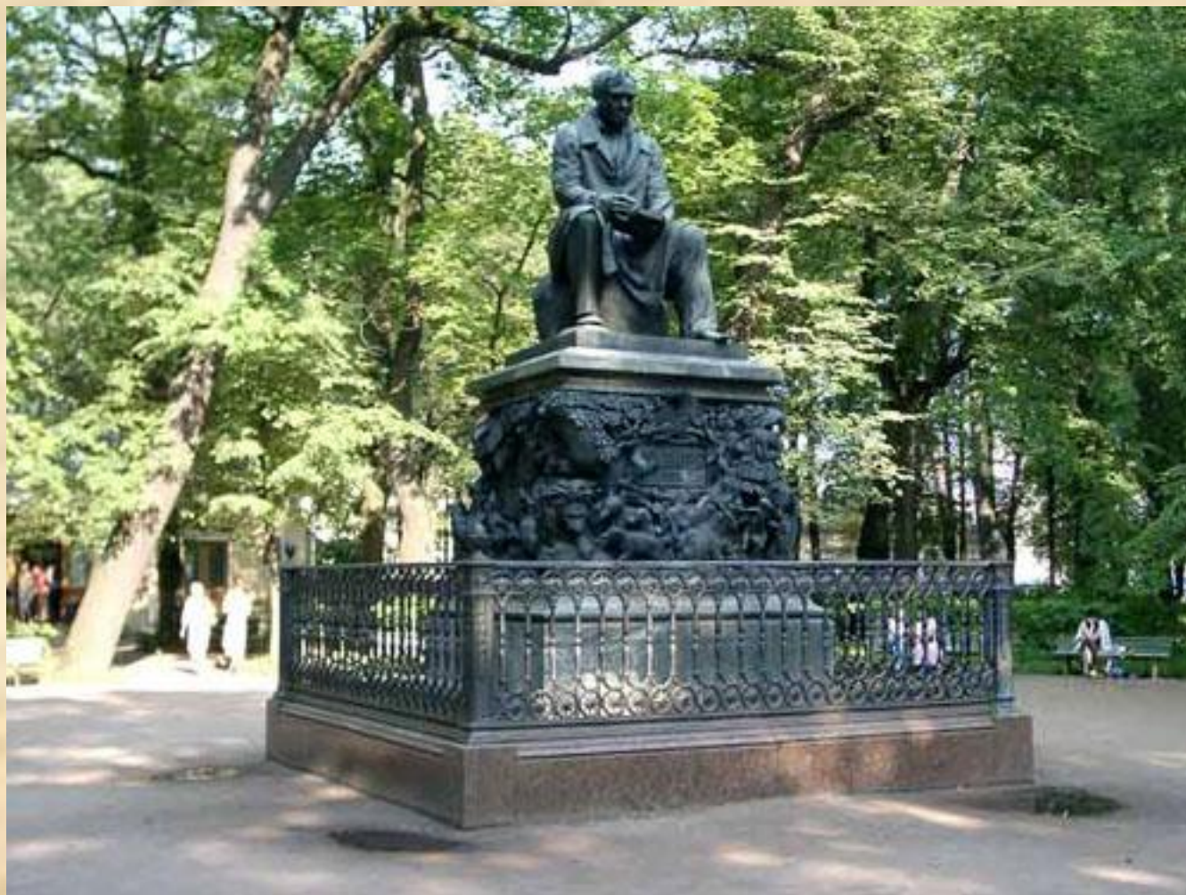
П.К. Клодт Памятник И.А. Крылову