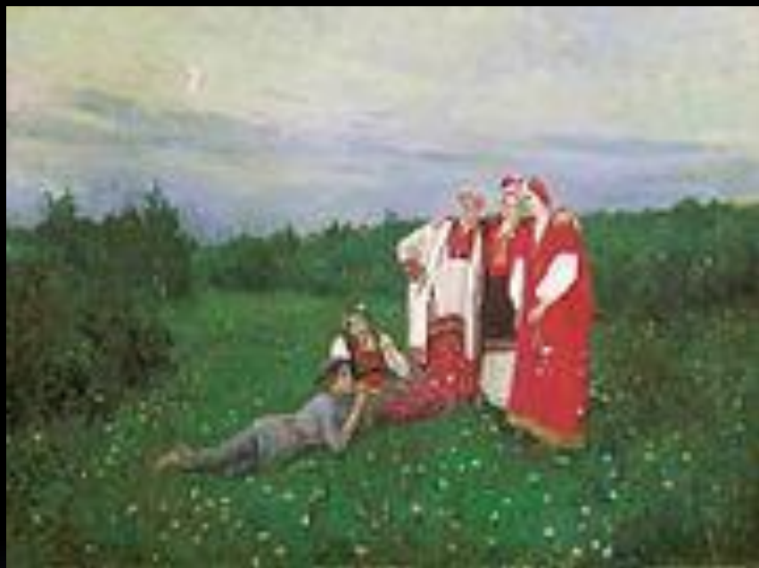
Северная идиллия .